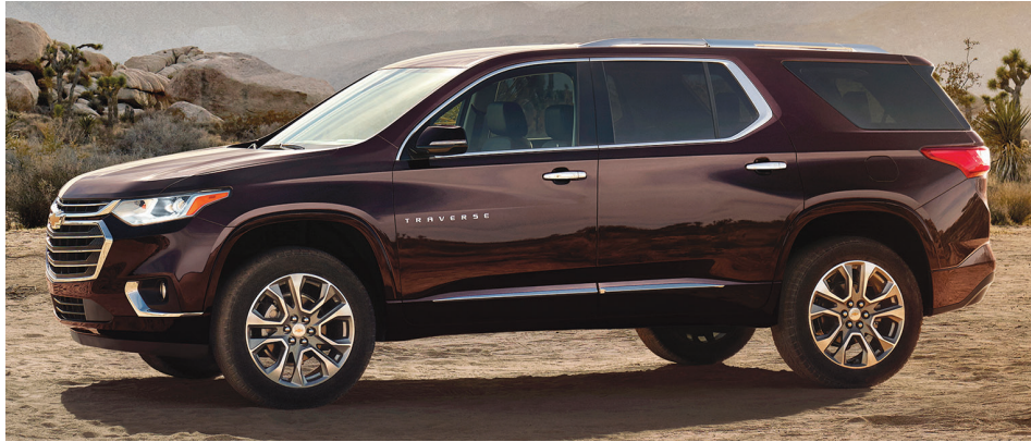
Le Chevrolet Traverse 2018