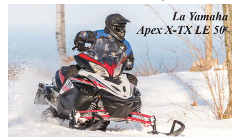
La Yamaha Apex X-TX LE 50 e

Pour souligner le 50 e anniversaire de Yamaha, on trouve des versions commémoratives, comme la Sidewinder L-TX LE 50 e , l'Apex LE 50 e , la SRViper L-TX LE 50 e , la Sidewinder B-TX LE 153 50 e , l'Apex X-TX LE 50 e et la Sidewinder M-TX LE 162 50 e .