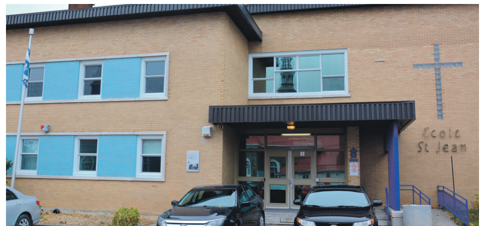
La Commission scolaire de la Côte-du-Sud terminera les travaux qui mettront un terme à un problème de plomb dans l'eau depuis trois ans à l'École Saint-Jean de Saint-Jean-Port-Joli.

S'il y avait toujours trace de plomb, la Commission scolaire devait ensuite attendre les journées pédagogiques ou la période des vacances d'été, l'année suivante, pour effectuer les travaux de remplacement de la tuyauterie par du PVC. « Changer des sections de tuyaux coûtent extrêmement cher et comme les écoles contiennent parfois de l'amiante, les travaux ne peuvent être effectués en présence des enfants », d'ajouter la conseillère