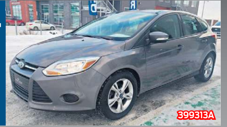
FORD FOCUS SE 2014 Gris | Manuelle |