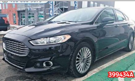
FORD FUSION TITANIUM 2016 Noir | Automatique | 85 245 km