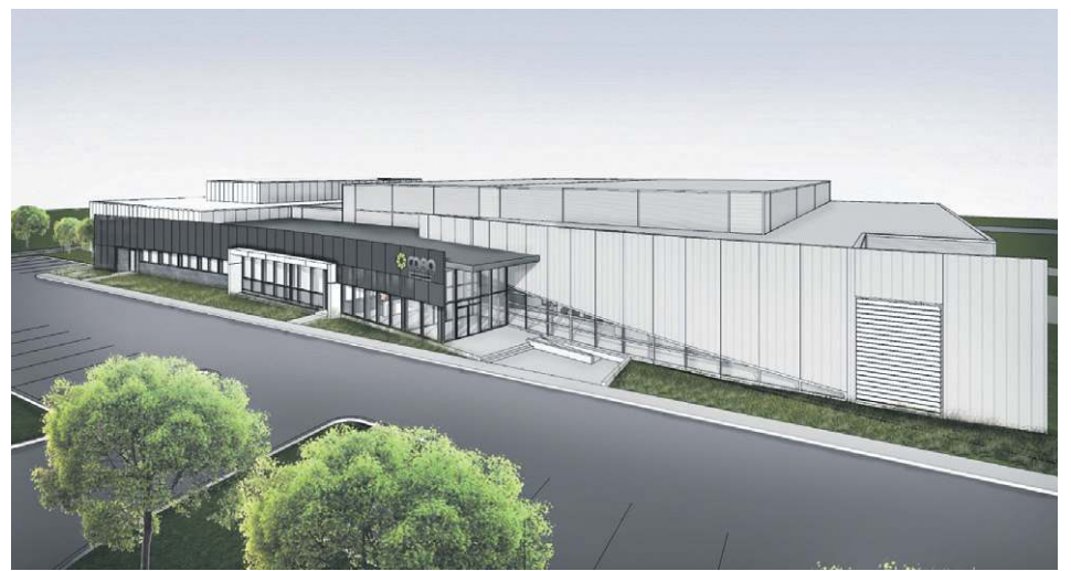
Croquis de l'agrandissement entamé.

Outre la recherche appliquée qui y sera réalisée – un poste de chercheur sera créé dans la foulée de cet agrandissement – ces nouveaux équipements seront également disponibles en location pour les entreprises en incubation au CDBQ, comme Le Labo – Solutions Brassicoles. De plus, les locaux doivent aussi faire office de lieu de formation pratique pour le futur AEC en boisson alcoolisée actuellement en développement à l'ITA, Campus de La Pocatière. La fin des travaux d'agrandissement est prévue pour septembre prochain.