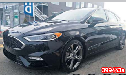
FORD FUSION V6 SPORT 2017 Noir | Automatique | 37 737 km