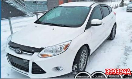
FORD FOCUS SEL 2012 Blanc | Manuelle | 123 896 km