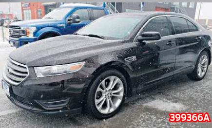
FORD TAURUS SEL 2013 Noir | Automatique | 95 000 km