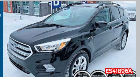
FORD ESCAPE SE 2017 Noir | Automatique | 59 213 km