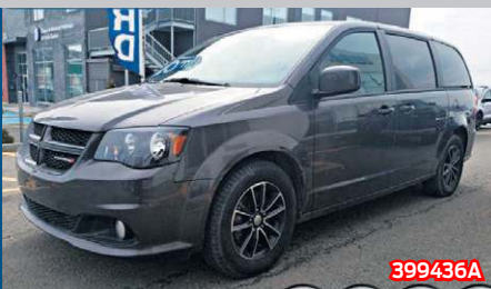
DODGE GRAND CARAVAN GT 2017 Automatique | 59 272 km