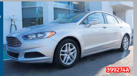
FORD FUSION SE 2016 Argent | Automatique | 30 648 km