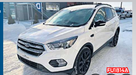
FORD ESCAPE TITANIUM 2017 Blanc | Automatique | 29 600 km