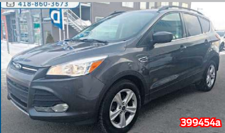
FORD ESCAPE SE 2015 Gris | Automatique | 79 642 km