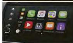
SYSTÈMES APPLE CARPLAY™ 1,2 ANDROID AUTO™ 1,2 DE SÉRIE