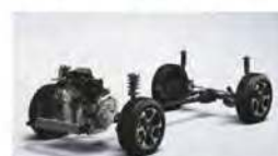
SYSTÈME À ROUAGE INTÉGRAL (REAL TIME AWD™) AVEC SYSTÈME DE CONTROLE INTELLIGENT™ DISPONIBLE