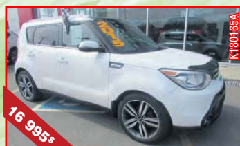
KIA SOUL SX BA 2015 Automatique, 4 cyl., 2,0 L, 33 900 km