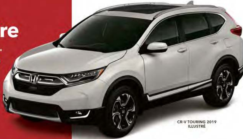
CR-V TOURING 2019 ILLUSTRÉ