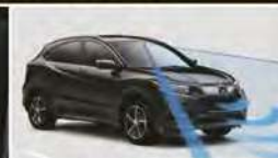
TECHNOLOGIES* DE SÉCURITÉ HONDA SENSING™ DE SÉRIE