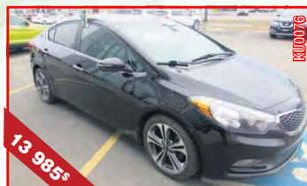
KIA FORTE SX 2015 Automatique, 4 cyl., 2,0 L, 69 781 km