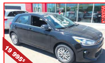
KIA RIO 5 EX BA 2018 Automatique, 1,6 L, 700 km