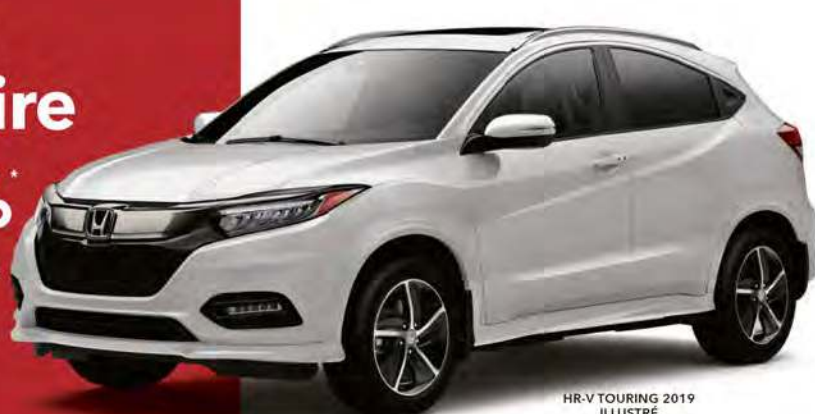
HR-V TOURING 2019 ILLUSTRÉ