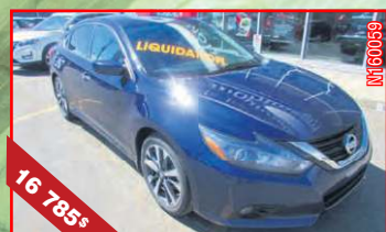
NISSAN ALTIMA 2.5 SR 2016 Automatique (CVT), 4 cyl., 2,5 L, 53 900 km