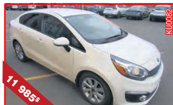
KIA RIO BERLINE, EX 2016 Automatique, 4 cyl., 1,6 L, 33 461 km