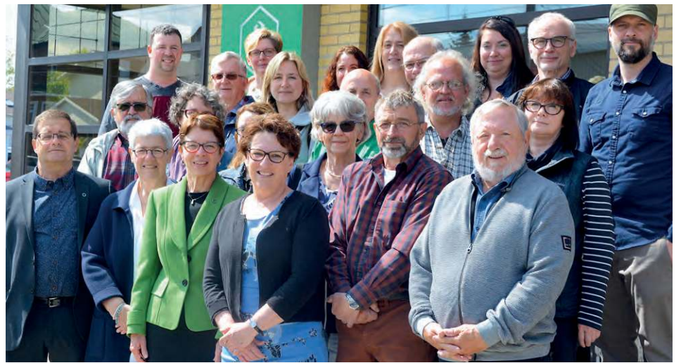
Sur la photo en haut à droite: Représentants de la Caisse Desjardins du Centre de Kamouraska, accompagnés des mandataires des différents comités ayant reçu une aide financière destinée à la concrétisation de leur projet.