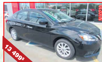
NISSAN SENTRA CVT SV 2016 Automatique (CVT), 1,8 L, 33 901 km

Notre nouvelle équipe pour vous conseiller