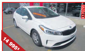
KIA FORTE LX 2017 Automatique, 4 cyl., 2,0 L, 13 346 km