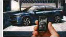
DEMARREUR À DISTANCE DISPONIBLE