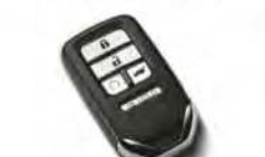
DEMARREUR À DISTANCE DE SÉRIE