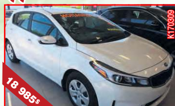
KIA FORTE 5 LX+ AT 5P 2017 Automatique, 2,0 L, 140 km