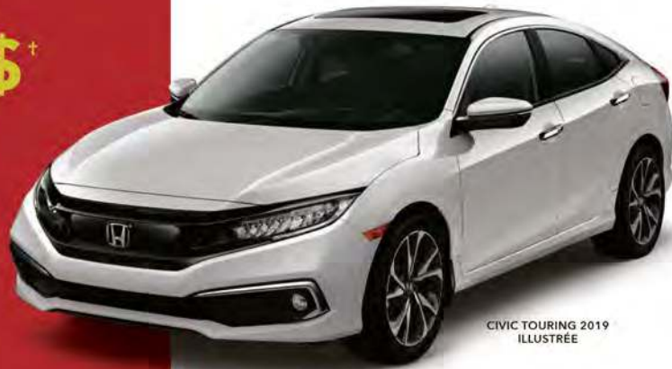
CIVIC TOURING 2019 ILLUSTRÉE