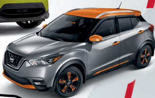
Qashqai et Kicks 2018 illustrés

LOUEZ LA MICRA S À BOÎTE MANUELLE POUR 170 $* / MOIS PENDANT 60 MOIS.