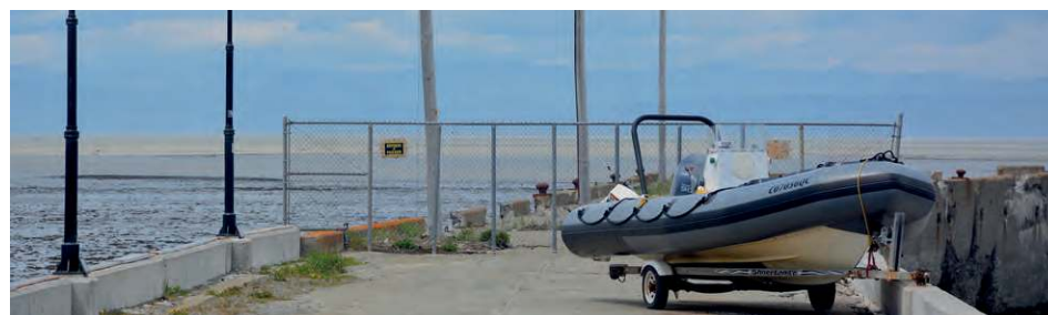
Le quai Taché à Kamouraska.