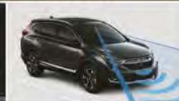
TECHNOLOGIES* DE SÉCURITÉ ET D'AIDE À LA CONDUITE HONDA SENSING™ DISPONIBLES