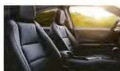
SIÈGES AVANT CHAUFFANTS DE SÉRIE