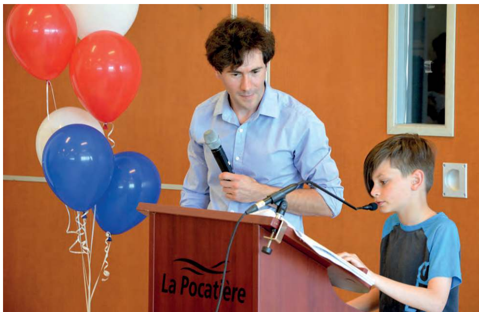
Quelques élèves ont fait, en partie, la lecture de leur texte dans le recueil.