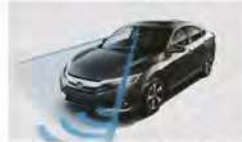
TECHNOLOGIES* DE SÉCURITÉ HONDA SENSING™ DISPONIBLES