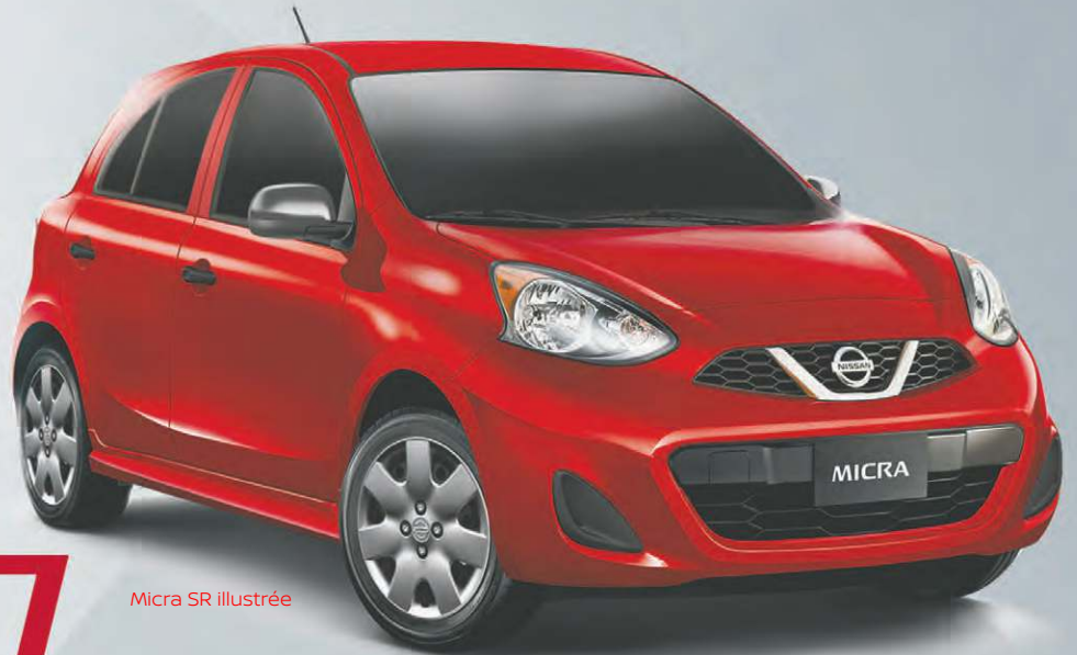
Micra SR illustrée