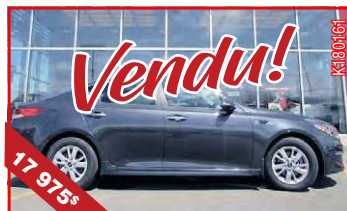
KIA OPTIMA, LX BA 2018 Automatique, 4 cyl., 2,4 L, 13 384 KM