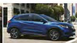
SYSTÈME À ROUAGE INTÉGRAL (REAL TIME AWD™) AVEC SYSTÈME DE CONTROLE INTELLIGENT™ DISPONIBLE