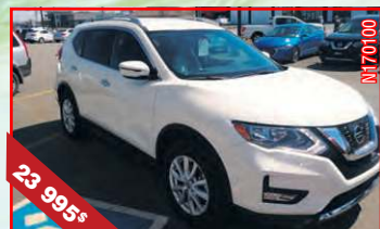
NISSAN ROGUE S TI *DISPONIBILITÉ LIMITÉE* 2017 Automatique (CVT), 4 cyl., 2,5 L, 700 km