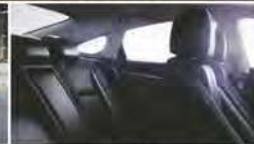
SIÈGES AVANT ET ARRIÈRE CHAUFFANTS DISPONIBLES