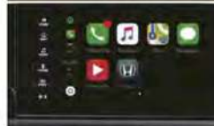
SYSTÈMES APPLE CARPLAY™ 1,2 ANDROID AUTO™ 1,2 DE SÉRIE