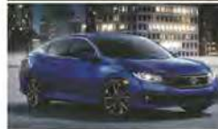
MOTEUR 1,5L TURBO DÉVELOPPANT 174 CHEVAUX* DISPONIBLE