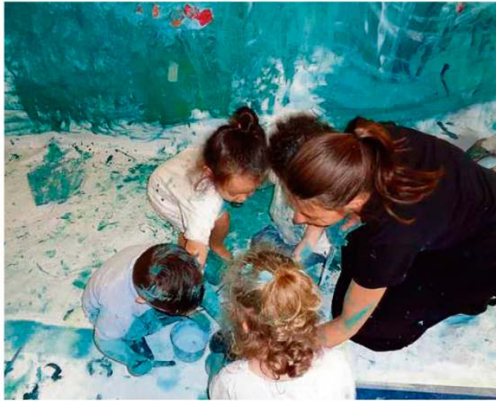
L'écho de l'écume, un spectacle qui allie danse et création, présenté dans les CPE de La Pocatière, Saint-Alexandre-de-Kamouraska et Saint-Pascal entre le 24 septembre et le 3 octobre.