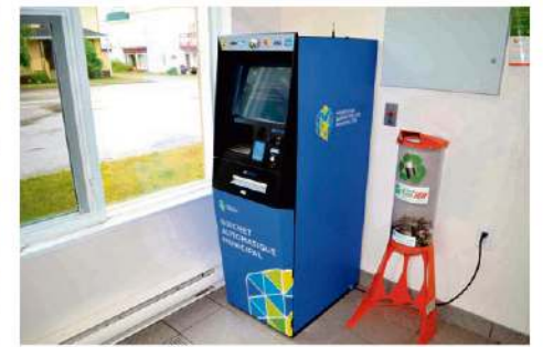
Le guichet de Saint-André.

Saint-André a aussi reçu la même proposition que les deux autres municipalités et a accepté le tout.