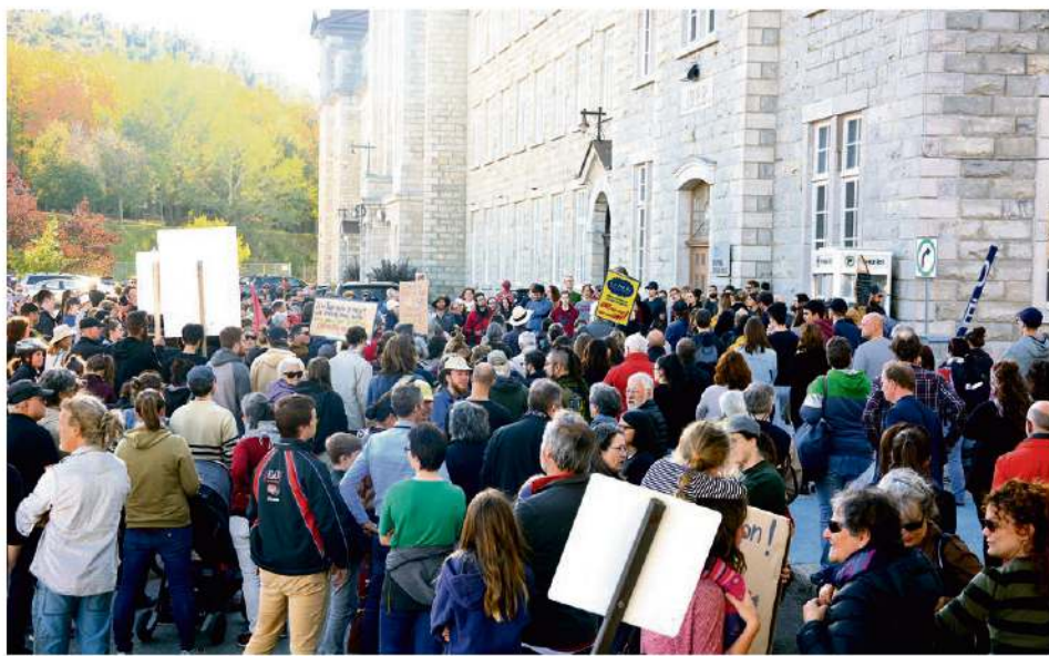
Rassemblement avant le départ.