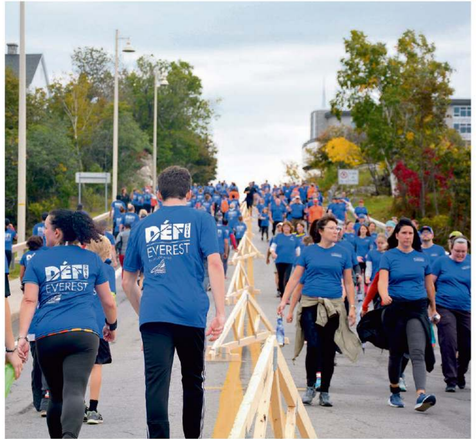
Le Défi Everest à son paroxysme.

Les résultats financiers finaux seront dévoilés ultérieurement lors de la remise officielle des sommes amassées aux organismes sélectionnés par les équipes. Le comité organisateur donne maintenant rendez-vous l'an prochain pour une deuxième édition du Défi Everest à La Pocatière. La date sera déterminée sous peu.