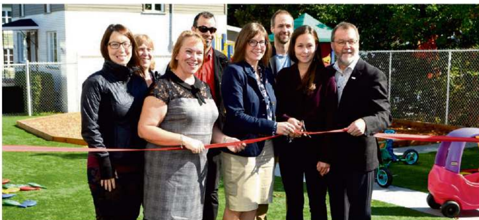
Les principaux intervenants à l'inauguration de la nouvelle aire de jeux du CPE La Farandole.