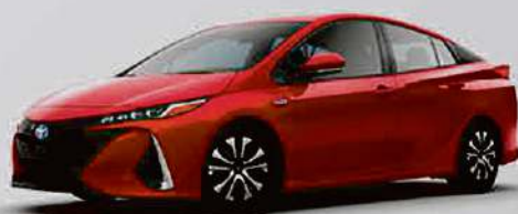
Véhicule illustré 2020 Prius Prime Standard Package

• Système pré-collision avec fonction de détection des piétons et des véhicules de jour et dans des conditions de faible éclairage, et détection des cyclistes de jour • Alerte de sortie de voie avec assistance à la direction et détection des bords de la route • Phares de route automatiques • Système d'avertissement de sortie de voie • Régulateur de vitesse dynamique à radars avec plage complète de vitesses