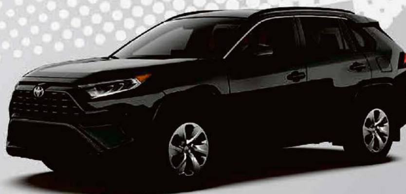
Véhicule illustré 2020 RAV4 LE 2rm

Obtenez la suite Toyota Safety Sense™ 2.0 sans frais supplémentaires sur nos modèles les plus populaires*.