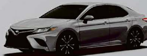
Véhicule illustré 2019 Camry SE

À PARTIR DE 75 $ | PRIX SUGGÉRÉ DE 35 234 $* PAR SEMAINE, LOCATION SUR 64 MOIS, 0 $ D'ACOMPTE