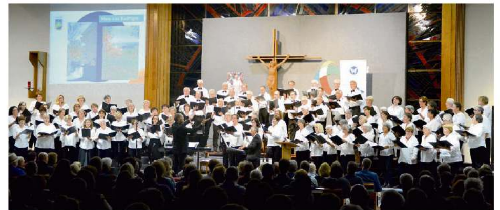
Le Chœur en couleur.