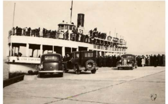
Le traversier L'Île D'Orléans à L'Islet vers 1937.

Pour la pêche aux petits poissons, pour le paysage et pour les brèves croisières.