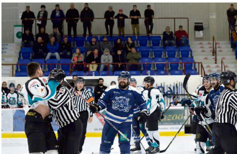
Les Seigneurs de La Pocatière ont encaissé un gain de 6-3 face à l'Impérial de Saint-Pascal.