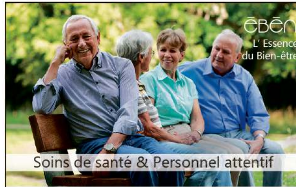
Soins de santé & Personnel attentif

Votre santé et votre sécurité nous tiennent à coeur.