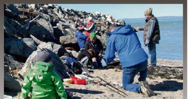
P. 5 Cinq ans pour Projet Pères