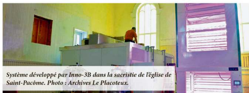
Système développé par Inno-3B dans la sacristie de l'église de Saint-Pacôme.

L'entreprise Inno-3B, spécialisée dans la fabrication et la distribution d'équipements automatisés d'agriculture verticale, loue désormais des locaux chez Roland & Frères à Saint-Pacôme. Depuis un an, les bureaux de l'entreprise étaient installés principalement dans l'église de Saint-Pacôme et un petit atelier permettait de travailler les systèmes d'agriculture verticale en développement.