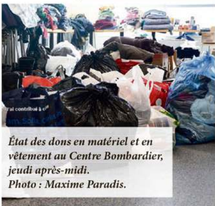
État des dons en matériel et en vêtement au Centre Bombardier, jeudi après-midi.