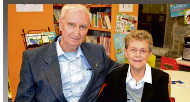
P. 20 Un don rare