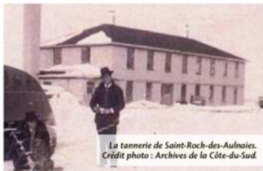
La tannerie de Saint-Roch-des-Aulnaies.