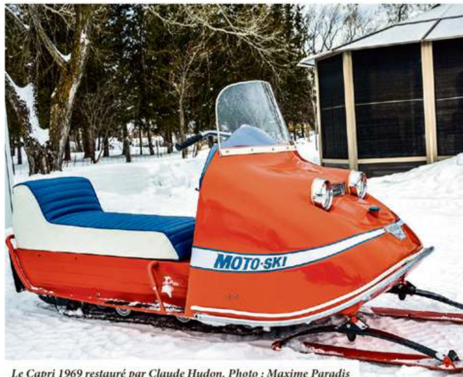
Le Capri 1969 restauré par Claude Hudon.

to-Ski qu'il s'efforce de faire revivre à sa façon par la restauration de leurs anciens modèles. Et si l'envie lui prend de se sentir de nouveau comme à l'âge de 15 ans, il a maintenant sous la main son Capri 1969, neuf comme s'il sortait de l'usine, pour s'abandonner au plaisir d'une balade aléatoire sur ses terres, comme il le faisait jadis, à une époque pas si lointaine.