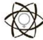
Table de concertation des groupes de femmes du Bas-Saint-Laurent

Dès qu'ils savent parler, on apprend aux enfants à ne pas s'exprimer avec de gros mots, à demander la permission avant de prendre ce qui ne leur appartient pas, à dire s'il vous plaît, merci. À la garderie, à l'école (comme à la maison), on enseigne aux jeunes les règles de savoir-vivre comme attendre son tour pour parler, ne pas chanter la bouche pleine. On leur inculque des valeurs de respect, d'inclusion. On condamne l'intimidation et la violence. On