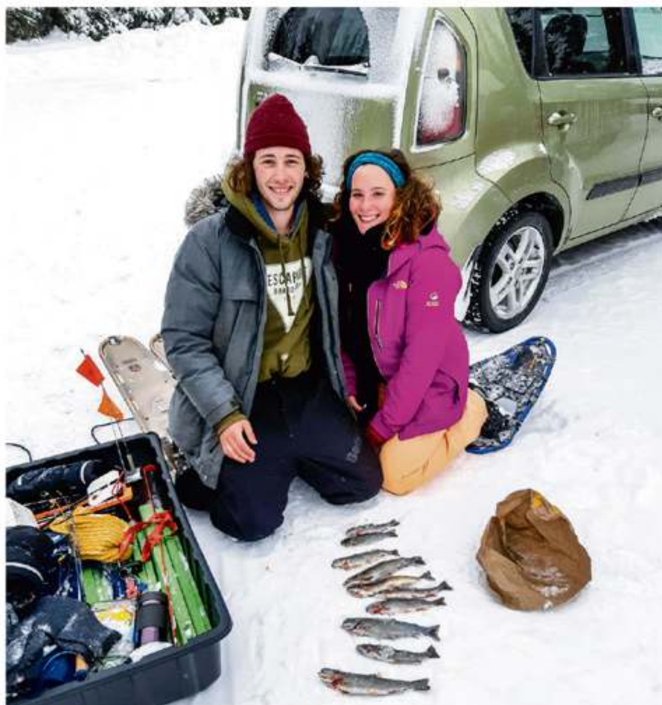
Pêche réalisée lors de la fin de semaine du 1 er et 2 février.

Malgré les tristes noyades de motoneigistes survenues récemment sur des