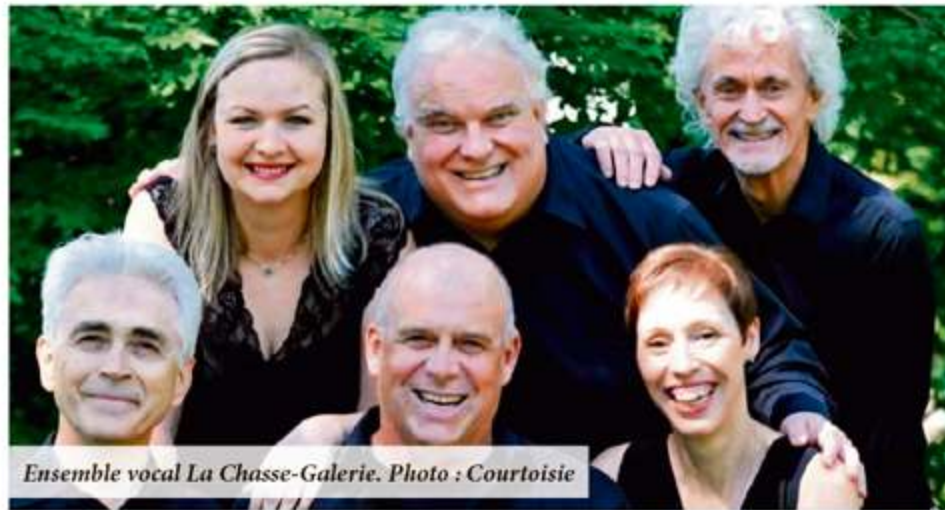
Ensemble vocal La Chasse-Galerie.

Pour en savoir davantage sur les « Concerts au Musée » rendez-vous sur le site lesconcerts.ca/musee .