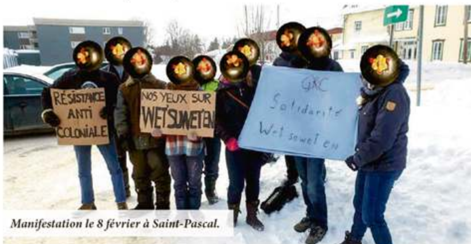
Manifestation le 8 février à Saint-Pascal.