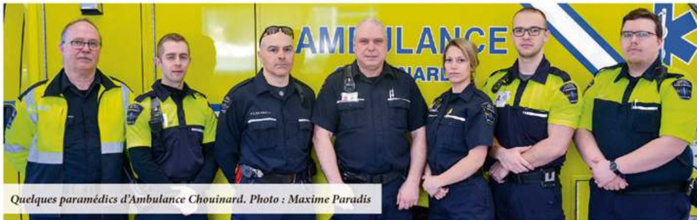
Quelques paramédics d'Ambulance Chouinard.

Il ne s'agit pas d'un, mais bien des deux mobiles ambulanciers qui fonctionnent toujours selon un horaire de faction à La Pocatière. Rappelons que ceux-ci obligent les paramédics à vivre dans un rayon de cinq minutes en voiture de la caserne ambulancière à laquelle ils sont assignés, afin d'être disponible en tout temps sur appel, sept jours sur 14 (7/14), et cela, 24h/24. Une situation inconcevable en 2020 pour Tommy Chouinard, propriétaire de l'entreprise Ambulance Chouinard.