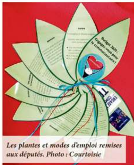
Les plantes et modes d'emploi remis aux députés.