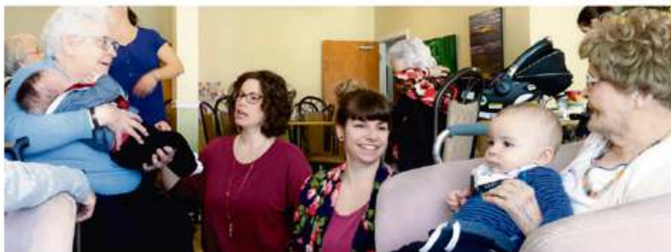
Au quotidien sur leplacoteux.com

vailles, haltes-garderies, etc.) qui participent à ces visites. Durant l'activité, les mamans échantent avec les aînés qui, à leur plus grand bonheur, peuvent bercer les plus jeunes (les mamans ont le choix d'accepter ou non). Ces moments sont toujours magiques. Les petites discussions et le plaisir de voir les enfants bouger et interagir entre eux suffisent pour mettre un sourire aux lèvres des participants et des étoiles dans leurs yeux.