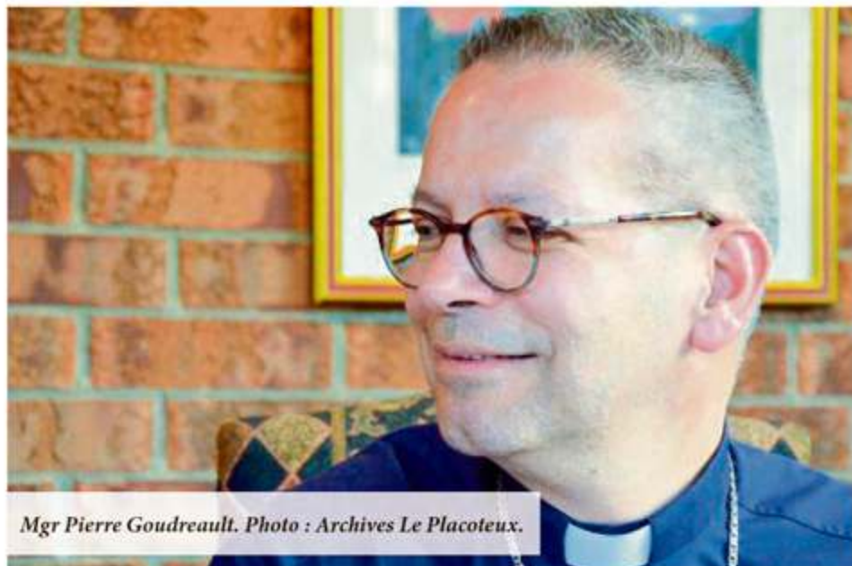
Mgr Pierre Goudreault.

L'Évêque du diocèse Mgr Pierre Goudreault a tenu à rappeler aux paroisses, prêtres et présidents d'assemblées de fabriquer ses directives quant à la célébration de funérailles chrétiennes dans un lieu autre que l'église paroissiale.