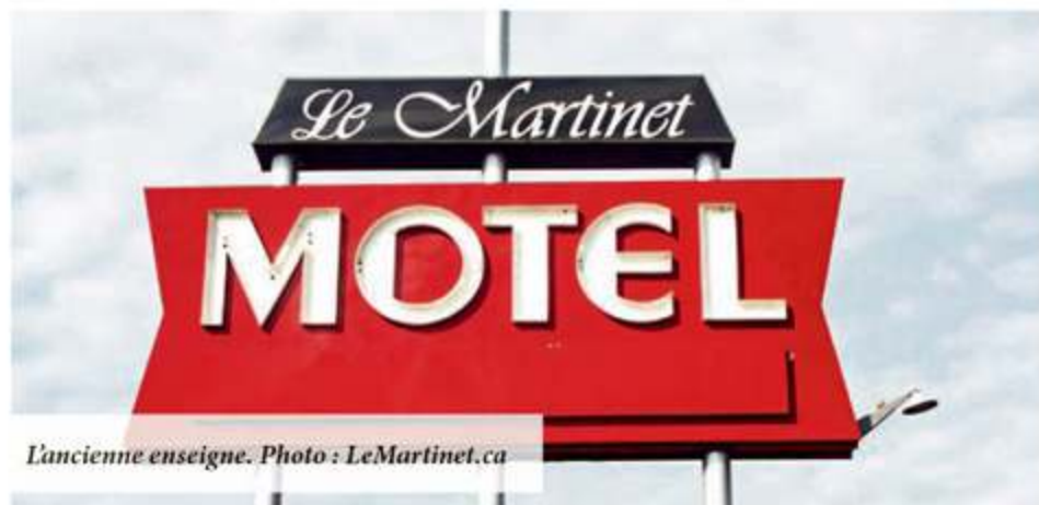
L'ancienne enseigne.