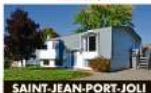
SAINT-JEAN-PORT-JOLI 321, rue Jean-Lacroix 189 500 $