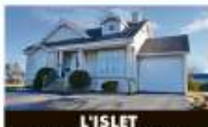
L'ISLET 140, ch. Des Pionniers Ouest 229 000 $