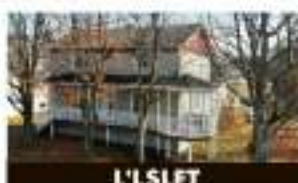
L'ISLET 110, de la Petite Gaspésie 139 500 $