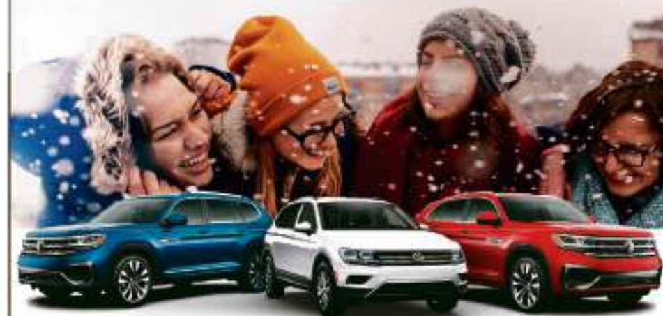
Le Levi 2021 7 sièges puissance accrue 7 airbags

Mettez vos paiements sur la glace, on vous offre jusqu'à 3 mois à nos frais