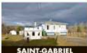
SAINT-GABRIEL 17, avenue des Érables 138 500 $