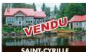
SAINT-CYRILLE 465, Lac-des-Plaines VENDU