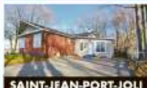
SAINT-JEAN-PORT-JOLI 15, rue des Pionniers Ouest 349 000 $