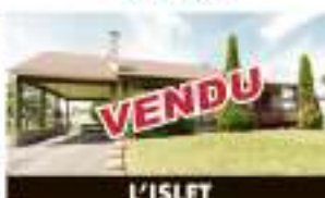
L'ISLET 51, 10 e Rue VENDU