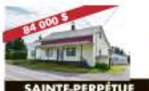
SAINTE-PERPÉTUE 256, rue Principale Sud 84 000 $