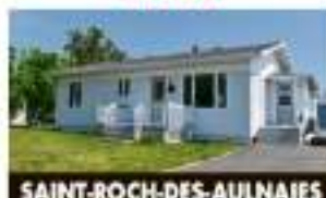
SAINT-ROCH-DES-AULNAIES 1110, route de la Selgeourie 158 000 $