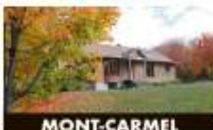
MONT-CARMEL 45, rue de la Fabrique 150 000 $