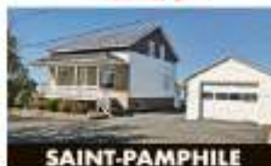
SAINT-PAMPHILE 18, rue Lacroix 79 000 $