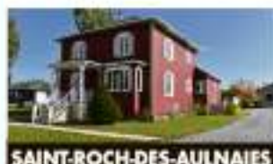
SAINT-ROCH-DES-AULNAIES 1117, route de la Selgeourie 248 500 $