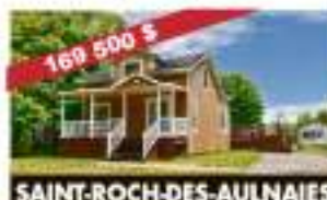
SAINT-ROCH-DES-AULNAIES 114, rue Pierre-de-St-Pierre 169 500 $