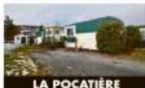
LA POCATIÈRE 928, rue Aloué-Boisblat 68 500 $