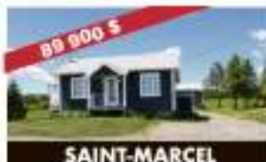
SAINT-MARCEL 34, ch. Taché Ouest 89 900 $