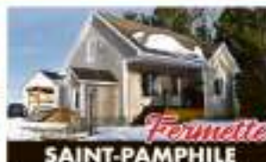
SAINT-PAMPHILE 658, Rang Double 259 000 $