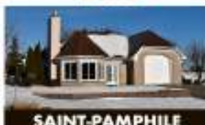
SAINT-PAMPHILE 116, 1 er Rue 269 000 $