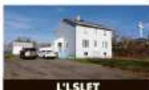
L'ISLET 65, 9 e Rue 174 950 $