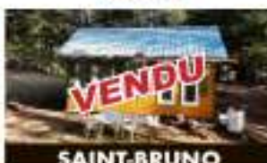
SAINT-BRUNO 18, ch. De la Rivière VENDU