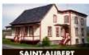
SAINT-AUBERT 84, rue Principale Ouest 179 500 $