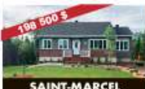
SAINT-MARCEL 37, ch. Du Lac-Festale-Claire S. 198 500 $