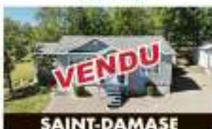
SAINT-DAMASE 27, rue Bélanger VENDU

Vous trouverez plus de 100 propriétés à voir sur gillescouteur.com