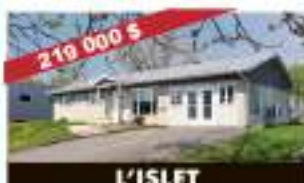
L'ISLET 157, ch. des Pionniers Ouest 219 000 $