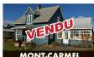
MONT-CARMEL 200, 6 e Rang VENDU