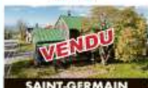
SAINT-GERMAIN 460, rue Principale VENDU