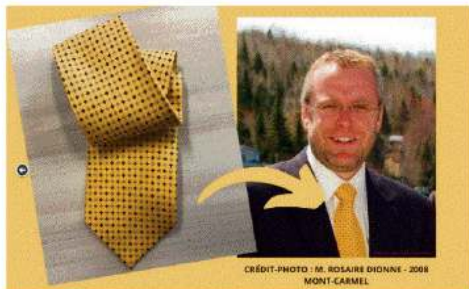
2008 MONT-CARMEL