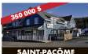
SAINT-PACÔME 188, boulevard Bégin 350 000 $