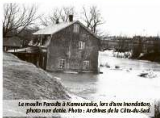
Le moulin Paradis à Kamouraska, lors d'une inondation, photo non datée.

C'est le cas d'Édouard Pelletier qui est aussi navigateur et gardien de phare à Saint-Roch-des-Aulnaies. Celui-ci fait l'acquisition en 1860 d'un moulin construit en bordure de la rivière Kamouraska au sud du village. Il embauche le charpentier Marcel Lebrét dit Saint-Amant pour faire certains travaux qui comprennent la construction d'une dalle.