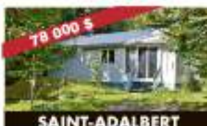
SAINT-ADALBERT 32, ch. De la Rivière-Noire 78 000 $