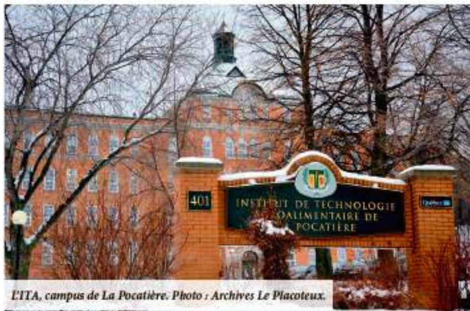
L'ITA, campus de La Pocatière.

ne serait-ce que pour être en mesure de bien couvrir certains services qui sont offerts actuellement par la structure ministérielle. Le ministre souhaite que la nouvelle structure soit attachée à la fin du printemps et opérationnelle dès le 1 er juillet 2021.