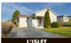
L'ISLET 5, boulevard Wilton-Lacroix 98 000 $