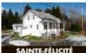
SAINTE-FÉLICITÉ 676, rue Principale 78 500 $