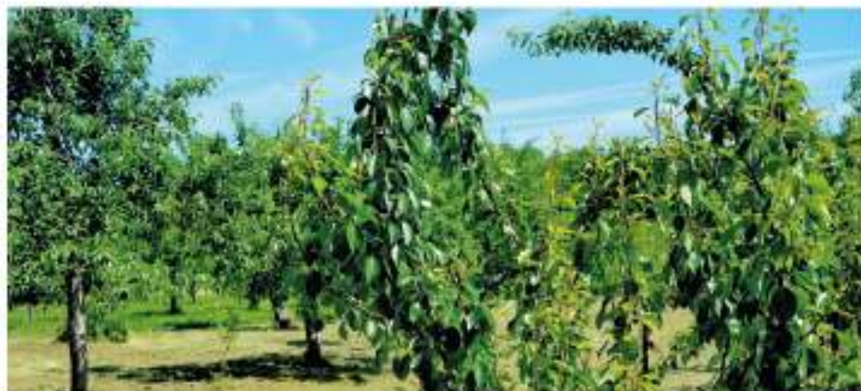
Aperçu du Verger patrimonial de la Côte-du-Sud à Sainte-Anne-de-la-Pocatière.