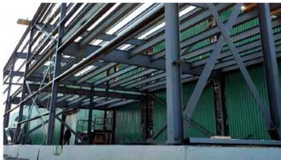
Agrandissement chez Fonderie Poitras en 2017.

Créée en 1920, Fonderie Poitras a développé une expertise dans la production de pièces moulées, vendues à 95 % au marché de l'industrie automobile. L'usine occupe plus de 90 000 pieds carrés et emploie près de 170 personnes.