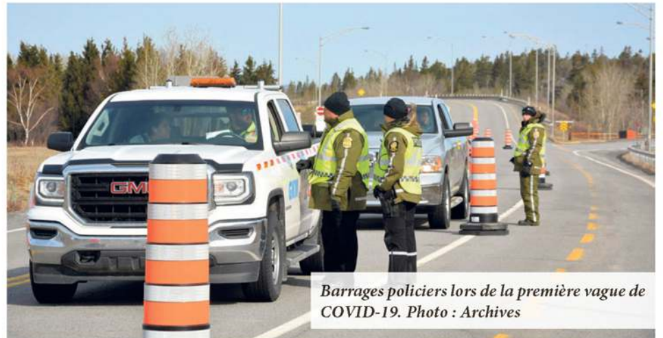
Barrages policiers lors de la première vague de COVID-19.

Au sujet des barrages routiers, il n'y en aura pas durant la relâche. « Après discussion, on s'est dit que c'était plus efficace de demander aux policiers de s'assurer que les deux principales consignes soient respectées : les couvre-feux et les bulles familiales », a dit M. Legault.