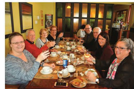
Les agents immobiliers de Royal Lepage Kamouraska-L'Islet.

sans avoir à faire appel à des commanditaires », concluait-elle.