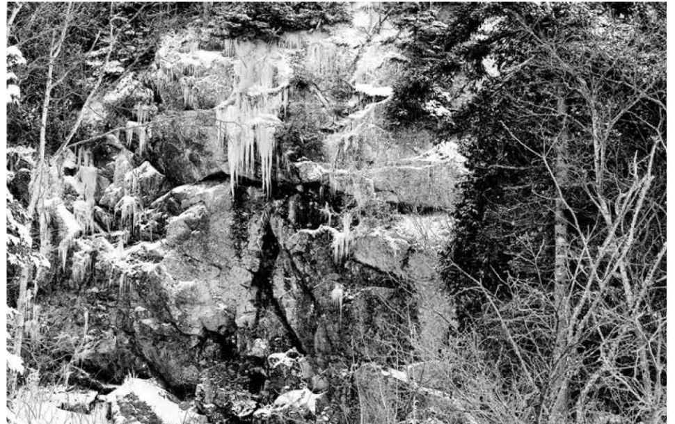
La paroi rocheuse au cœur du projet d'Elyme Gilbert.

aliser la construction du bâtiment pour 2018 et la présentation d'un premier spectacle pour l'été 2019.