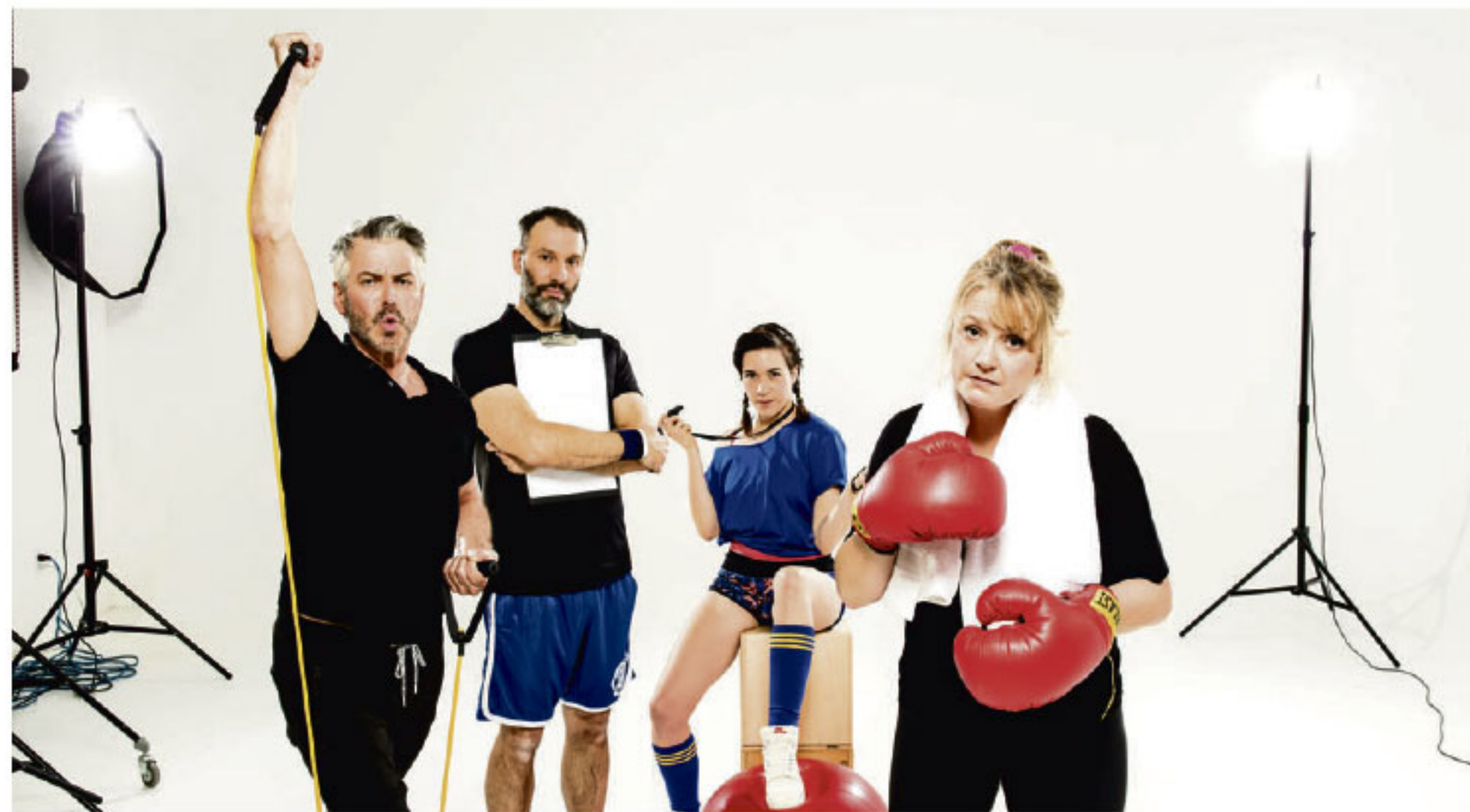
La distribution de Gym Tonic.