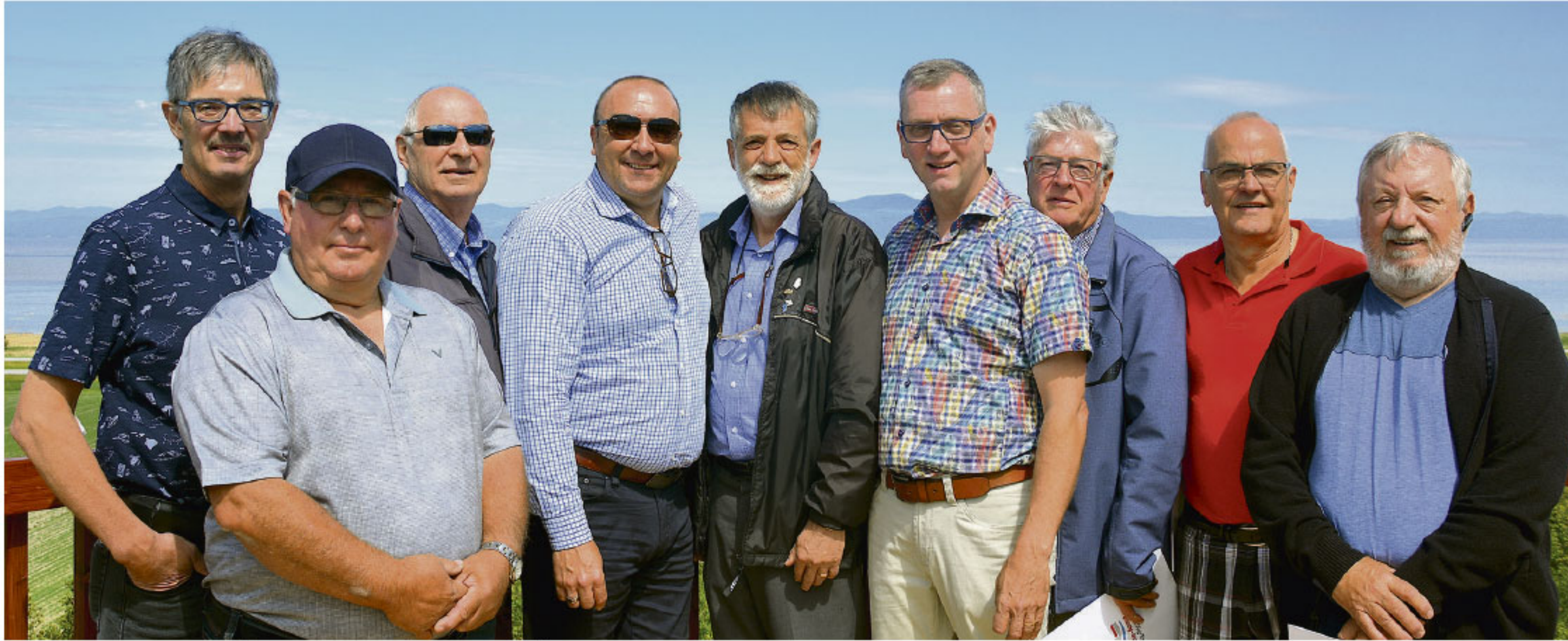
Dignitaires rassemblés au sommet de la tour d'observation.

Pas très haute à 7,6 mètres et facilement accessible, la nouvelle tour d'observation de Sainte-Anne-de-la-Pocatière est désormais ouverte à tous, et cela, tout à fait gratuitement. Au total, elle peut accueillir une vingtaine de personnes en même temps. Pour le maire de la Municipalité, M. Rosaire Ouellet, cette tour est un attrait supplémentaire sur le site de la halte routière municipale. « Il s'agit du seul site touristique public à Sainte-Anne