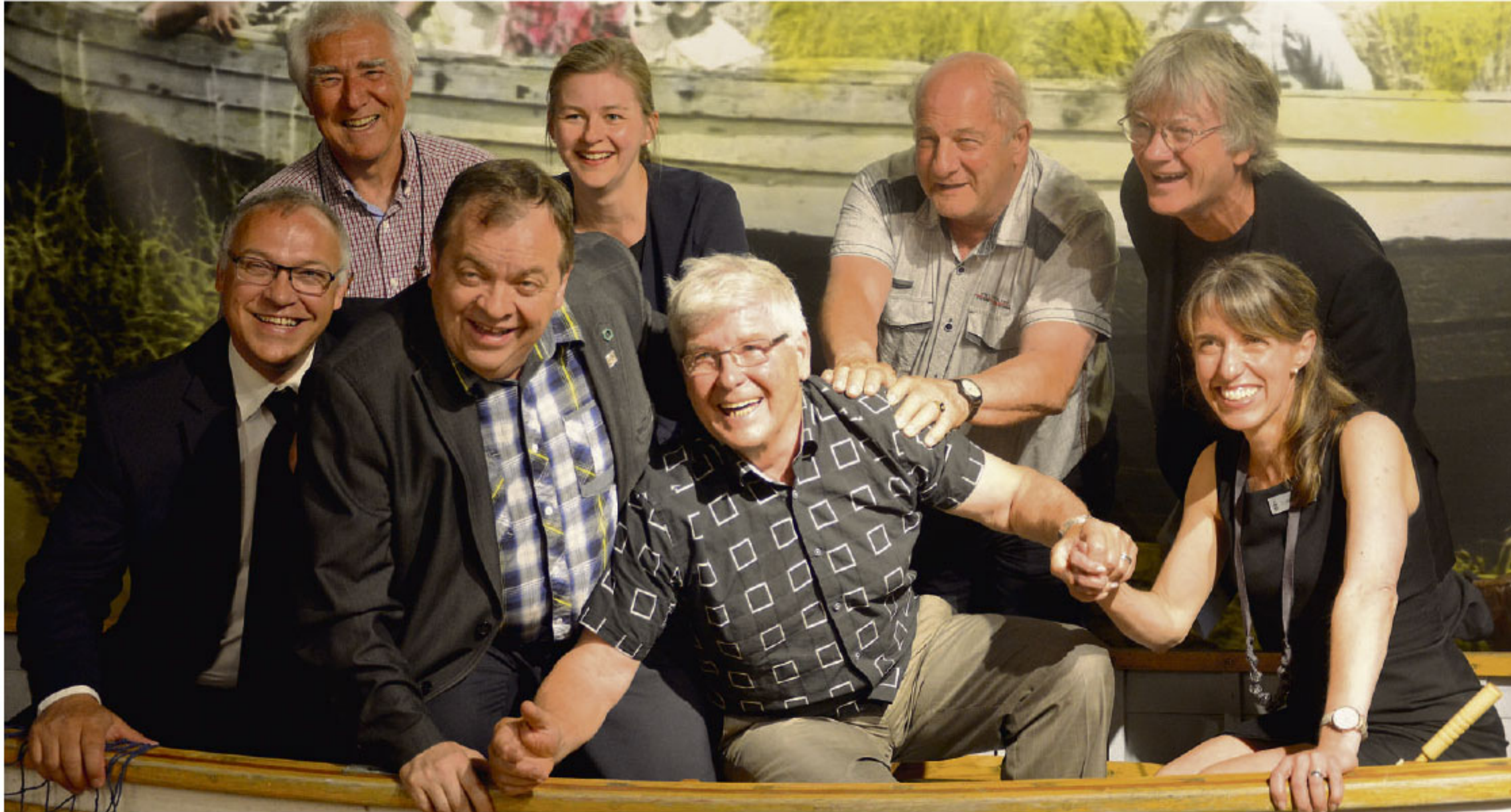
Partenaires de l'exposition et représentants du Musée maritime du Québec se sont prêtés au jeu d'une séance photo dans l'espace « selfie » de l'exposition.

Rassemblant un total de 23 embarcations et mettant en valeur plus de 80 artefacts sortant des réserves du Musée, « Le temps des chaloupes » se veut une exposition racontant l'importance du rôle des petites embarcations dans le quotidien des gens, à une époque où les moyens de transport modernes n'étaient toujours pas de ce monde.