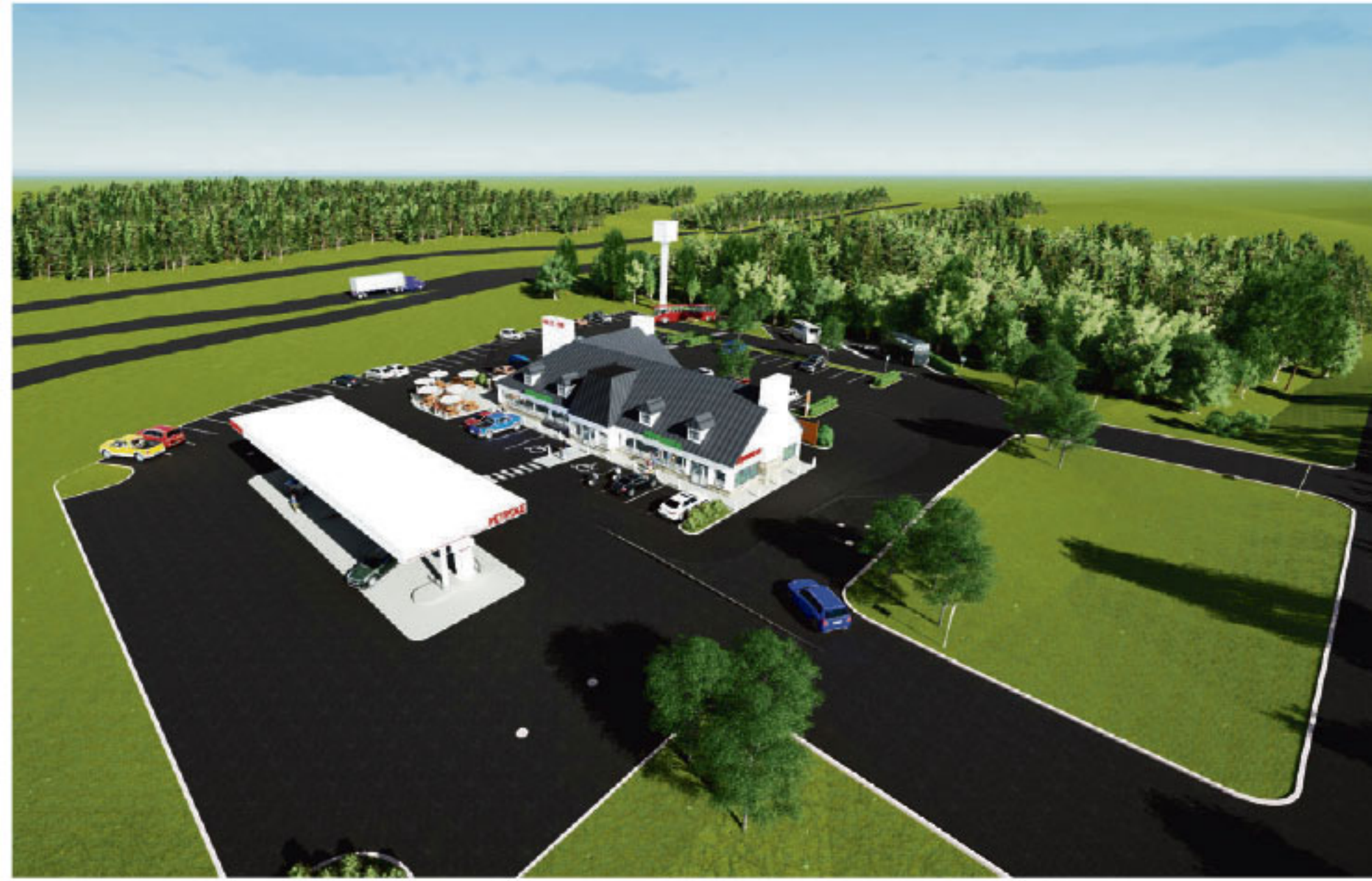
Esquisse du projet prévu à Saint-Roch-des-Aulnaies.

Celui-ci doit être doté d'une station-service, de bornes électriques de recharge, d'un dépanneur, d'un restaurant et d'aires de jeux et de détente. L'architecture du bâtiment principal doit s'harmoniser avec le patrimoine bâti de Saint-Roch-des-Aulnaies, ce à quoi M. Duperron s'est avoué très sensible. De plus, l'enseigne de 80 pieds de hauteur qui sera érigée en bordure de l'autoroute 20 doit réserver un espace d'affichage gratuit à la Seigneurie des Aulnaies.