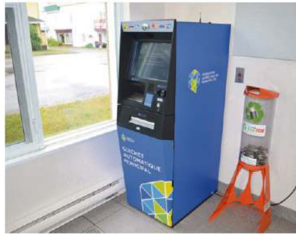
Le guichet automatique municipal de Saint-André.

Des bannières visibles de la route seront bientôt ajoutées pour rappeler aux automobilistes et piétons la présence du guichet.