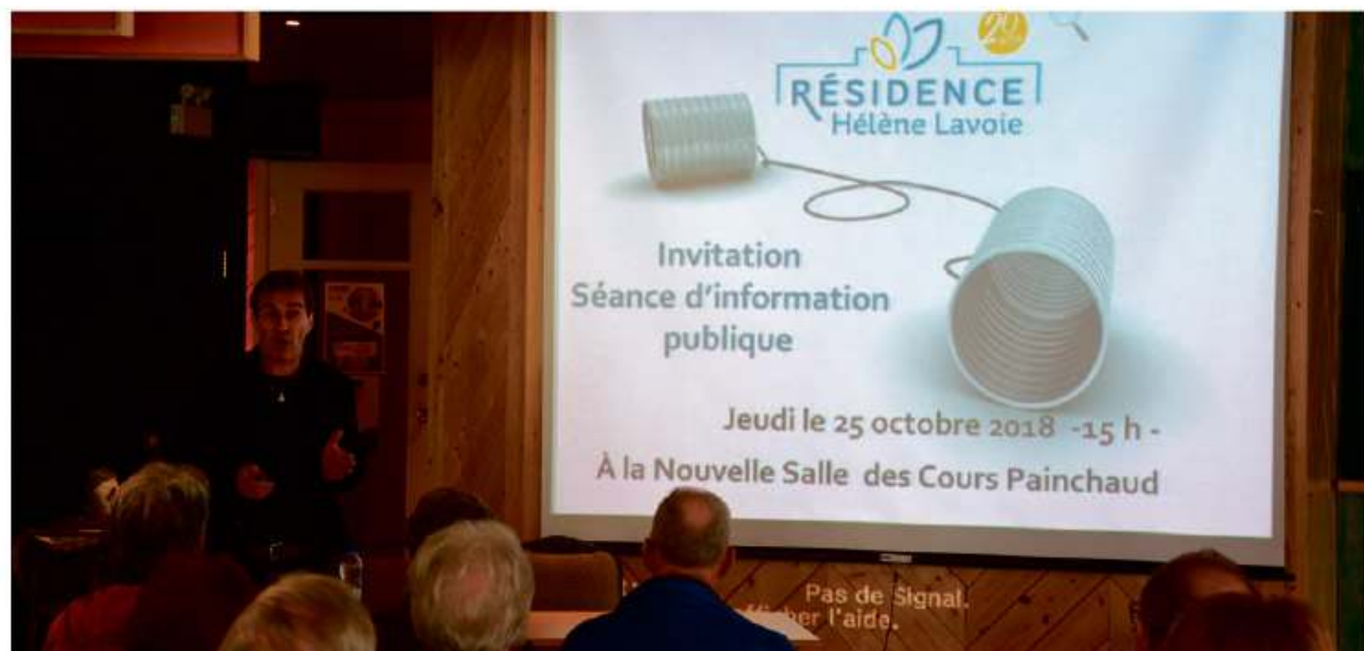
Une séance d'information sur le projet de construction d'une troisième tour d'habitation pour la Résidence Hélène Lavoie a eu lieu le 25 octobre dernier à La Nouvelle Salle de La Pocatière.

Parmi les principales préoccupations soulevées, mentionnons la crainte d'une dévaluation des résidences situées à proximité, l'opération de dynamitage du rocher nécessaire à l'érection du nouveau bâtiment et le nombre d'étages de la future tour qui risque de porter ombrage aux résidences de la rue du Plateau.