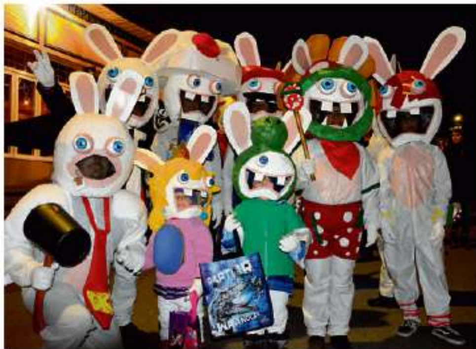
L'Halloween à La Pocatière a fait frissonner dans tous les sens du terme.

peler Louis Théberge, organisateur de l'Halloween pour une deuxième année.