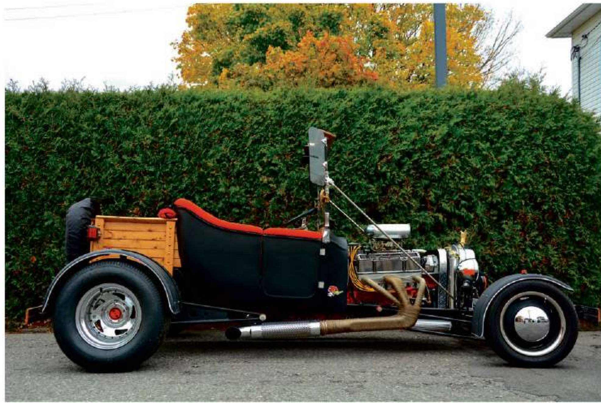
Aperçu de la voiture.