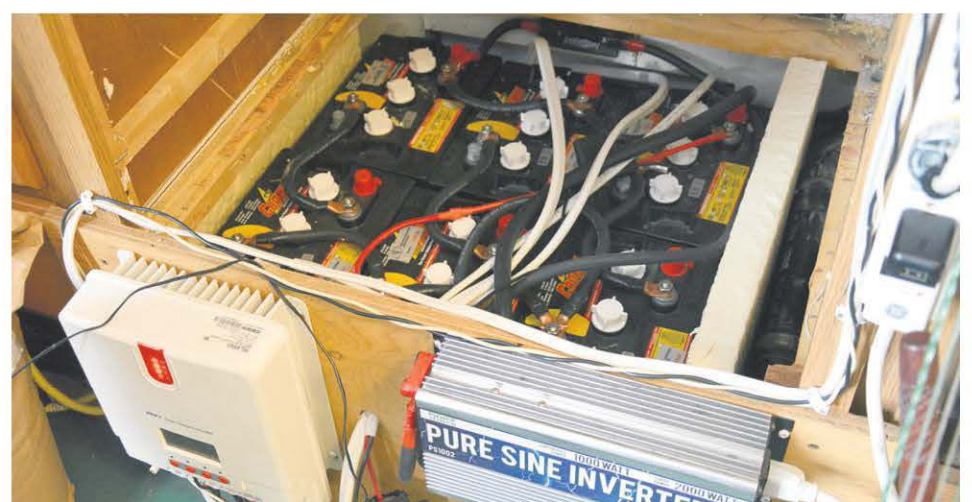
Les batteries qui servent à emmagasiner l'électricité produite par les panneaux solaires.