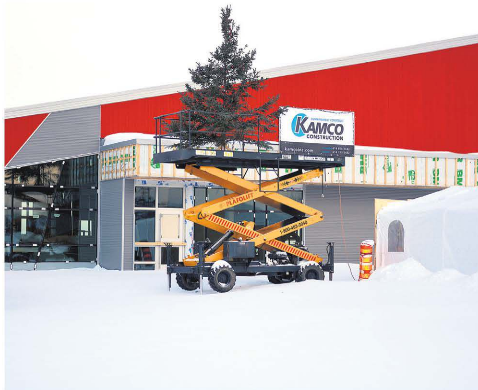
La Maison du Kamouraska actuellement en construction dans la Grande-Anse à La Pocatière.