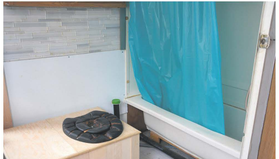
Toilette compost et douche.