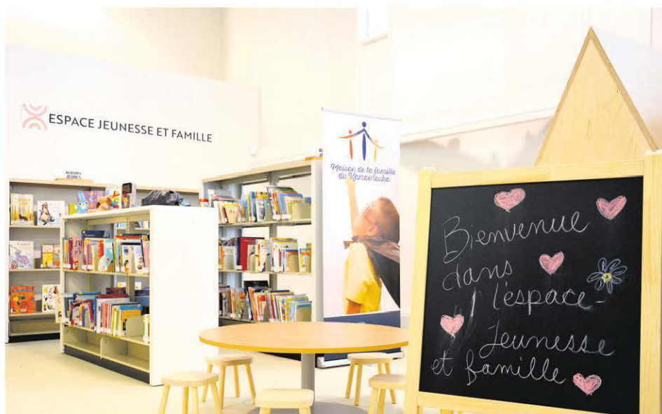
Aperçu du réaménagement.