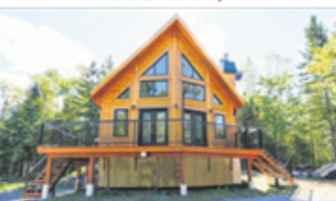
SAINT-ONÉSIME 8, route du Collège 259 900 $