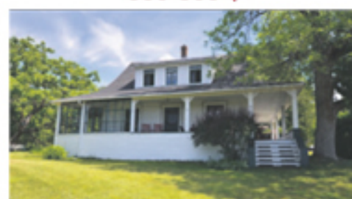
SAINT-ROCH-DES-AULNAIES 118, rue Pierre-de-St-Pierre 214 000 $