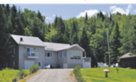
SAINT-DAMASE 745, 7 e Rang Est 31 9 000 $