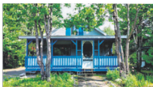
MONT-CARME 37, ch. De la Rivière-du-Loup 69 500 $