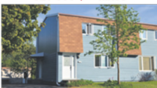
LA POCATIÈRE 403, 12 e avenue Dallaire 134 500 $