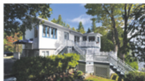
LAC-TROIS-SAUMONS 29, chemin Leclerc 525 000 $