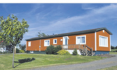
SAINT-ROCH-DES-AULNAIES 1133, rte de la Seigneurie 99 500 $