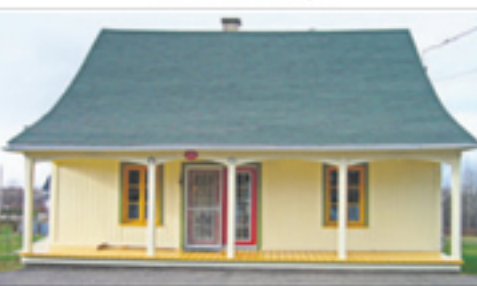
SAINT-PACÔME 175, rue Galarneau 168 700 $