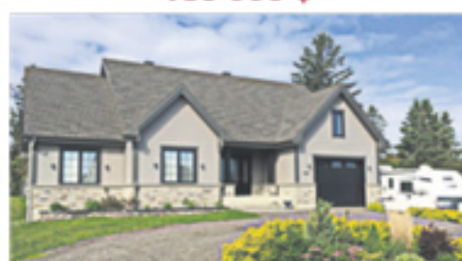
LA POCATIÈRE 1404, place du Boisé 359 500 $