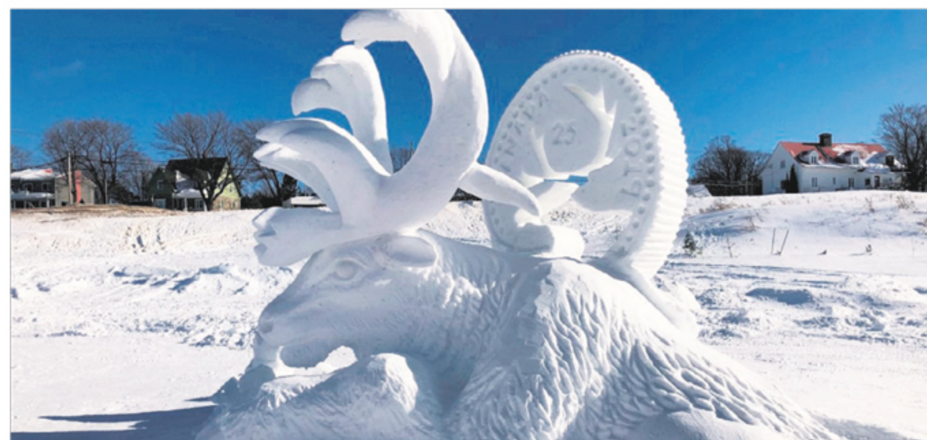
Au volet international, « Emergence » de l'équipe représentant le Canada a remporté à la fois le prix du jury et le prix du public.