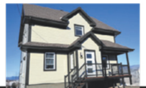
SAINT-GERMAIN 151, rang du Mississipi 268 400 $