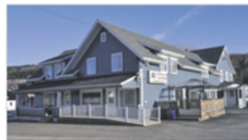
SAINT-PACÔME 188, boul. Bégin 275 000 $