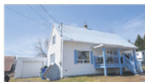
SAINT-PAMPHILE 314, Elgin Sud 59 900 $