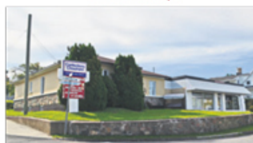
SAINT-AUBERT 2-4, Principale Ouest 259 000 $ + taxes