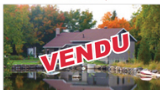
SAINT-JEAN-PORT-JOLI 584, avenue de Gaspé Est VENDU