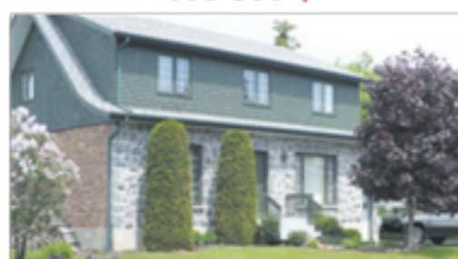
LA POCATIÈRE 404, 9 e Avenue 178 500 $