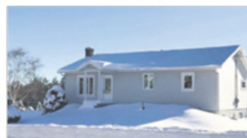
SAINTE-PERPÉTUE 15, rang Taché Est 149 000 $