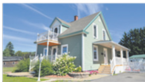
SAINT-PACÔME 278, boul. Bégin 159 500 $