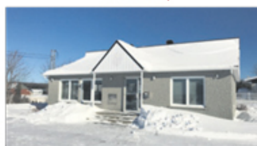
SAINT-DAMASE 15, rue de la Rivière 79 000 $