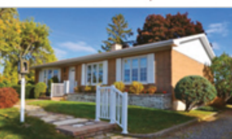
LA POCATIÈRE 807, avenue Potvin 178 500 $