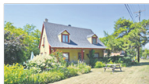
SAINT-JEAN-PORT-JOLI 56, De Gaspé Ouest 98 500 $