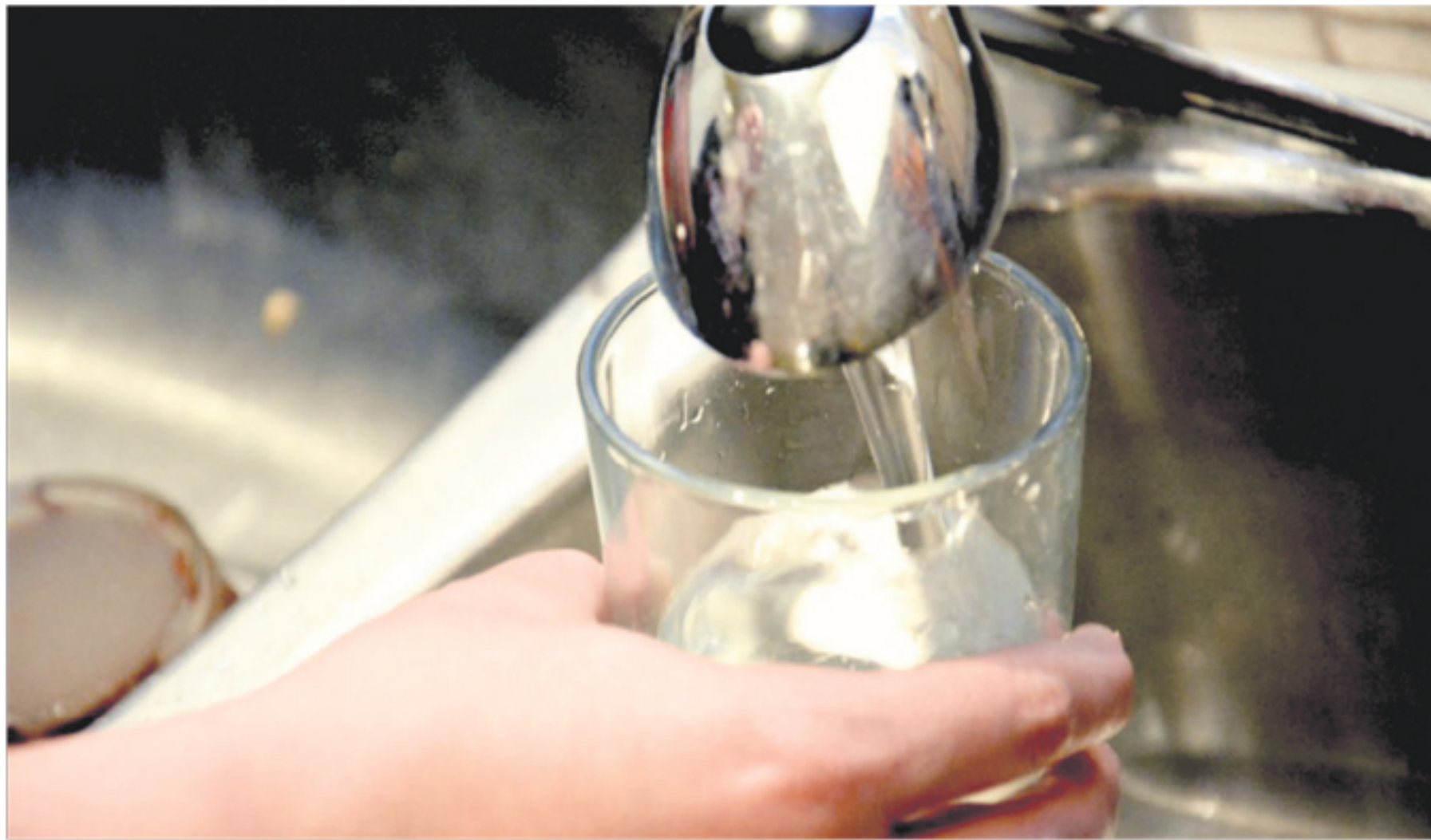
Les problèmes de pression au sein du réseau d'aqueduc de Saint-Philippe-de-Néri seront bientôt chose du passé.

Au total, cette intervention sur le réseau d'aqueduc doit coûter 250 000 $ à la Municipalité. L'ensemble des travaux doit être payé à même le surplus accumulé, de préciser le maire. « On est dans l'attente de Québec à savoir si nous aurons un retour de la taxe sur l'essence. Si jamais c'est le cas et qu'il est rétroactif au 1er janvier de cette année, on prendrait cet argent pour l'appliquer au remboursement des travaux », de conclure Frédéric Lizotte.