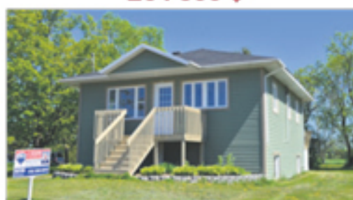
SAINT-JEAN-PORT-JOLI 252, de Gaspé Est 129 900 $