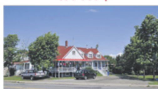
SAINT-ROCH-DES-AULNAIES 948-952, de la Seigneurie (4 log.) 264 500 $