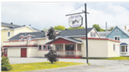
MONT-CARME 17-19, rue des Bois-Francis 99 900 $