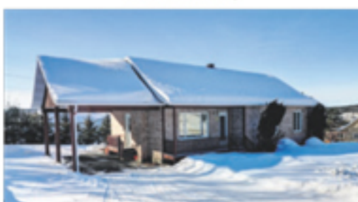
SAINT-PACÔME 21, rue Michaud 185 900 $