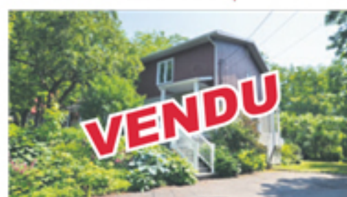
SAINTE-ANNE-DE-LA-POCATIÈRE 310, rue des Érables VENDU