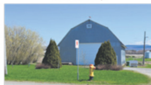
SAINT-JEAN-PORT-JOLI de Gaspé Est (terrain) 84 900 $