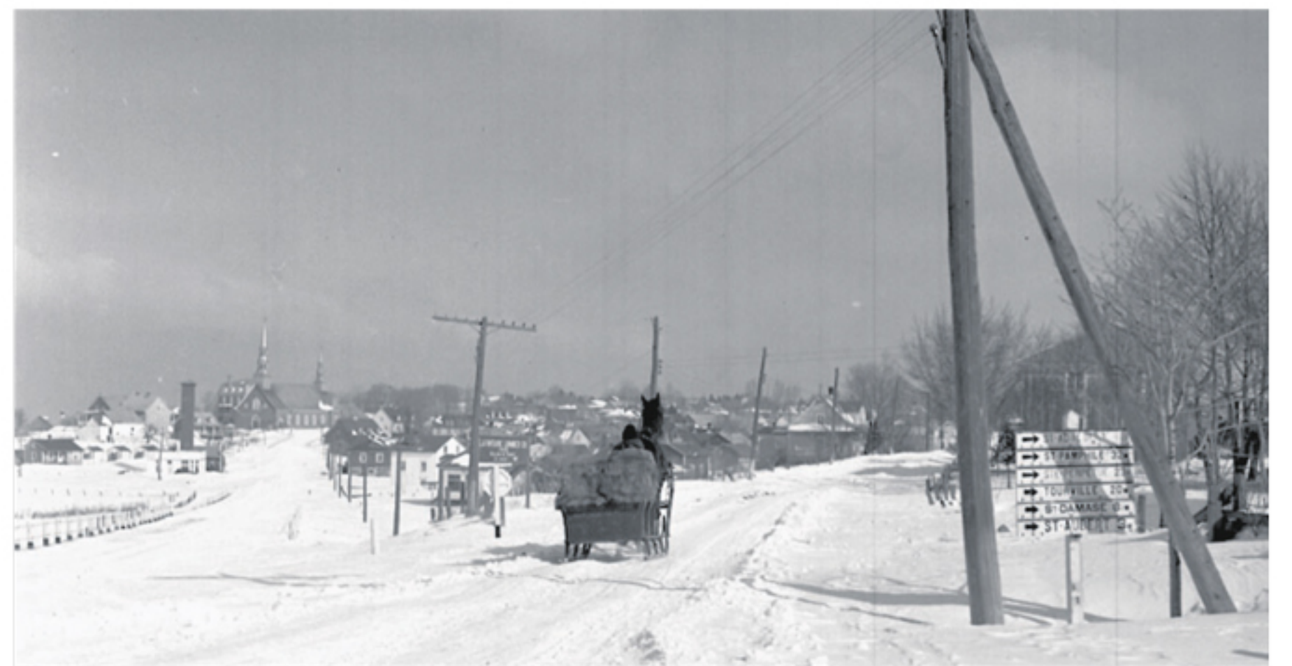
Saint-Jean-Port-Joli dans les années 1940.