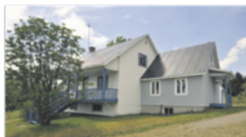
SAINTE-PERPÉTUE 425, rang Taché Est 89 000 $