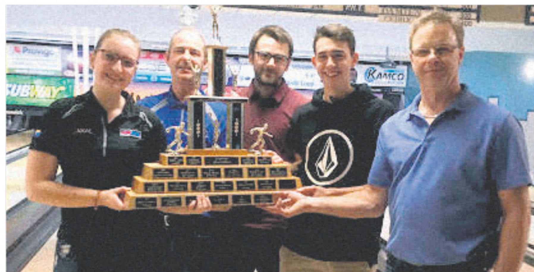
La Tabagie Lunik a remporté le trophée de la 24 e Classique des entreprises.