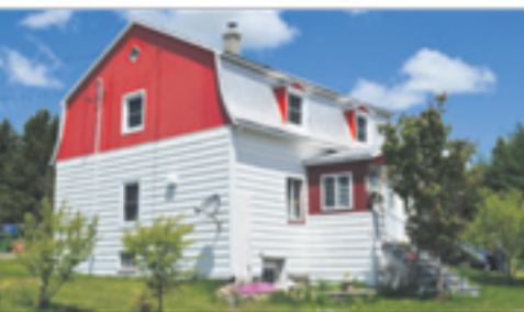
SAINTE-PERPÉTUE 491, Principale Sud 59 900 $