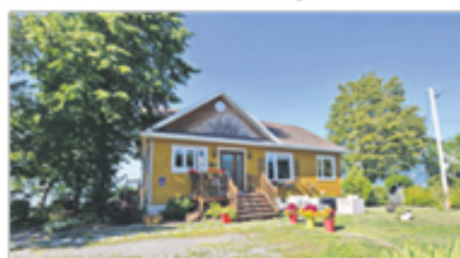
SAINT-ROCH-DES-AULNAIES 10, rue du Joli-Vent 438 900 $