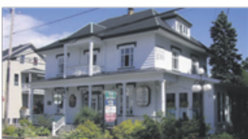
LA POCATIÈRE 421, 4 e Avenue 329 000 $ + taxes