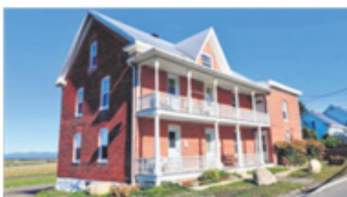
SAINT-PHILIPPE-DE-NÉRI 160, route 230 Ouest (4 logements) 209 500 $