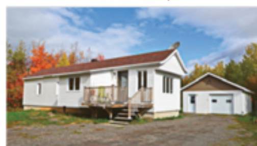
SAINT-AUBERT 5, route Bélanger 123 700 $