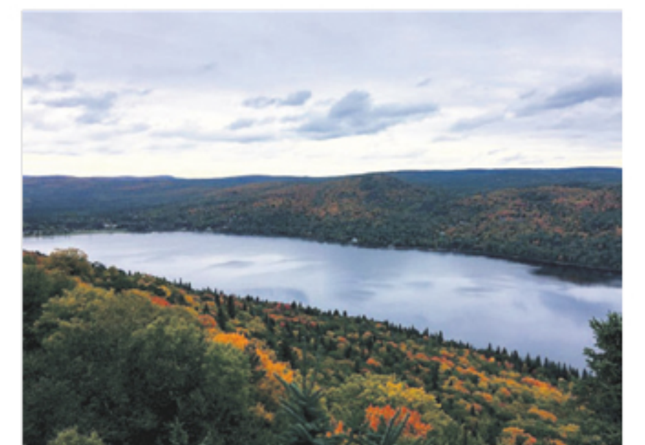
Le lac de l'Est à Mont-Carmel.

Néanmoins, bien avant l'asphaltage de la 287, le maire de Mont-Carmel estime qu'il y a d'autres priorités plus urgentes pour le développement futur du lac de l'Est. L'accès à la téléphonie cellulaire et à internet haute vitesse figure en tête de liste, selon lui. Il promet d'ailleurs d'en faire un point à l'ordre du jour lors d'une éventuelle rencontre avec la députée-ministre Marie-Eve Proulx.