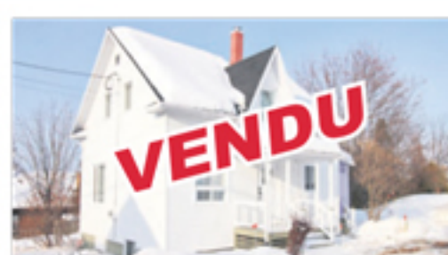
MONT-CARME 31, rue des Bois-Francis VENDU