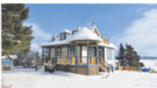
KAMOURASKA 46, route du Cap Taché 319 000 $

Thérèse Rioux courtier immobilier Gilles Couture courtier immobilier agréé René Bélanger courtier immobilier