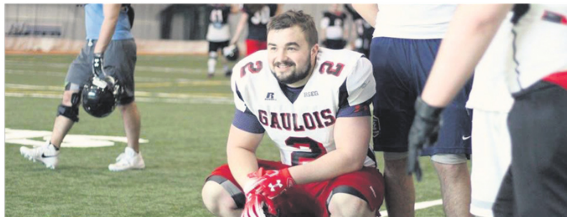
L'équipe de football collégial les Gaulois de l'ITA campus de La Pocatière et du Cégep de La Pocatière connaît actuellement sa meilleure année en matière de recrutement de nouveaux joueurs.

L'équipe de football collégial les Gaulois de l'ITA campus de La Pocatière et du Cégep de La Pocatière connaît actuellement sa meilleure année en matière de recrutement de nouveaux joueurs. Ces bons résultats surviennent après que l'équipe ait connu une de ses meilleures saisons l'automne dernier, en plus d'avoir signé une nouvelle entente de partenariat qui lui donne accès à de nouveaux joueurs français.