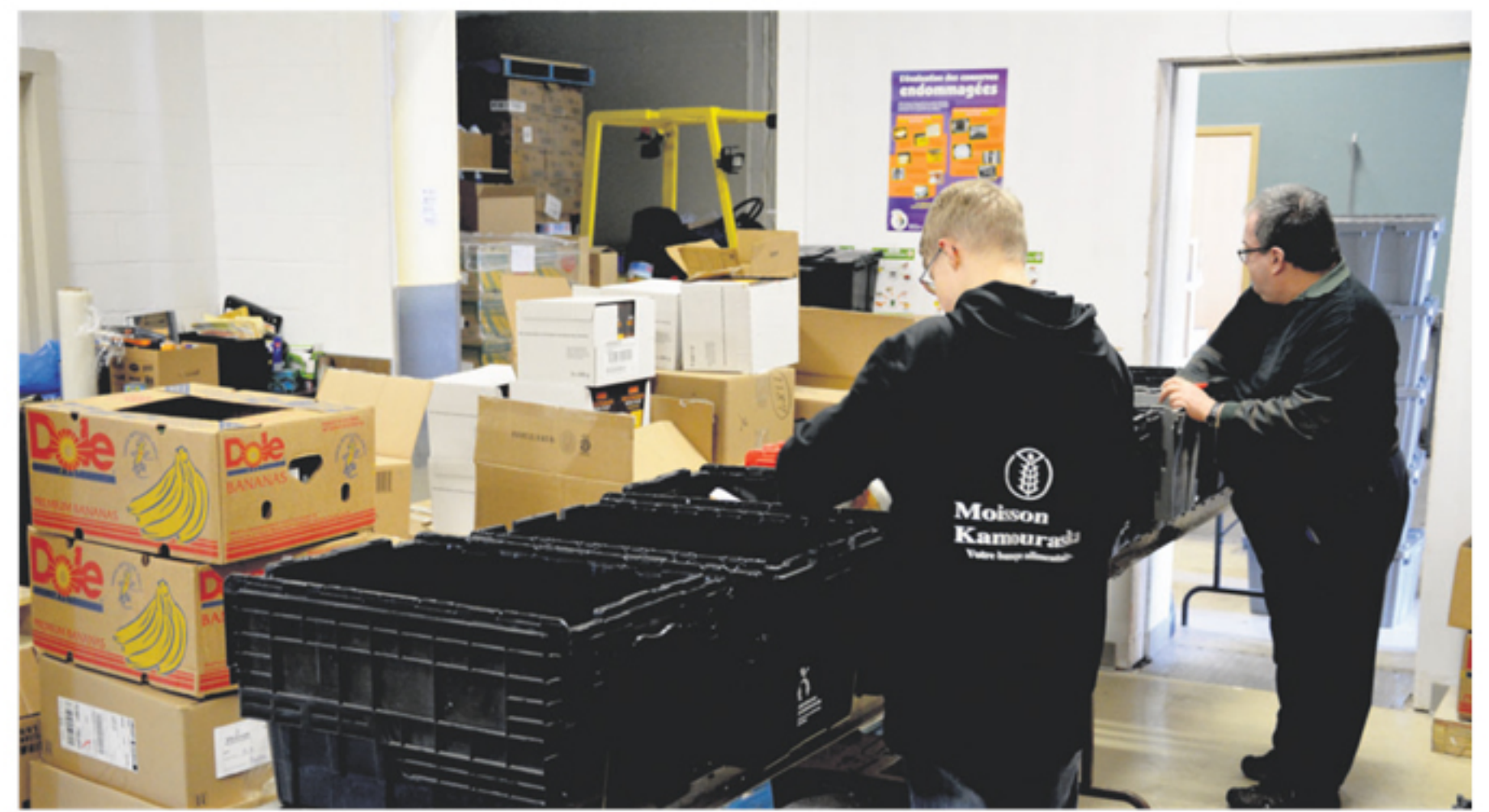
Moisson Kamouraska a connu une augmentation de 51 % de ses demandes d'aide alimentaire d'urgence.