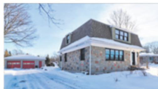
SAINT-ROCH-DES-AULNAIES 783, route de la Seigneurie 229 500 $