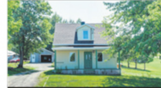
SAINT-ONÉSIME 61, chemin du Village 79 500 $