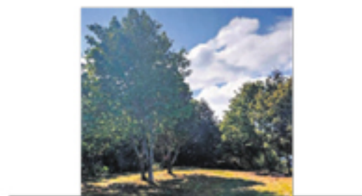
MONT-CARMEL rue du Centenaire 14 800 $