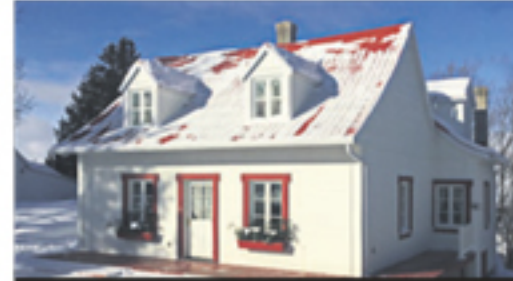
SAINT-JEAN-PORT-JOLI 380, de Gaspé Ouest 248 000 $