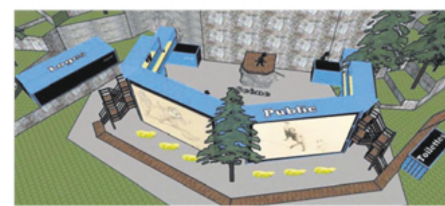
Ébauche de l'amphithéâtre. 5 : Les conteneurs ont déjà été installés sur la route 132 à Saint-Germain.

Elyme Gilbert ajoutait que les informations entourant l'ouverture officielle du Cirque de la Pointe-Sèche doivent être connues pour la mi-mars.