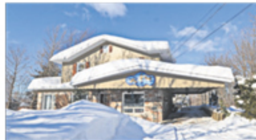
SAINT-JEAN-PORT-JOLI 226, de Gaspé Ouest 279 800 $