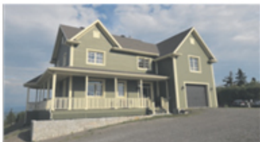
KAMOURASKA 369, rang du Cap 388 000 $