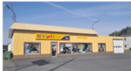
SAINT-JEAN-PORT-JOLI 518, de l'Église 249 500 $ + taxes