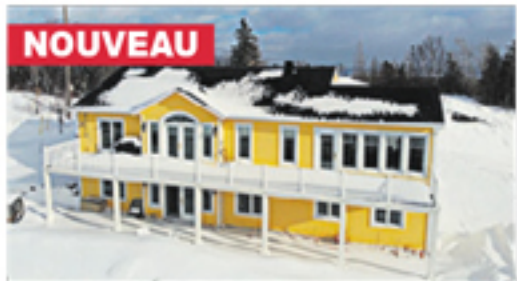
SAINT-DENIS-DE LA BOUTEILLERIE 201, ch. du Domaine-de-Nos-Étés 449 000 $