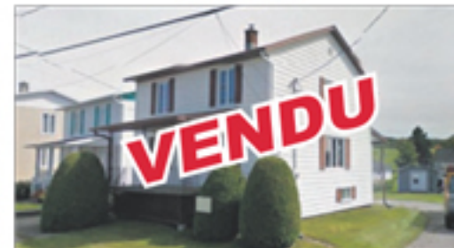
SAINT-CYRILLE-DE-LESSARD 18, Lessard Est