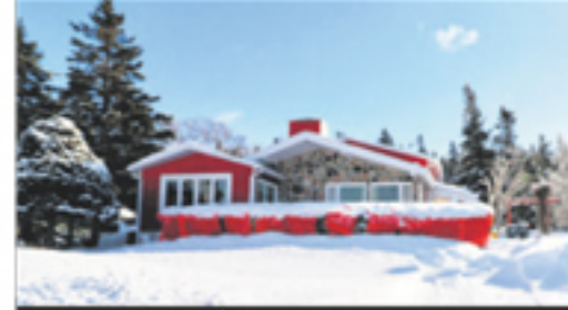
RIVIÈRE-OUELLE 190, de la Grève Ouest 359 500 $