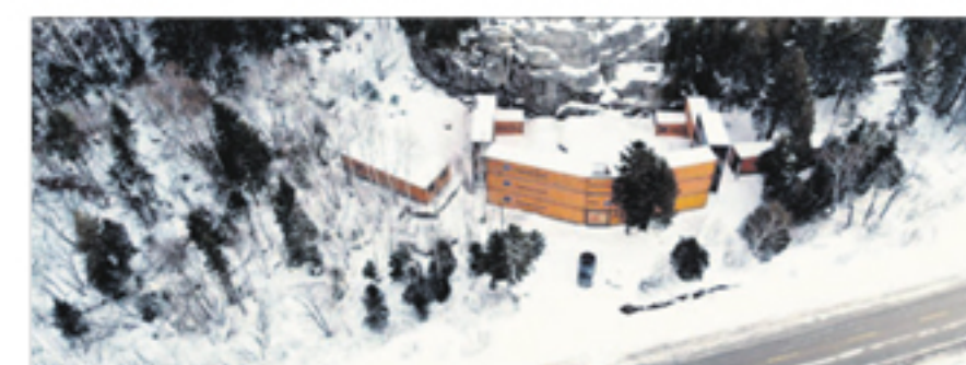
Vue aérienne du site.