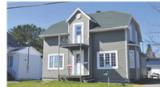
TOURVILLE 987, Principale 69 000 $