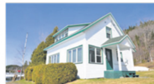
LAC TROIS-SAUMONS 504, ch. Tour du Lac 296 500 $