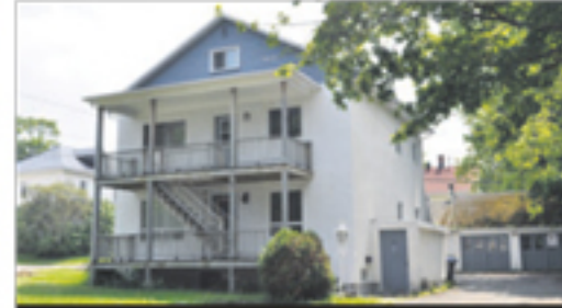
LA POCATIÈRE 207, 2 e avenue de la Falaise 210 000 $