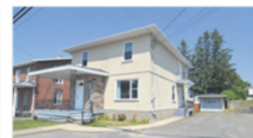
L'ISLET 291, boul. Nilus-Leclerc 158 000 $