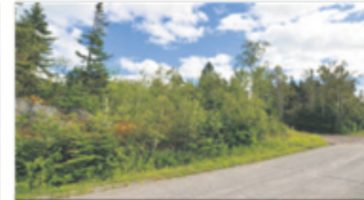
RIVIÈRE-OUELLE Chemin de la 5e Grève Ouest (terrain) 114 500 $