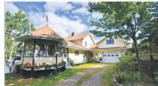
SAINT-DENIS-DE LA BOUTEILLERIE 170, de la Grève Est 598 500 $