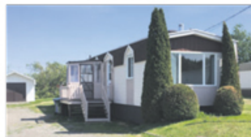
SAINT-PAMPHILE 67, rue du Parc 57 000 $