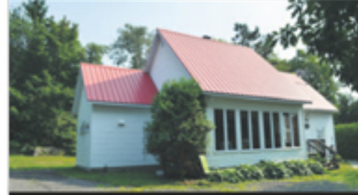
SAINT-ROCH-DES-AULNAIES 44, ch. Des Anses 189 000 $