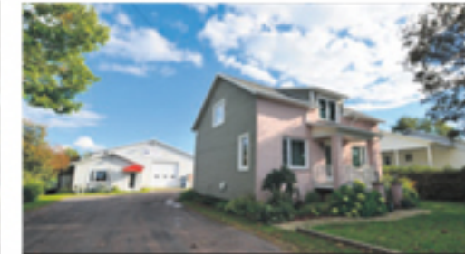
SAINT-JEAN-PORT-JOLI 186, de Gaspé Est 265 000 $