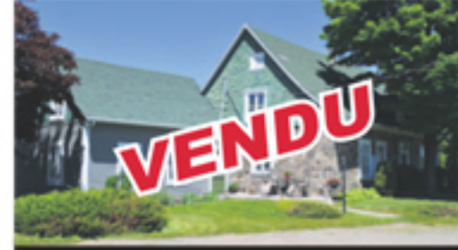
SAINT-ROCH-DES-AULNAIES 245, de la Seigneurie