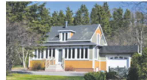
SAINT-DENIS-DE LA BOUTEILLERIE 1, de la Grève Ouest 249 900 $