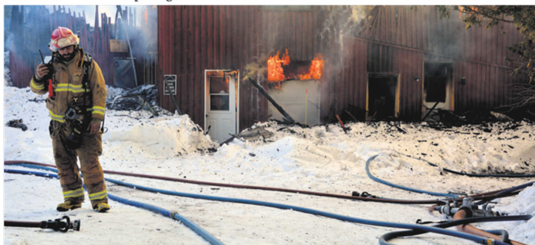
L'entreprise Labo Solidago de Sainte-Louise a été complètement ravagée par les flammes.

Tout article d'usage domestique quotidien sera fort apprécié (vaisselle, draps, jouets, etc.). La petite famille a déjà reçu beaucoup de vêtements et en ont suffisamment pour les mois qui viennent. Au moment de mettre sous presse environ 3000 $ avait été amassés sur une page Gofundme. (Avec la collaboration de Stéphanie Gendron)