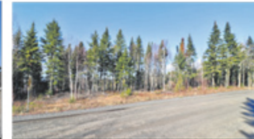
SAINT-DENIS-DE LA BOUTEILLERIE 1, rue Raymond (terrain) 149 500 $

Vous trouverez plus de 100 propriétés à voir sur gillescouture.com