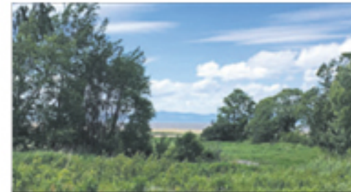
SAINT-ROCH-DES-AULNAIES Route de la Seigneurie 79 000 $