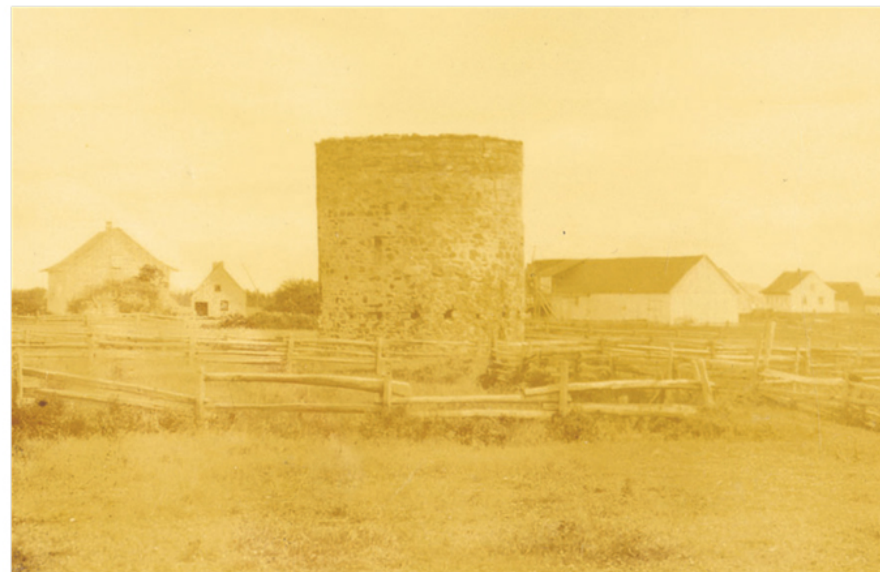
Le moulin de Saint-Denis avant sa démolition en 1919.

Pour informations ou inscription : Estelle Paradis au 418 856-3371