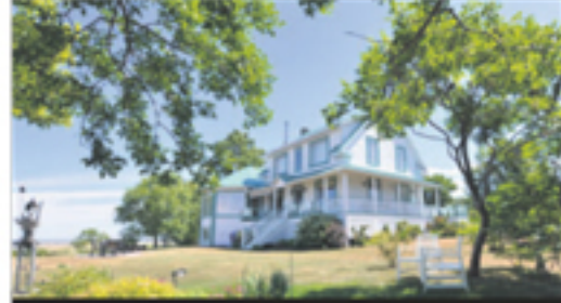
SAINT-ROCH-DES-AULNAIES 171, rue Pelletier 395 000 $