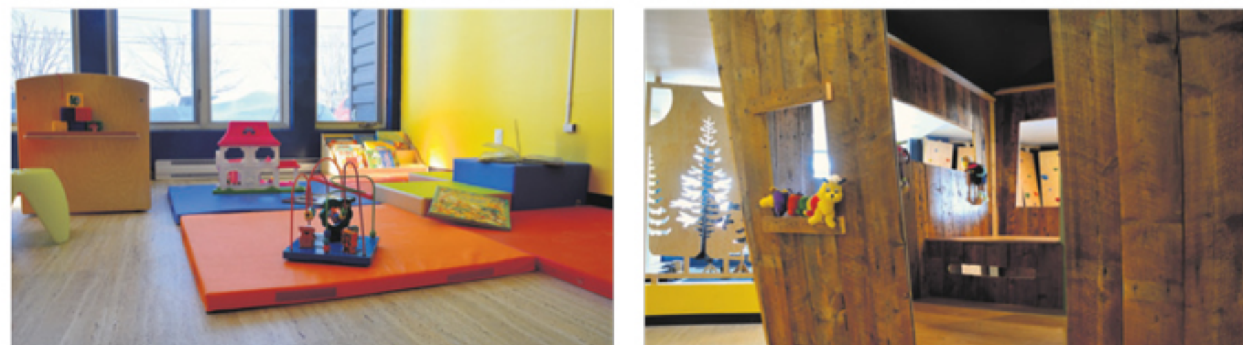
Aperçu de la salle de jeux Le Chat perché.