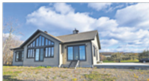
L'ISLET 33, Lamartine Est 297 500 $