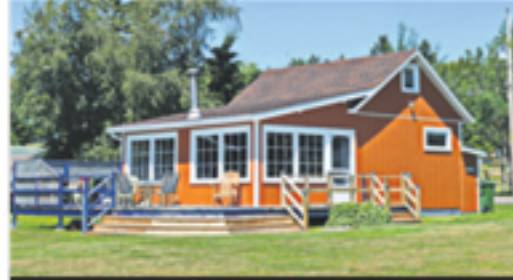
RIVIÈRE-OUELLE 217, ch. de la Cinquième Grève Ouest 165 000 $