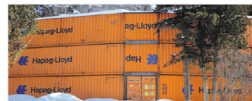
Les conteneurs ont déjà été installés sur la route 132 à Saint-Germain.