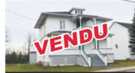
SAINTE-LOUISE 667, rue Principale