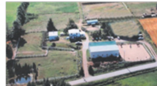
SAINT-AUBERT 164, 3 e Rang Ouest 395 000 $ + taxes