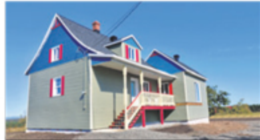
MONT-CARMEL 277, des Bois-Francis 149 900 $