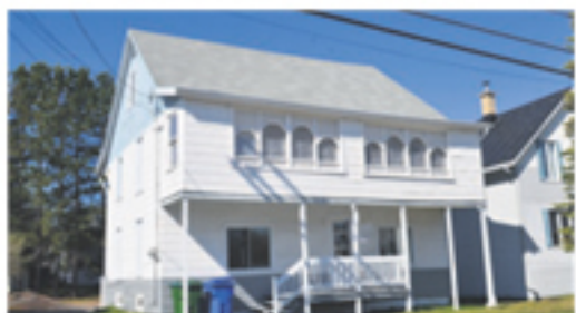
TOURVILLE 993-995, Principale (2 log.) 69 000 $