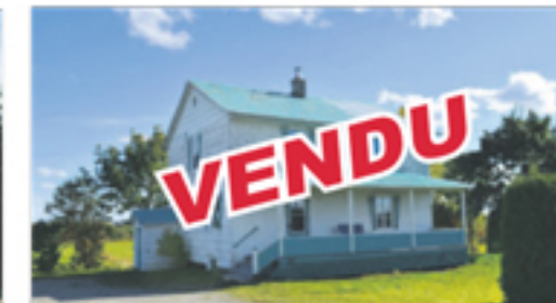
SAINT-MARCEL 291, Taché Ouest