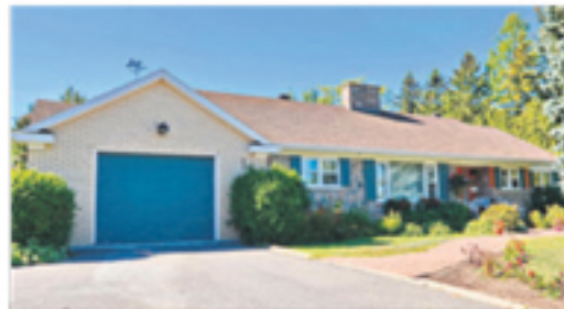
SAINT-PASCAL 350, rue Blondeau 249 000 $