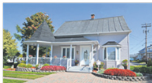
SAINT-PAMPHILE 31, Maranda 98 000 $