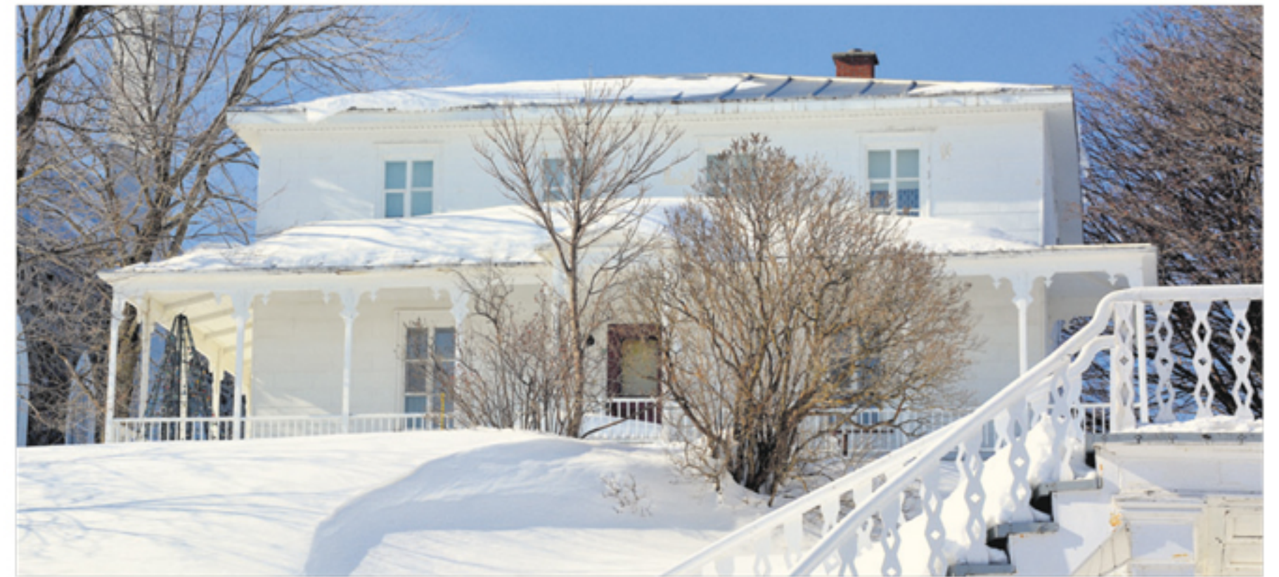
Le presbytère de Saint-Denis serait en voie d'être converti en gîte.

Dans le meilleur des scénarios, la Corporation aimerait ouvrir le gîte au courant de l'été 2019.