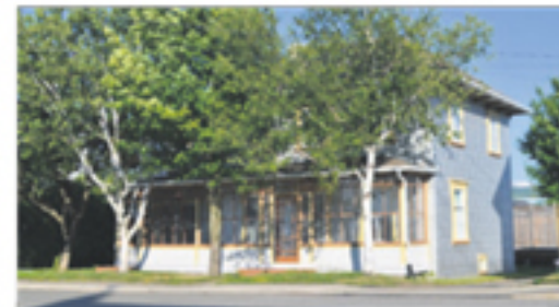
SAINT-AUBERT 38, Principale Ouest 171 000 $