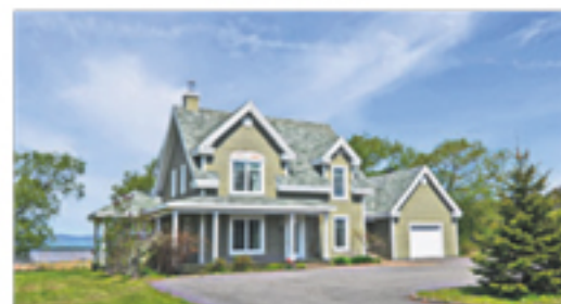
L'ISLET 137, des Pionniers Ouest 495 000 $