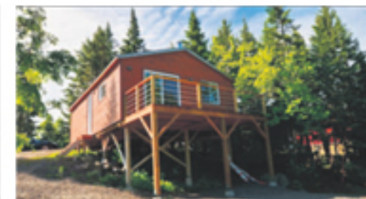
SAINT-CYRILLE-DE-LESSARD 179, Lac-Bringé (chalet 4 saisons) 134 500 $