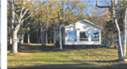
RIVIÈRE-OUELLE 160, 5e Grève Ouest 179 400 $