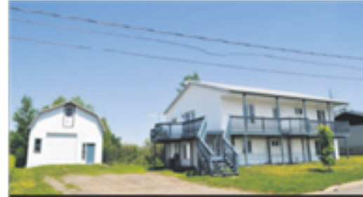
SAINTE-LOUISE 150-152, rue des Quatre-Vents 112 000 $