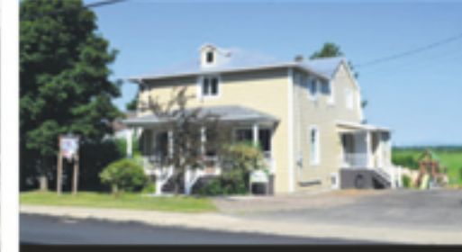
SAINTE-LOUISE 517, Principale 139 000 $