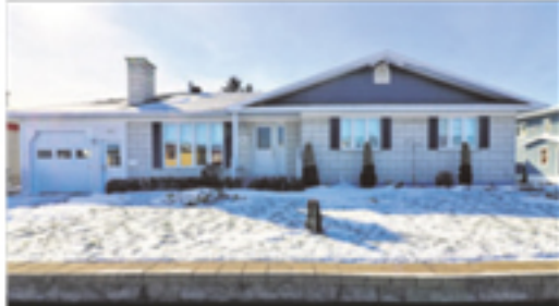
LA POCATIÈRE 1001-1001A, 7 e Rue Sirois 224 500 $