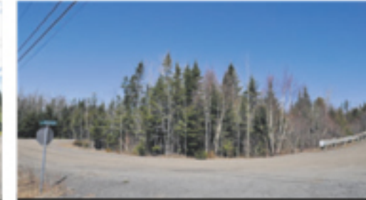
RIVIÈRE-OUELLE 113, ch. Maurice-Proulx (terrain) 24 500 $