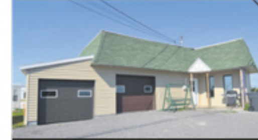
RIVIÈRE-OUELLE 100, route 132 69 500 $