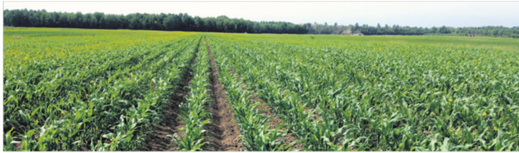
Dumaïs d'ensilage dans la région du Centre-du-Québec.

Pour s'inscrire à l'atelier du 27 février, contacter Mélodie Beaulieu au 418 863-3532.