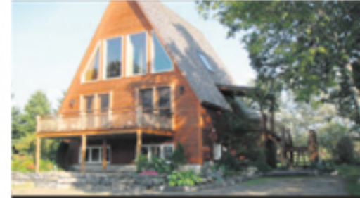
SAINT-JEAN-PORT-JOLI 803, avenue de Gaspé 298 000 $