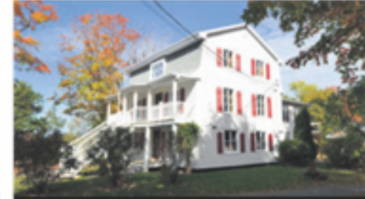
SAINT-JEAN-PORT-JOLI 895, de l'Église 298 500 $