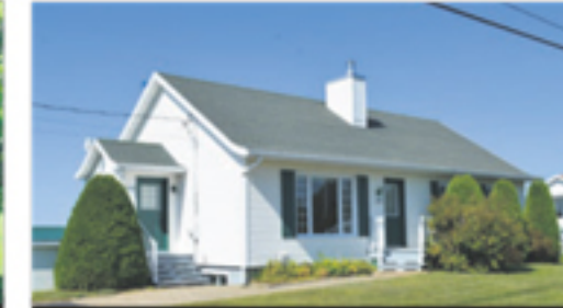
SAINT-ROCH-DES-AULNAIES 194, de la Seigneurie 174 000 $