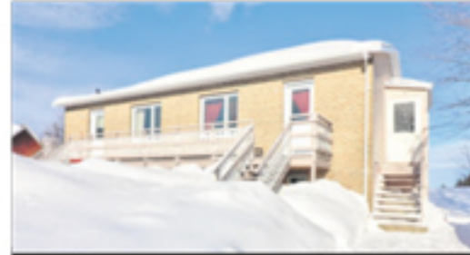
LA POCATIÈRE 644-646, rue du Verger 185 900 $