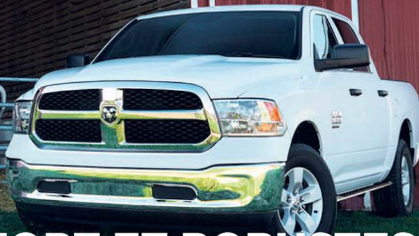
2020 RAM 1500 Trademans illustré