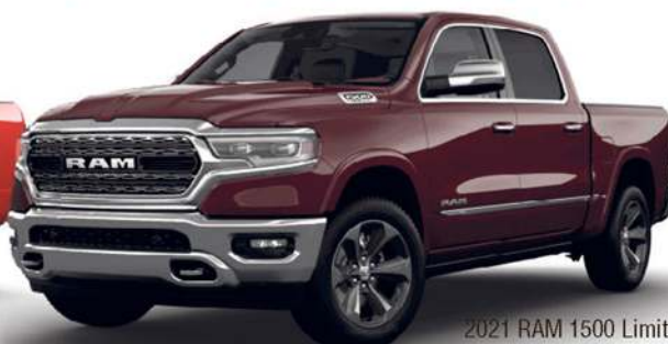
2021 RAM 1500 Limited illustré