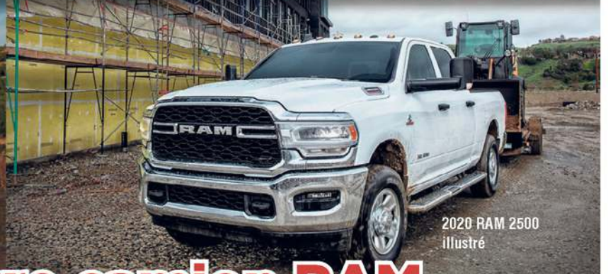
2020 RAM 2500 illustré