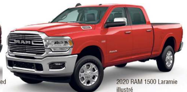
2020 RAM 1500 Laramie illustré