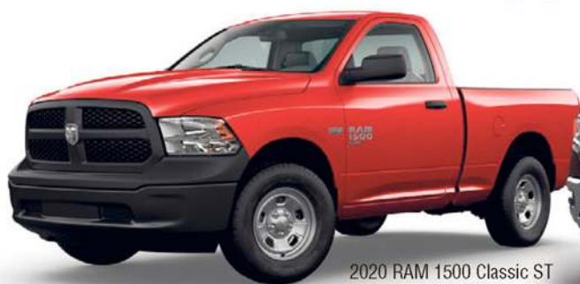
2020 RAM 1500 Classic ST illustré