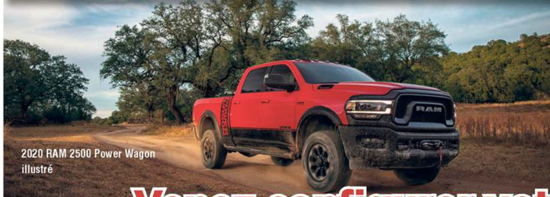
2020 RAM 2500 Power Wagon illustré