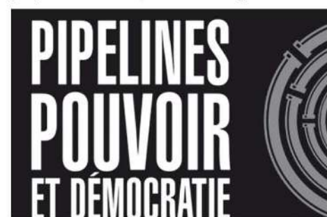
Le film présenté par l'Office national du film pourra être vu à La Pocatière.