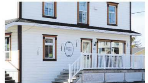
La résidence Sainte-Hélène.

Le CISSS du Bas-Saint-Laurent a fait parvenir un préavis de révocation de permis à la propriétaire de la Résidence Sainte-Hélène. Cette décision faite suite aux allégations de voie de fait qui ont été déposées. Les résidents sont toujours relocalisés depuis le 25 février, soit depuis un incendie survenu à cet endroit. Les trois personnes arrêtées pour voie de fait comparaitront en justice le 16 mai.