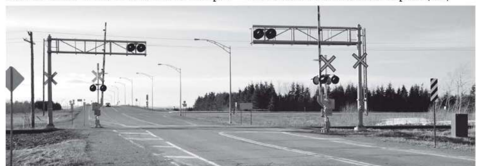
Le passage à niveau de Saint-Pacôme.

gramme de sécurité des passages à niveau. Le calcul avait été effectué grâce à un système de modélisation informatique qui se nomme GradeX. « Le système s'attarde uniquement aux risques d'accident entre les trains, les piétons et les véhicules. Il sert de données, entre autres, sur le nombre d'accidents, la conception des passages, la visibilité et la circulation routière et ferroviaire pour évaluer les risques de collision avec les véhicules et les piétons », peut-on lire dans l'article. Transport Canada a précisé au média national que des améliorations avaient été effectuées depuis. (S.G)