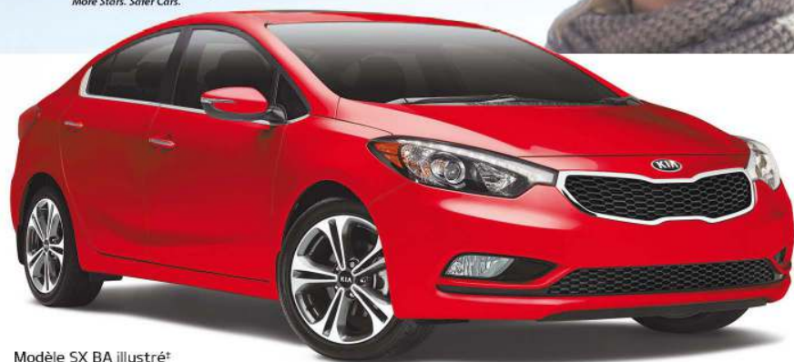
Modèle SX BA illustré*

Voyez l'histoire complète sur kia.ca/maryna