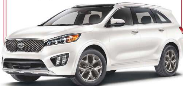
Modèle SX Turbo TI illustré*

-Somvang P., Boisbriand, Vraie propriétaire Kia.