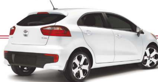
Modèle SX BA avec Navigateur illustré*