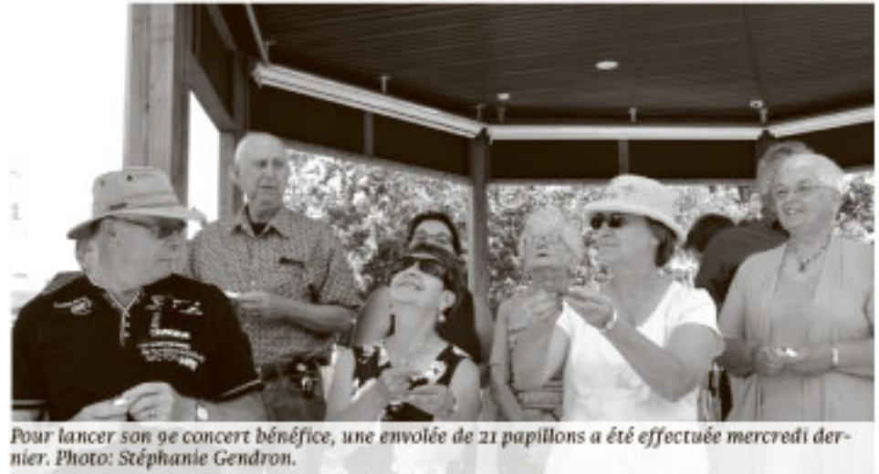
Pour lancer son 9 e concert-bénéfice, une envolée de 21 papillons a été effectuée mercredi dernier.