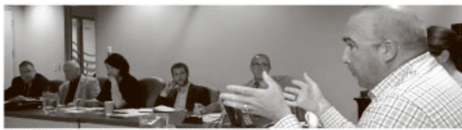
Le député Bernard Généreux s'adresse aux intervenants.

Le jeudi 8 septembre dernier, les représentants des cinq des grands fournisseurs de services cellulaires au Québec, des députés provinciaux et des quatre MRC de la circonscription ont participé à une rencontre organisée par député fédéral de Montmagny—L'Islet—Kamouraska—Rivière-du-Loup, Bernard Généreux. Le but : en venir à une solution pour une couverture cellulaire adéquate dans le comté.