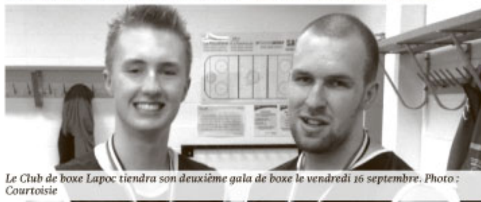
Le Club de boxe Lapoc tiendra son deuxième gala de boxe le vendredi 16 septembre.

Pour ce deuxième gala, Stéphane Gosselin s'attend à accueillir entre 400 et 500 personnes. Déjà, toutes ses tables VIP ont été vendues. Les gens qui veulent se procurer des billets réguliers ou VIP peuvent contacter le Club de boxe Lapoc au 418 551-5091.