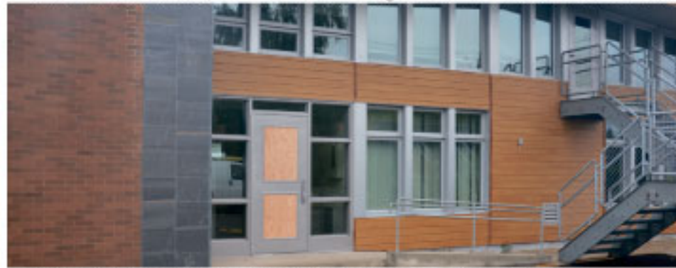
Les portes extérieures en verre trempé ont été fracturées.

Selon nos informations, un témoin des dommages causés à l'immeuble aurait contacté