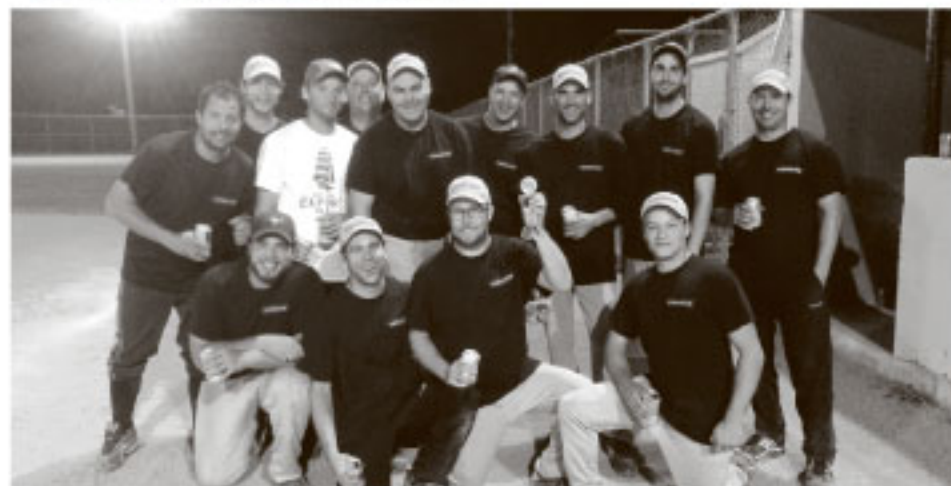
La Compagnie Normand de Saint-Pascal : équipe gagnante de la saison 2016 dans la Ligue de balle donnée du Kamouraska.

Toute formation désirant réserver sa place est invitée à le faire avant le 1er octobre via la page Facebook : www.facebook.com/liguede-balledukouraska .