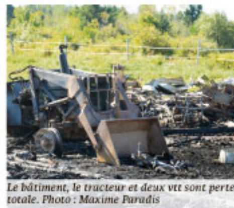
Le bâtiment, le tracteur et deux vtt sont perte totale.

Un bâtiment qui se trouvait à proximité a été épargné grâce à la vigilance des pompiers. Seules les fenêtres ont éclaté, en raison de la chaleur dégagée par le feu. Christian Gagnon évalue les dommages autour de 100 000 $. L'incendie serait de nature électrique. (M.P.)