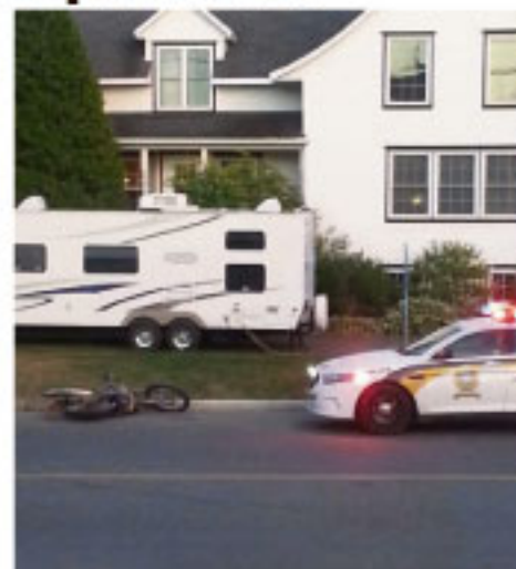
Un jeune motocycliste a été hospitalisé après avoir été poursuivi par des policiers de la Sûreté du Québec à Saint-Pascal.

La Sûreté du Québec avait été avisée d'un motocycliste au comportement inadéquat dans les rues de Saint-Pascal. Une fois qu'il fut localisé, les policiers sont entrés en contact avec lui verbalement, mais ce dernier a préféré quitter. Au moment où les policiers tentaient de l'intercepter, il a été éjecté de sa moto après en avoir perdu le contrôle. C'est à ce moment que l'engin a percuté le véhicule des policiers. « Le jeune homme n'a pas été blessé gravement et il a été conduit au centre hospitalier par la suite. Il pourrait éventuellement faire face à des accusations de fuite et conduite dangereuse », d'indiquer Ann Mathieu de la Sûreté du Québec. (M.P.)