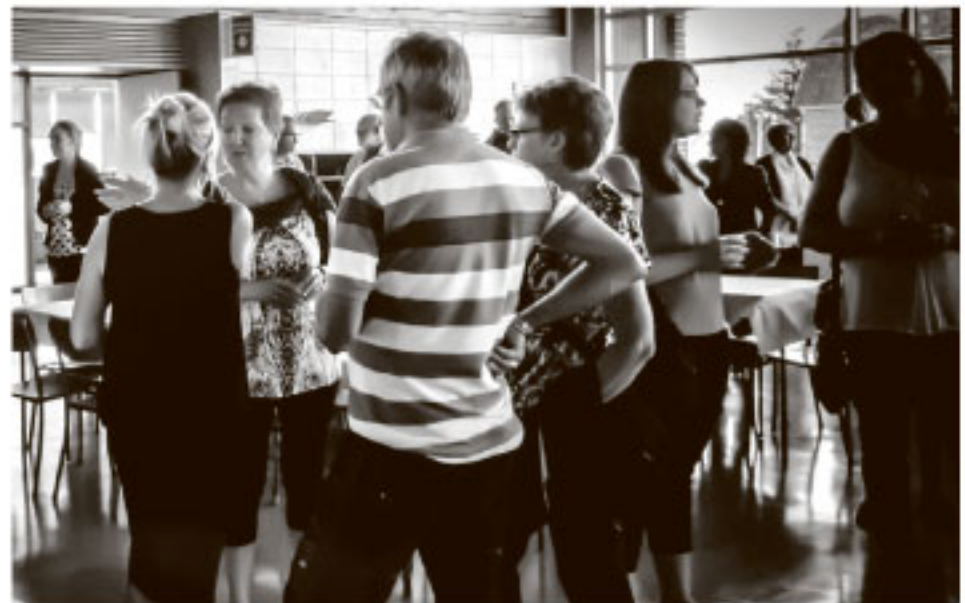
Participants au 5 à 7