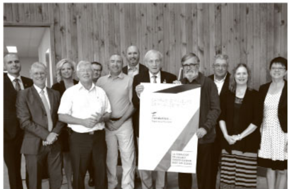
Plusieurs personnalités du milieu ont participé au lancement de la campagne de financement dont le thème est : La formation collégiale, source d'avenir pour les jeunes.

est importante pour le Cégep et son centre d'études collégiales situé à Montmagny.