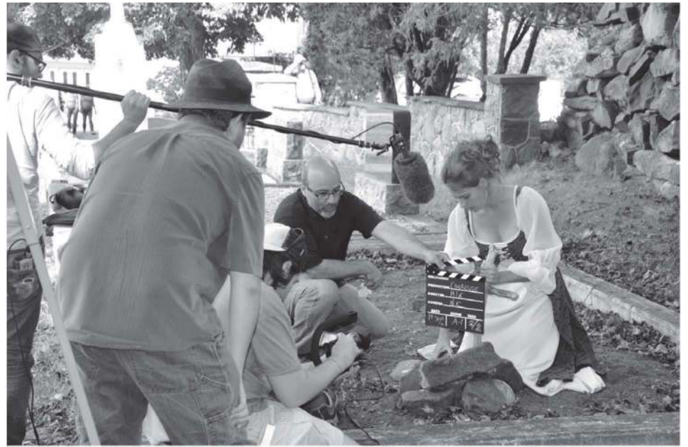
Des scènes de La Coureuse des grèves, au-delà de la légende ont été tournées au cimetière de Saint-Jean-Port-Joli.

lieu la Soirée de Première de la Course des Régions pancanadienne, au Théâtre Granada de Sherbrooke, et que l'identité des gagnants sera dévoilée. D'ici là, les gens peuvent suivre l'évolution du projet de MiK Landry sur la page Facebook La Coureuse des grèves , au-delà de la légende.