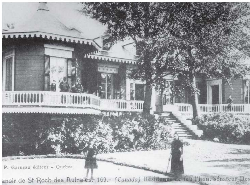
P. Garneau éditeur - Québec

reau. Celle de la seigneuresse, ouverte durant l'été servait de salon de thé.