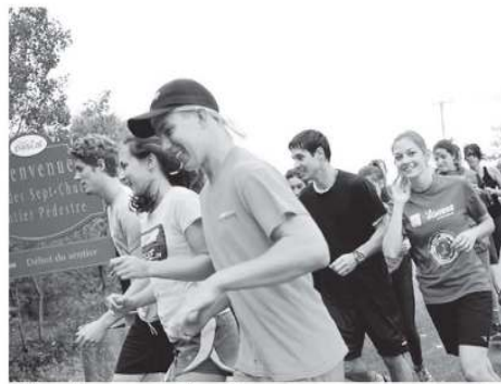
Plus d'une centaine de courageux sont venus parcourir le Défi 7 chutes le dimanche 11 septembre.

Des coureurs de tout âge (de 5 à 71 ans) ont couru le sentier qui était parsemé de 20 obstacles. Plusieurs d'entre eux ont souligné la qualité du parcours, la bonne humeur des bénévoles et le caractère convivial de l'événement. L'organisation tient à remercier tous les participants, les nombreux bénévoles et les commanditaires qui permettent de présenter cette course gratuitement. Une quatrième édition aura lieu le 10 septembre 2017.