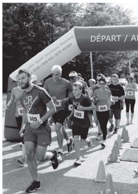
108 personnes ont participé au Défi des Côtes cette année.