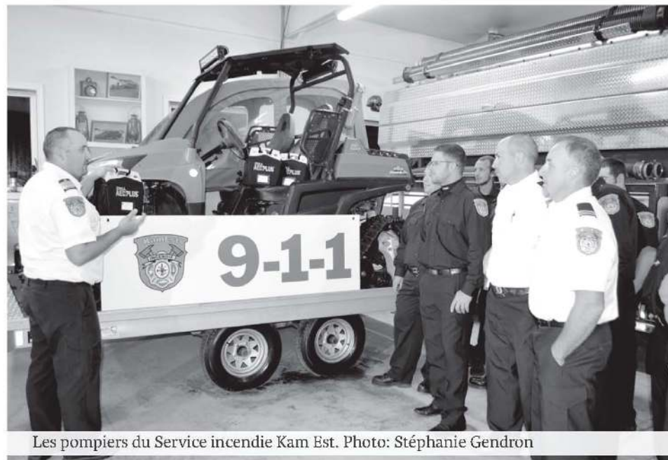
Les pompiers du Service incendie Kam Est.

Lorsqu'ils sont venus en renfort à leurs confrères pompiers sur le site de cet incendie qui a marqué le Québec et qui a causé la mort de 32 personnes âgées, les pompiers de Saint-Alexandre, Saint-Joseph et Saint-André souhaitaient déjà y aller bénévolement.