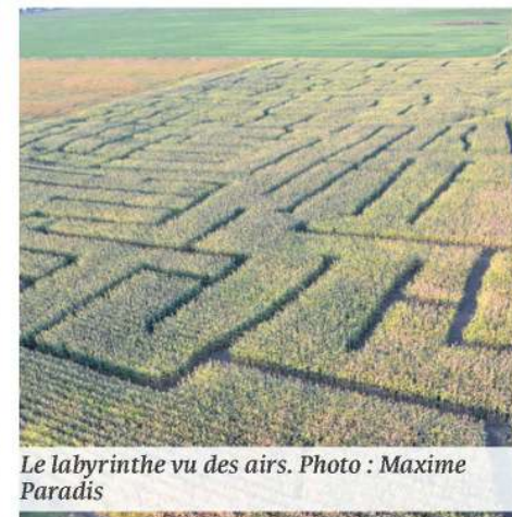
Le labyrinthe vu des airs.

Le Grand Labyrinthe de Sainte-Anne est ouvert tous les jeudis et vendredis de 17 h à 22 h, les samedis de 10 h à 22 h et les dimanches de 10 h à 17 h. Il sera également possible de s'y rendre le lundi de l'Action de grâce de 10 h à 17 h.