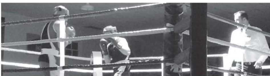
Un des combats de vendredi dernier.

Plus de 400 personnes ont pris part au 2e Gala de boxe organisé par le Club de boxe LaPoc, vendredi dernier à Saint-Pascal.