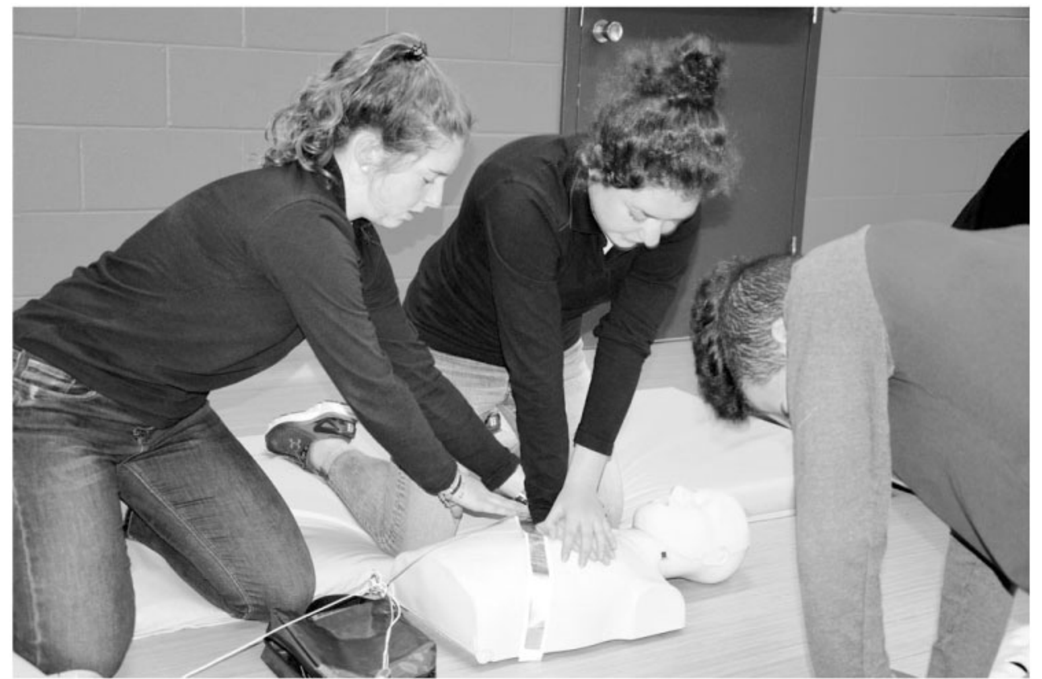
Des élèves pratiquent les manœuvres de RCR.