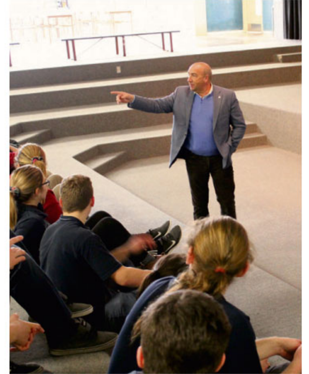
Le député Généreux lors d'une visite scolaire d'une école secondaire de la circonscription discute avec des étudiants du processus d'adoption d'une loi et de l'impact de la légalisation du cannabis.

à la maison? C'est tout simplement insensé» tempête M. Généreux.