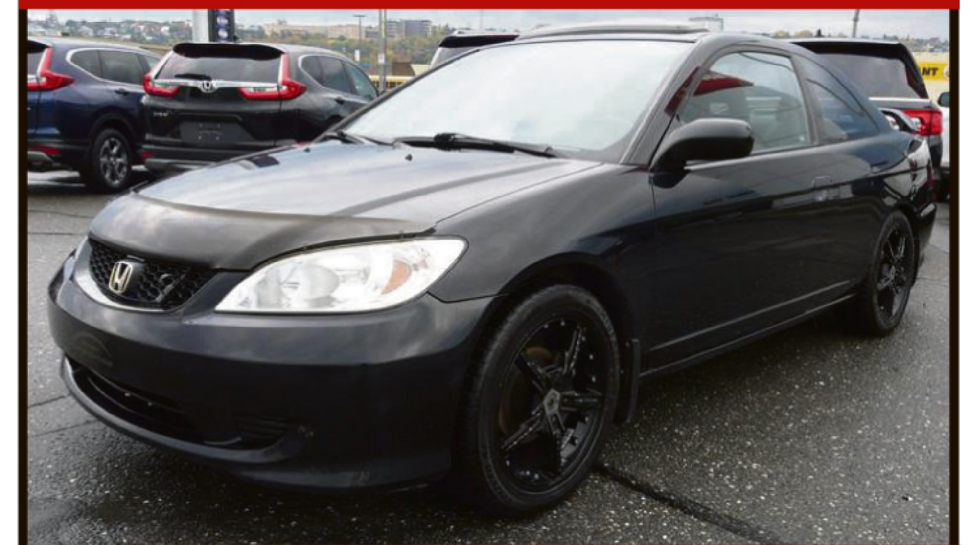
HONDA CIVIC CPE 2005 2DR SI-G

Automatique, climatisation, groupe électrique, rég. de vitesse, DC, sièges baquets. 183 000 km. #W5051A