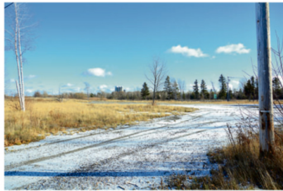
Le terrain où le projet est prévu.

Même s'il considère ce projet comme étant une excellente nouvelle pour Saint-Roch-des-Aulnaies, M. Simard dit resté préoccupé par le dossier de l'Épicerie du Village qui a fermé ses portes il y a une semaine à peine et qui disposait d'une station-service. « C'est une fermeture, on ne parle pas de faillite. On est toujours préoccupé par l'avenir du site et nous sommes en situation de veille pour le moment. »