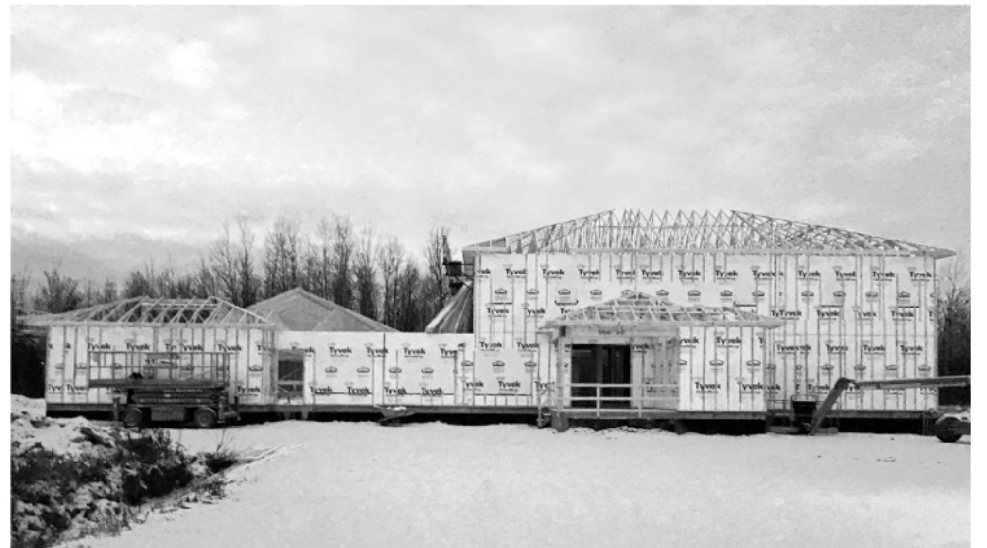
Les travaux avancent comme prévu à la Maison d'Hélène.