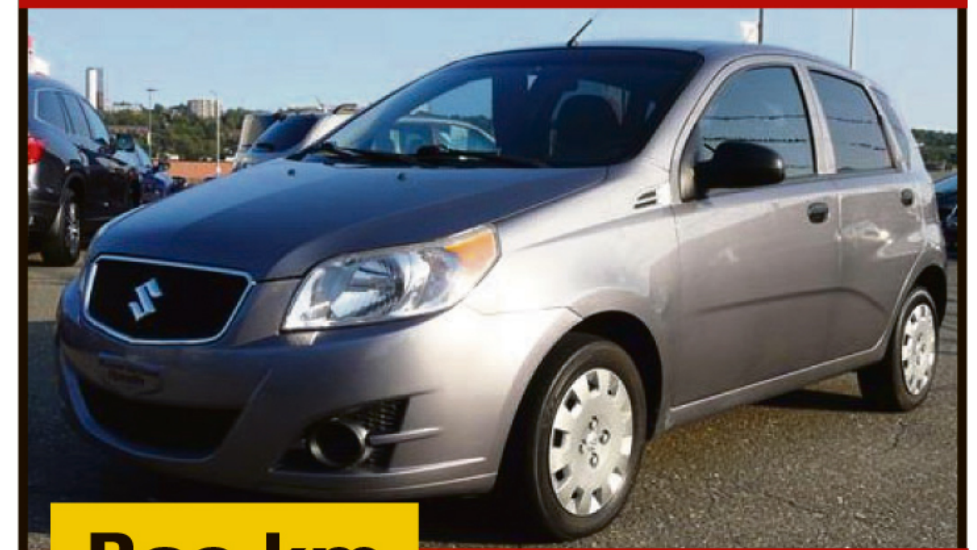
SUZUKI SWIFT 2009 5DR HB

Manuelle à 5 vitesses, climatisation, volant ajustable, sièges baquets, miroirs électriques. 180 400 km. #K5057B