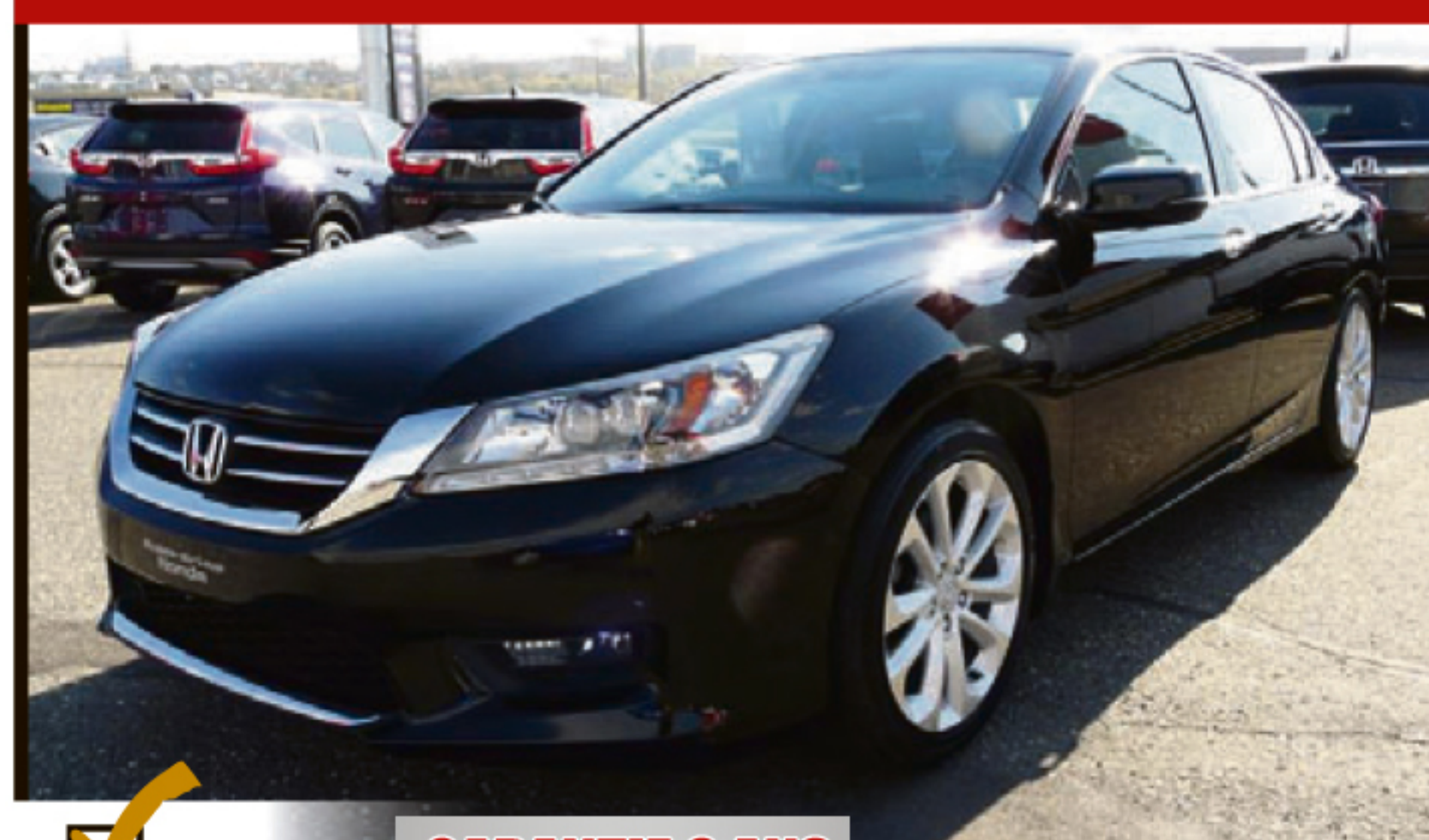
HONDA ACCORD SEDAN 2014 4DR I4 CVT TOURING

HONDA Certifié GARANTIE 6 ANS ou 120 000 KM