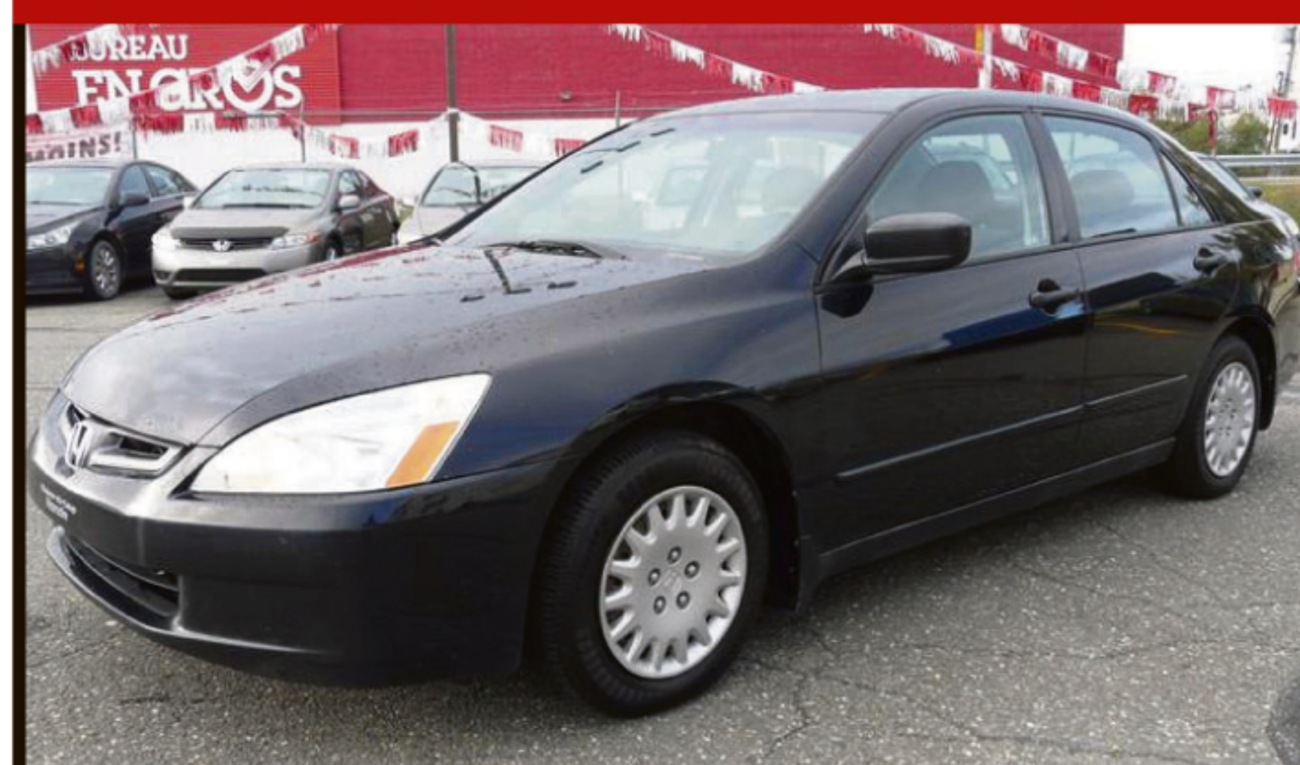
HONDA ACCORD SDN 2003 4DR SDN DX

Manuelle à 5 vitesses, climatisation, groupe électrique, rég. de vitesse, miroirs chauffants, jantes aluminium. 243 000 km. #C5067A