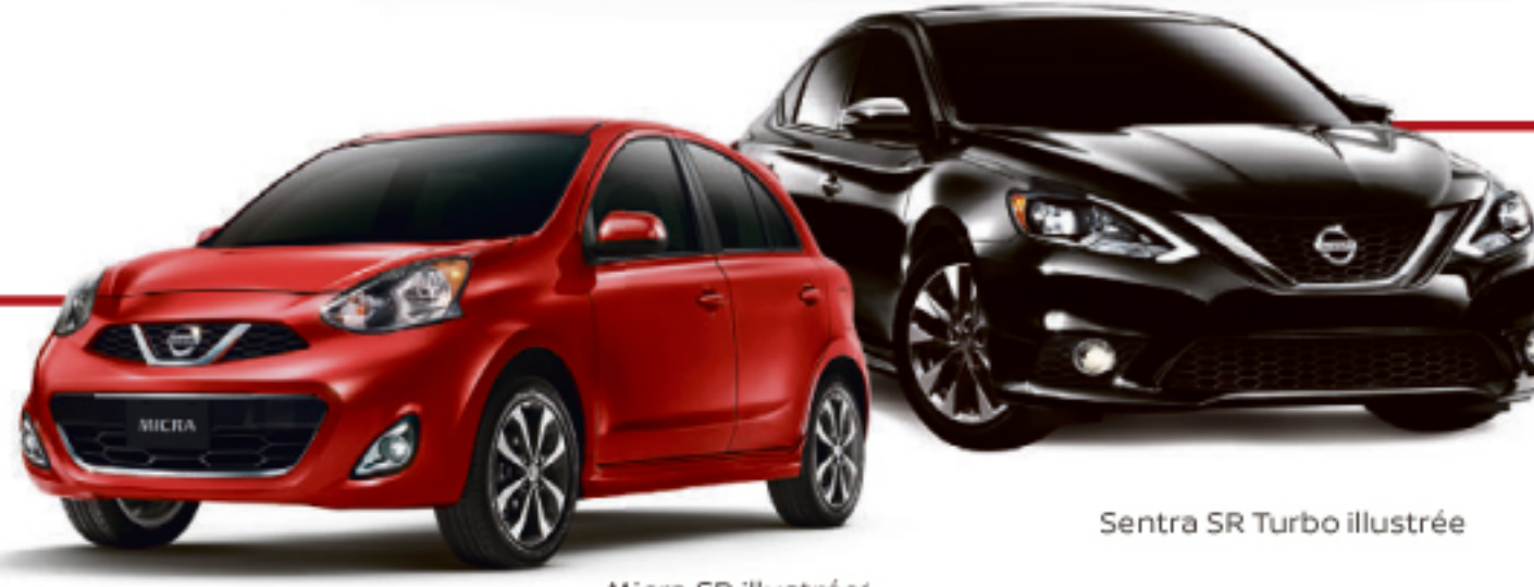
Micra SR illustrée*