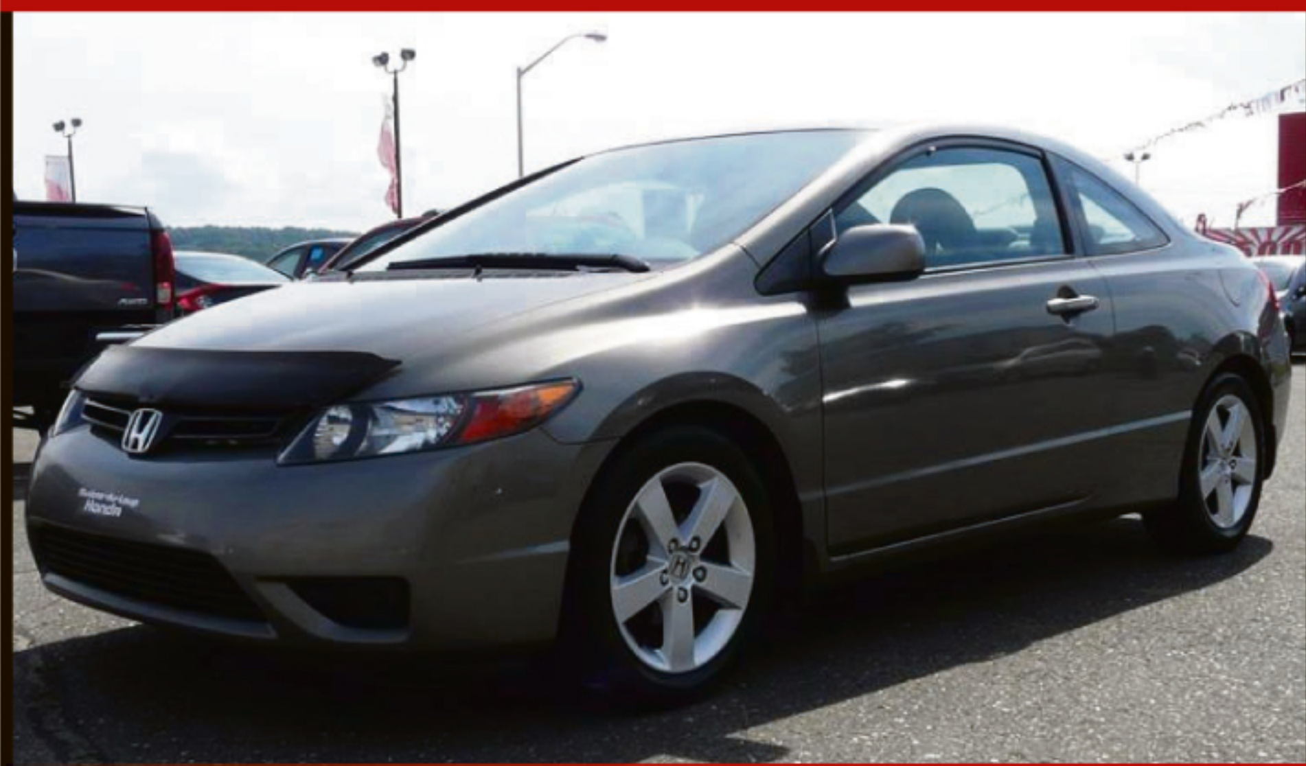
HONDA CIVIC CPE 2006 2DR LX

Manuelle, climatisation, volant ajustable, DC, MP3, sièges baquets, miroirs électriques. 209 000 km. #C5121A