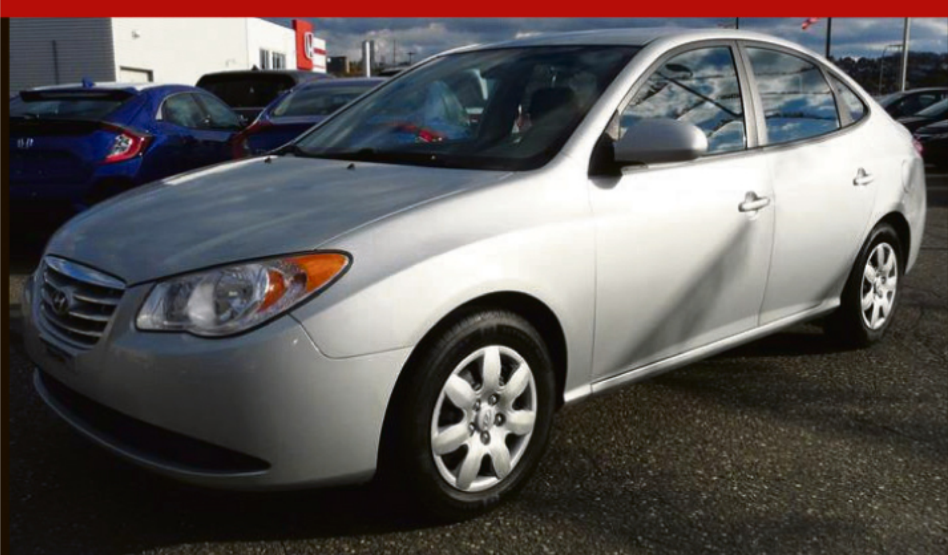
HYUNDAI ELANTRA 2010 4DR SDN L

Automatique, volant ajustable, DC, sièges baquets. 74 600 km. #C4772B