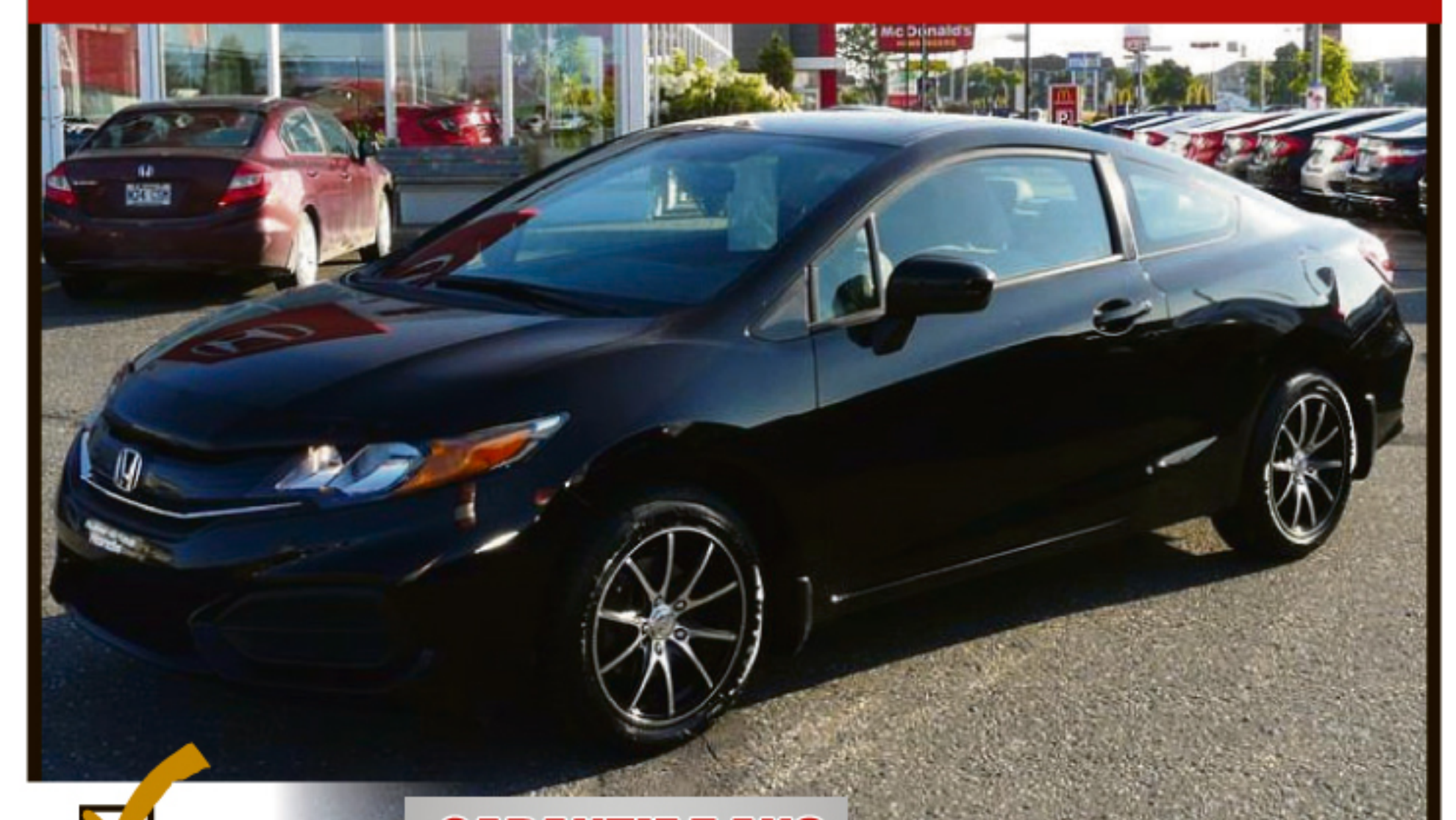
HONDA CIVIC COUPÉ 2014 2DR CVT LX

HONDA Certifié GARANTIE 7 ANS ou 160 000 KM