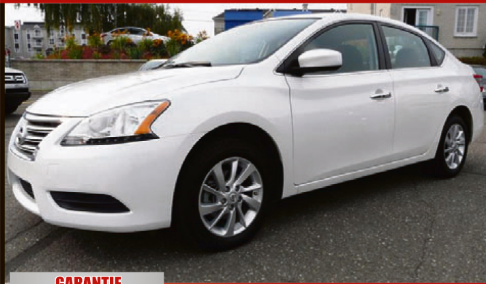
NISSAN SENTRA 2015 4DR SDN

GARANTIE JUSQU'AU 2020-07-09 ou 100 000 KM