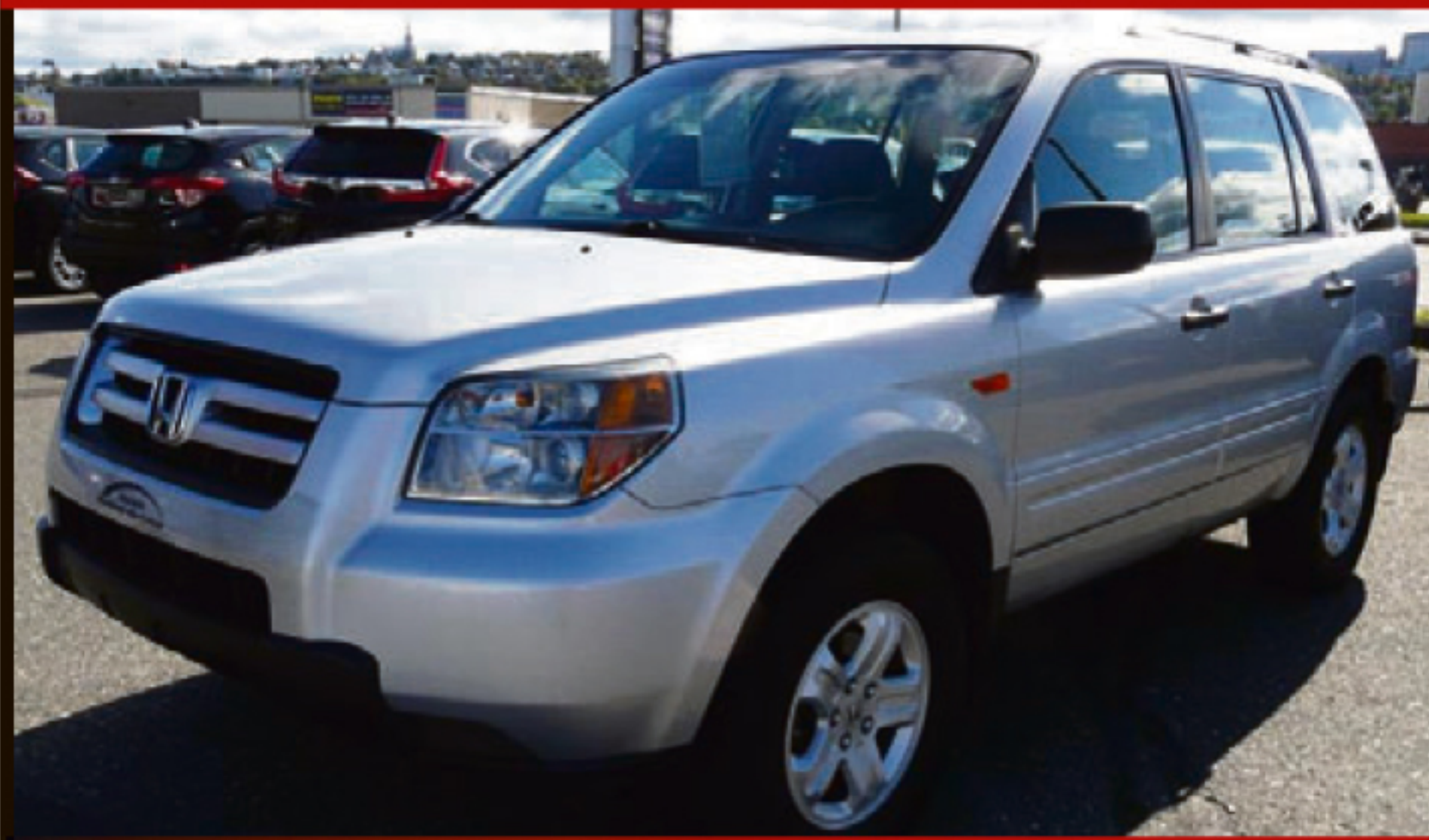
HONDA PILOT 2007 2WD 4DR LX

Automatique, climatisation, tout équipé, DC, Bluetooth, MP3, ordi. de bord, miroirs chauffants, jantes aluminium. 9 990 km. #U-3035