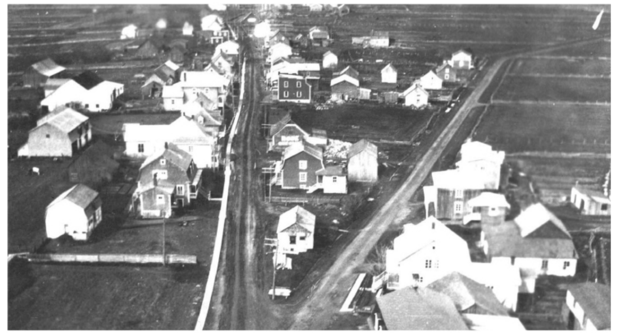
Le village de Sainte-Louise vu du clocher de l'église vers 1930

Enfin, on ne peut passer sous silence l'artisan menuisier et sculpteur de Sainte-Jean-Port-Joli, Servule Morneau. En 1950, la photographe Lida Moser a immortalisé cet humble artisan devant les fenêtres et la magnifique porte sculptées de sa maison.