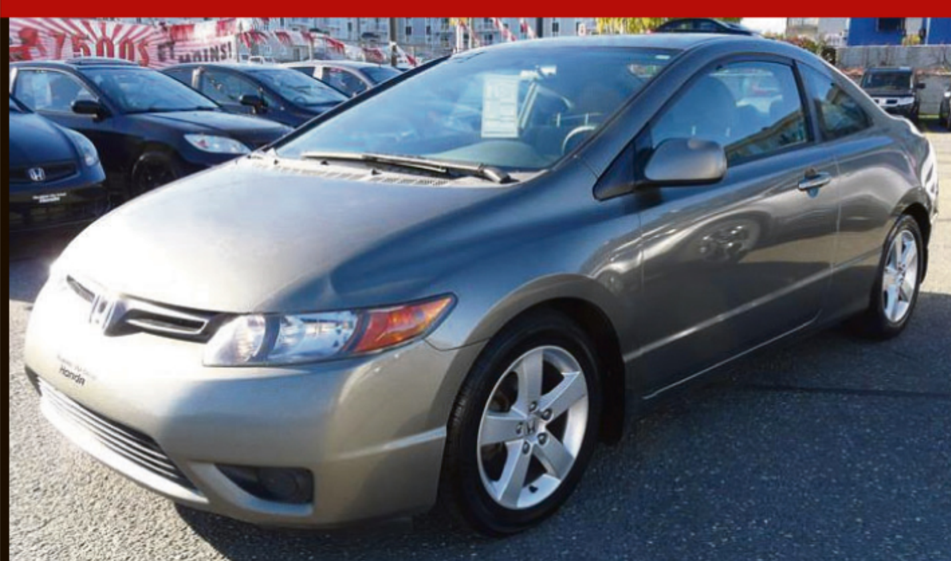
HONDA CIVIC CPE 2006 2DR LX

Manuelle, portes et vitres électriques, volant ajustable, DC, sièges baquets. 177 000 km. #C5096A