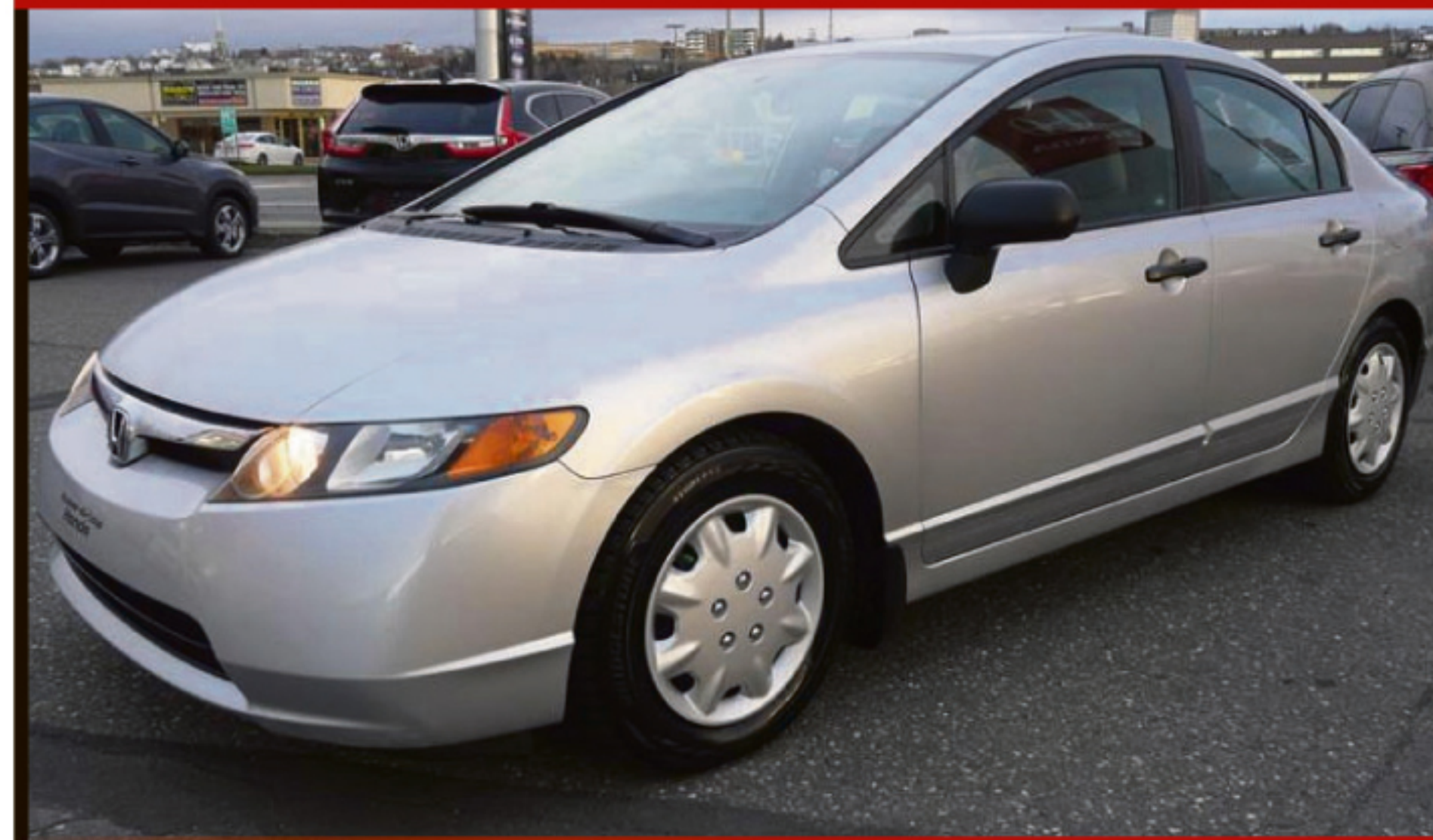
HONDA CIVIC SDN 2008 4DR DX-G

Automatique, climatisation, groupe électrique, DC, miroirs chauffants, jantes aluminium. 107 400 km. #W5014A