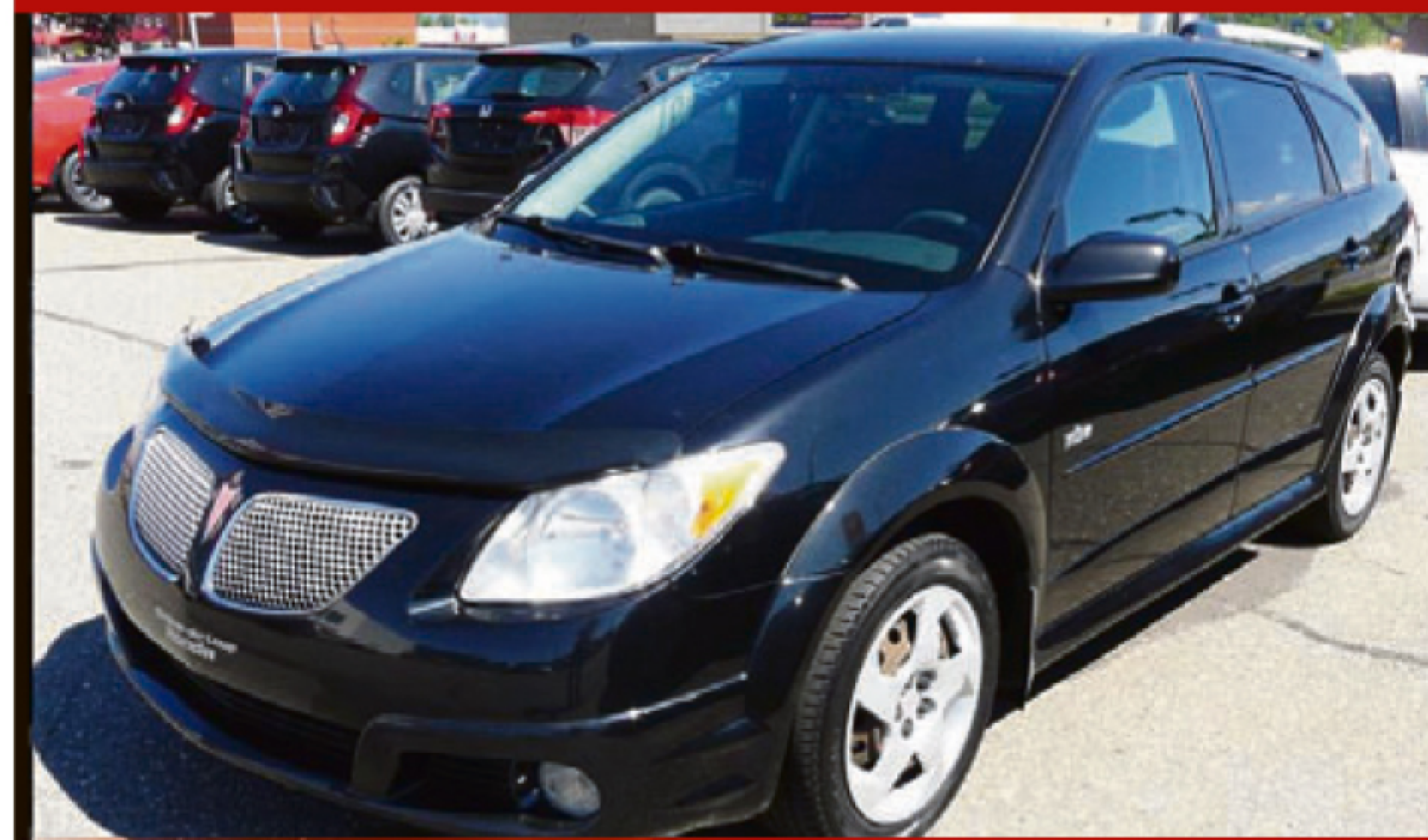
PONTIAC VIBE 2007 4DR WGN

Automatique, climatisation, portes et miroirs électriques, rég. de vitesse, DC, sièges baquets. 127 650 km. #M4471A