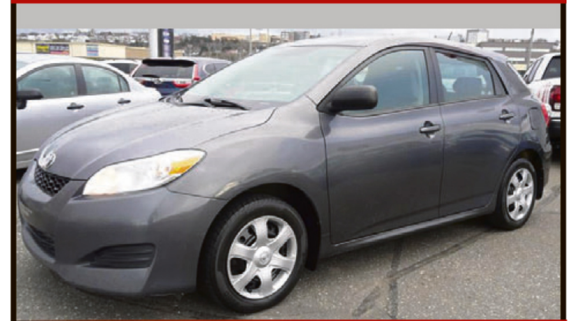
TOYOTA MATRIX 2010 4DR WGN FWD

Automatique, climatisation, groupe électrique, régulateur de vitesse, DC, MP3, jantes aluminium. 132 400 km. #U3041A