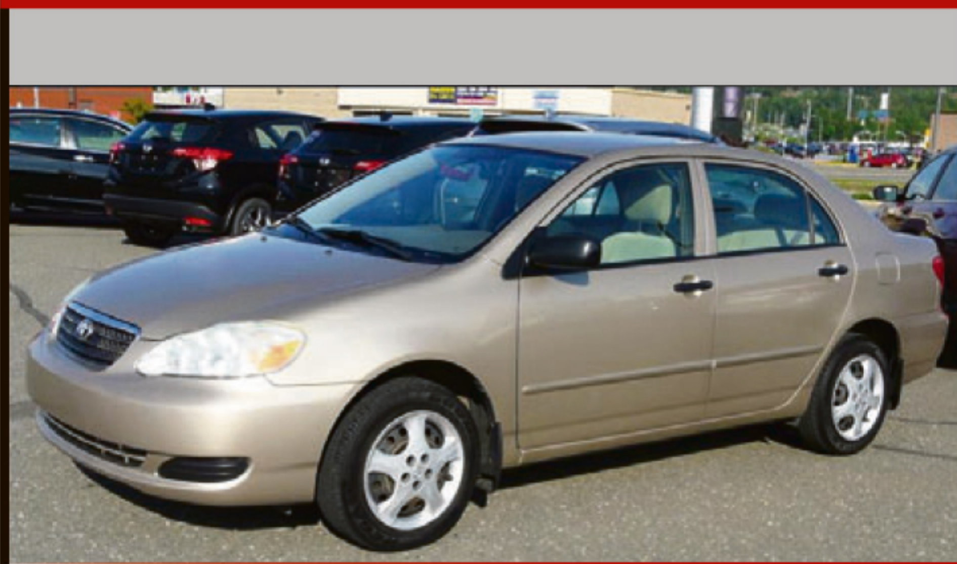
TOYOTA COROLLA 2006 4DR SDN

Automatique, climatisation, groupe électrique, rég. de vitesse, DC, miroirs chauffants. 119 625 km. #W4936B