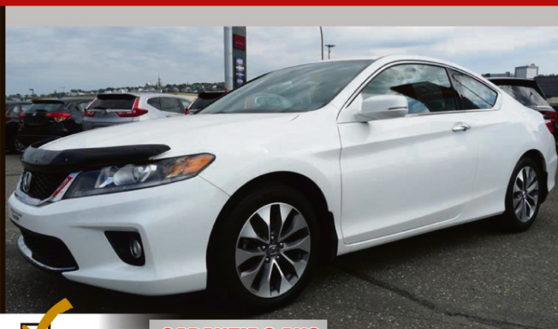
HONDA ACCORD COUPE 2015 2DR I4 EX

HONDA Certifié GARANTIE 6 ANS ou 120 000 KM