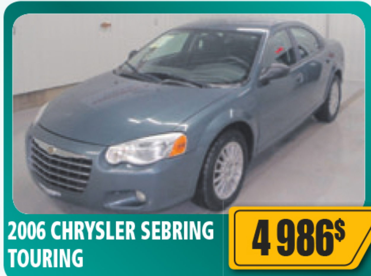
2006 CHRYSLER SEBRING TOURING 4 986$ 4 portes, V6, automatique, air climatisé, tout équipé. Seulement 114 978 km • Stock : 2014486B