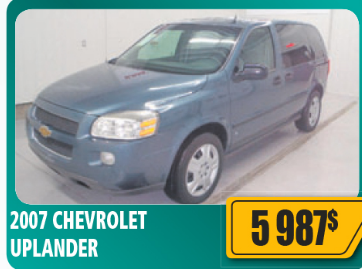
2007 CHEVROLET UPLANDER 5 987$ V6, 7 places, air climatisé, vitres et serrures électriques et plus. Seulement 91 349 km • Stock : 2014363A