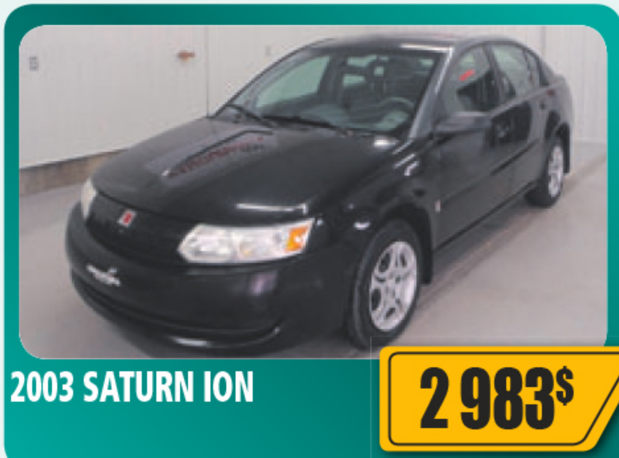
2003 SATURN ION 2 983$ 4 portes, 4 cylindres, béquet arrière. 147 519 km • Stock : 2013264B