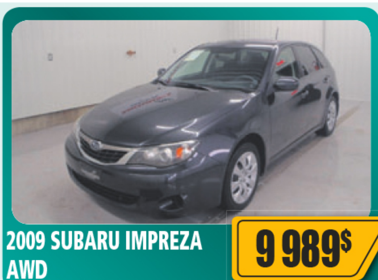
2009 SUBARU IMPREZA AWD 9 989$ 5 portes, 2,5 L, air climatisé, vitres et serrures électriques, volant inclinable, régulateur de vitesse et plus. 142 026 km • Stock : 2015145A