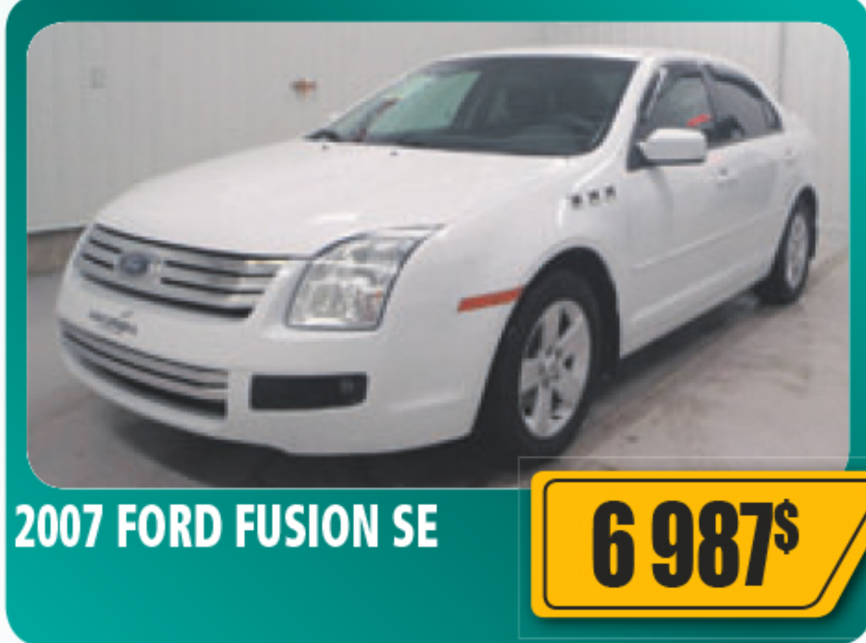
2007 FORD FUSION SE 6 987$ 4 portes, automatique, air climatisé, vitres, serrures et sièges électriques, roues en alliage, béquet arrière et plus. Seulement 96 688 km • Stock : 2015079B