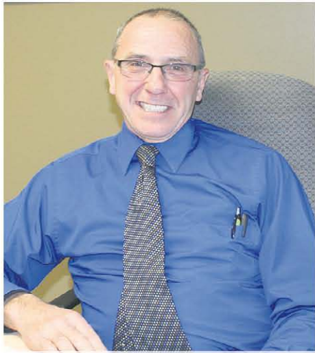
Le maire de L'Islet, André Caron, était fier de présenter les projets 2015 de sa municipalité.

Un dossier d'importance, qui traîne depuis 12 ans, devrait se concrétiser en 2015, au grand plaisir du maire de L'Islet, André Caron. « Ça s'annonce très bien », mentionne M. Caron, sans pouvoir en dire beaucoup plus pour l'instant, à propos du nouveau réseau d'aqueduc de la rue des Pionniers Est – la route 132 vers Saint-Jean-Port-Joli – réclamée par plus d'une centaine de résidents. Toutefois, le résultat s'annonce positif et des confirmations viendront sous peu.