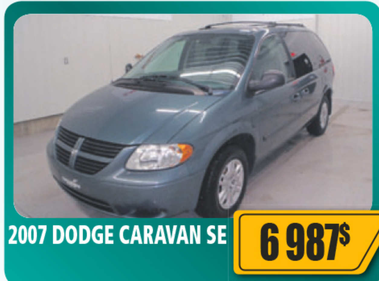
2007 DODGE CARAVAN SE 6 987$ V6, automatique, 7 places, vitres et serrures électriques, air climatisé, démarreur à distance et plus. 113 037 km • Stock : E659A