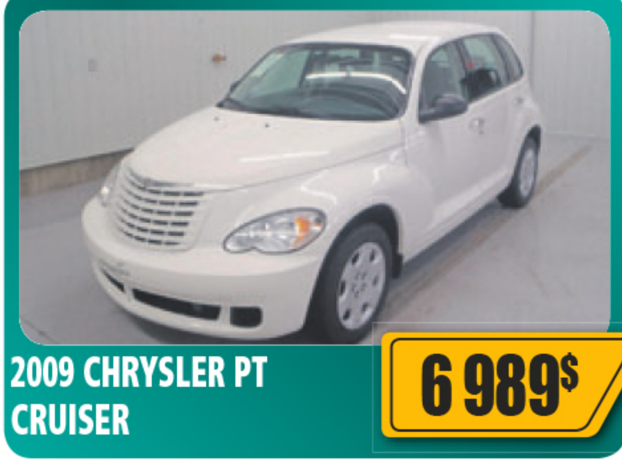
2009 CHRYSLER PT CRUISER 6 989$ 5 portes, 2.4 L, automatique, air climatisé, vitres et serrures électriques, volant inclinable, régulateur de vitesse, démarreur à distance et plus. 97 670 km • Stock : 2014024A