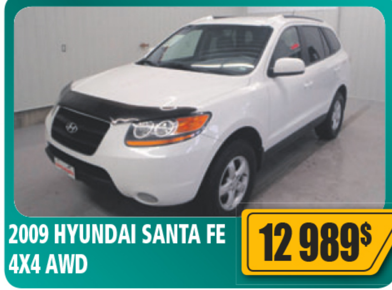
2009 HYUNDAI SANTA FE 4X4 AWD 12 989$ V6, automatique, air climatisé, vitres et serrures électriques, roues en alliage, régulateur de vitesse et plus. 91 323 km • Stock : E633A