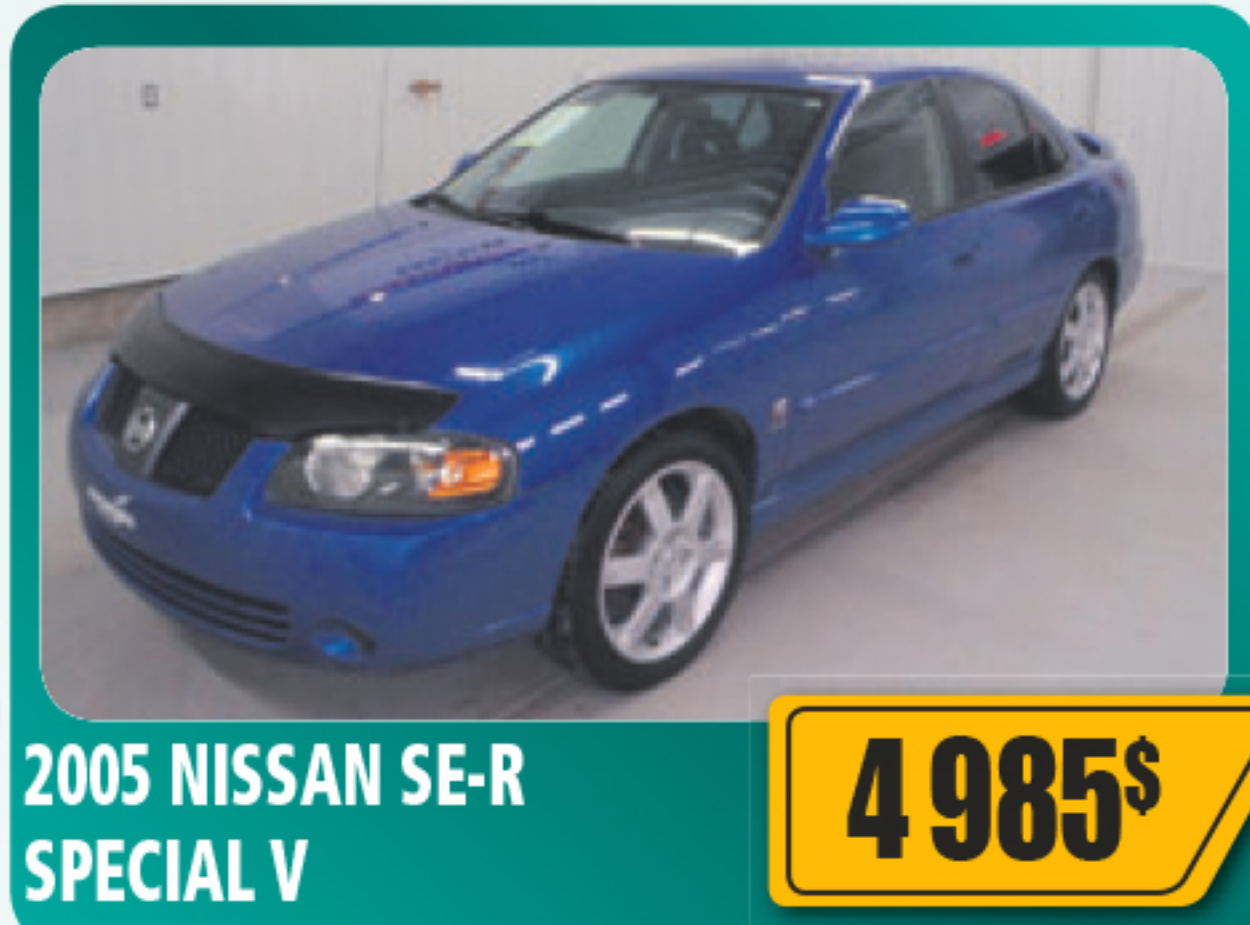
2005 NISSAN SE-R SPECIAL V 4 985$ 4 portes, 2.5 L, tout équipé, roues en alliage. 190 721 km • Stock : 2014314C