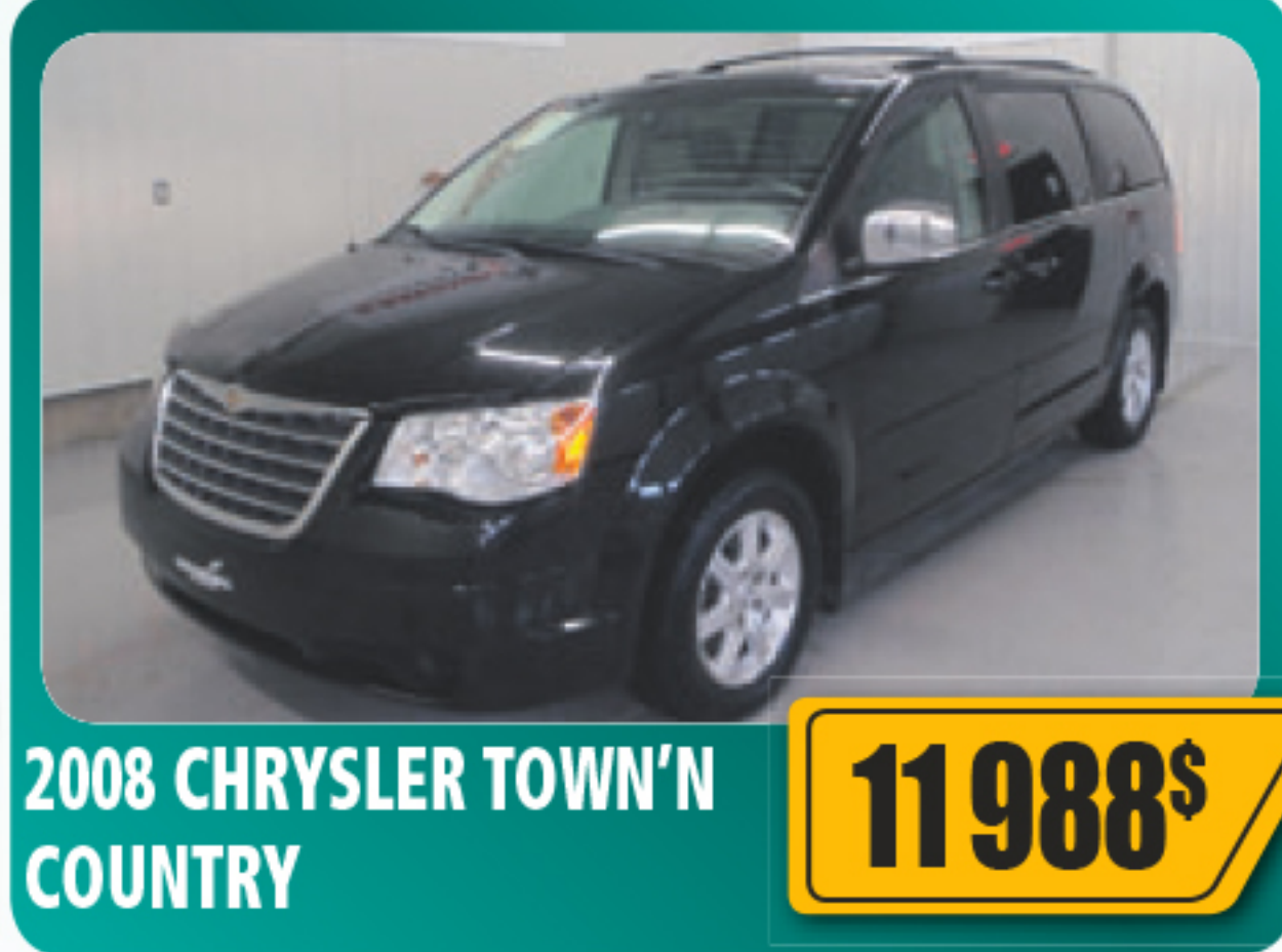
2008 CHRYSLER TOWN 'N' COUNTRY 11 988$ V6, Stow'n'Go, air climatisé trizone, vitres, serrures et sièges électriques, régulateur de vitesse, roues en alliage et plus plus. Seulement 86 755 km • Stock : 2014069A