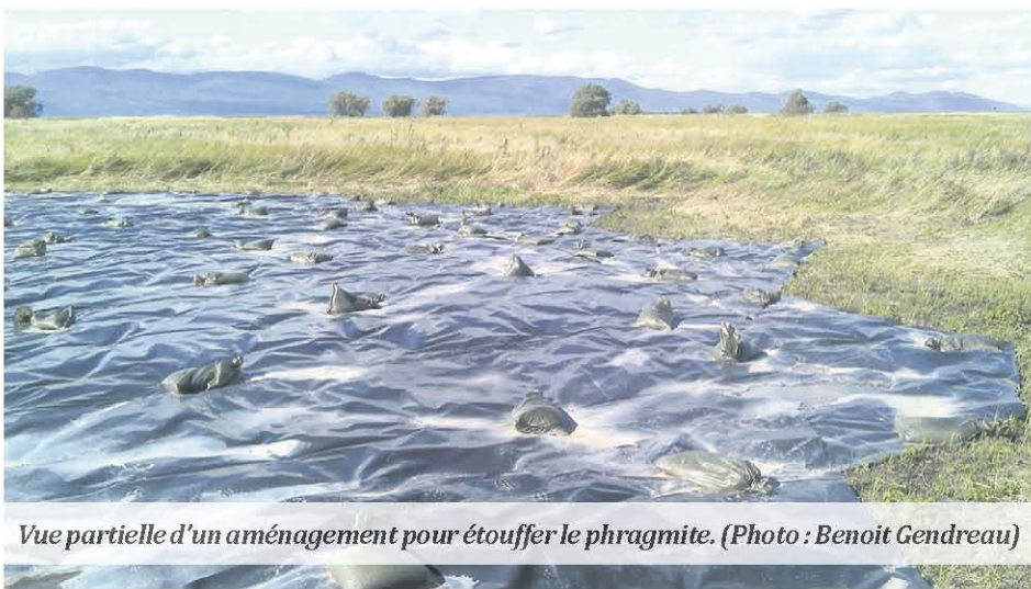
Vue partielle d'un aménagement pour étouffer le phragmite.