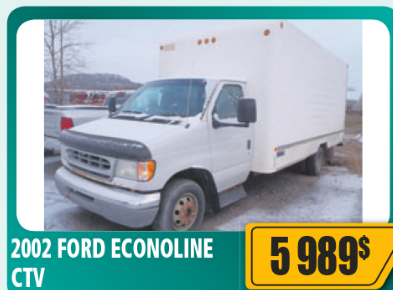
2002 FORD ECONOLINE CTV 5 989$ 7.3 L, diesel, automatique. 304 356 km • Stock : 2013234C