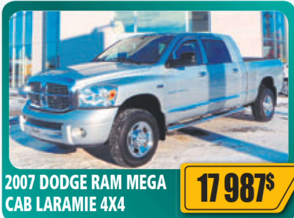
2007 DODGE RAM MEGA CAB LARAMIE 4X4 17 987$ 5.7 L, toit ouvrant, roues en alliage, équipé au complet. 141 356 km • Stock : E651A