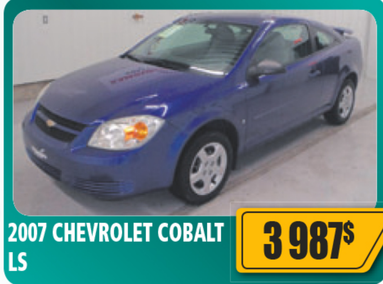
2007 CHEVROLET COBALT LS 3 987$ 2 portes, 4 cylindres, béquet arrière et plus. 123 513 km • Stock : 2013390C