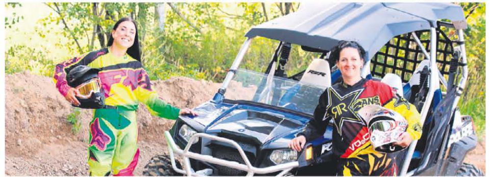
La prochaine activité de financement des Spartiates se tiendra lors de la course à obstacles hivernale le Blizzard VO2GYM, le samedi 28 février 2015 au 197 chemin des Poirier à Montmagny.

Ce défi n'est pas une mince entreprise. Une partie importante du projet est celui d'amasser des fonds. « On vise 38 000 $ ». Leur campagne de financement commence tout juste. « Selon l'évolution de la campagne, on pourra déterminer si l'on participe à l'édition de mars 2016 ou 2017 ». D'ici là, les deux Spartiates s'affaireront à la préparation de ce défi des plus incroyables.