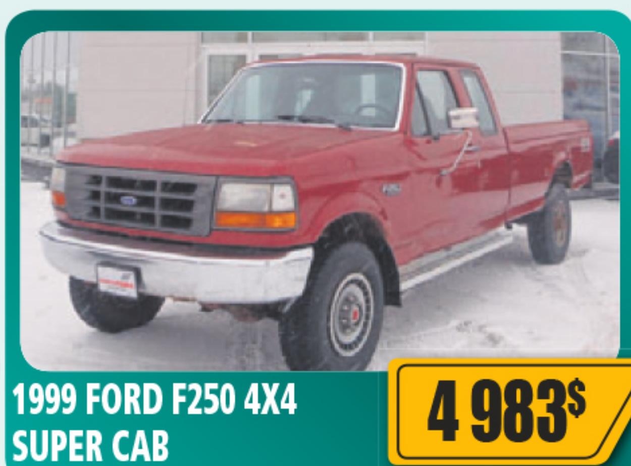
1999 FORD F250 4X4 SUPER CAB 4 983$ 7.3 L, diesel, automatique. 243 962 km • Stock : 2014254B