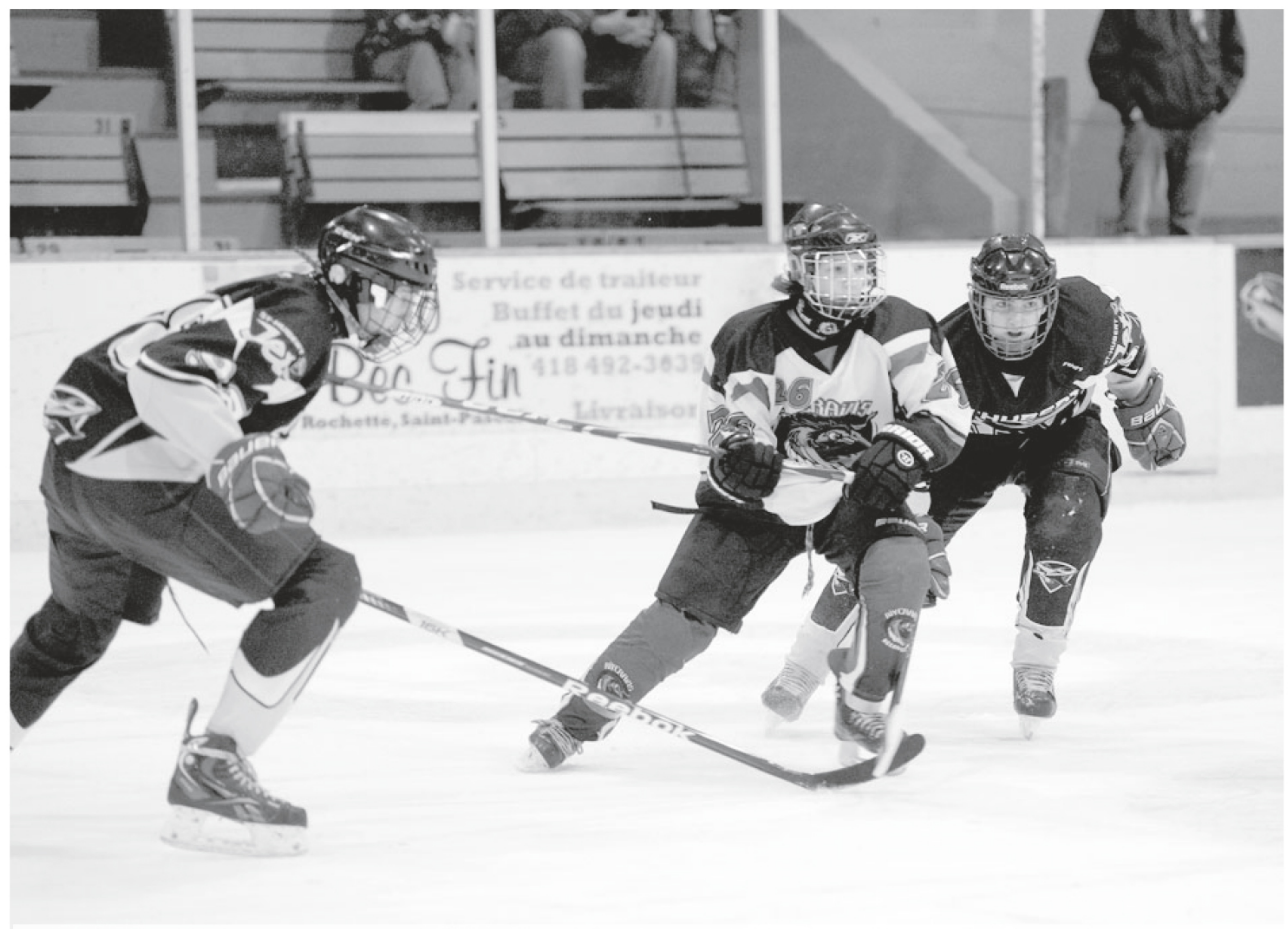
La finale midget B s'est terminée en tirs de barrage

L'absence d'équipes locales en finale a fait en sorte que l'assistance a été plus faible que prévu. L'équipe locale qui s'est rendue la plus loin est les Royaux dans le midget B. Cette équipe a atteint la demi-finale.