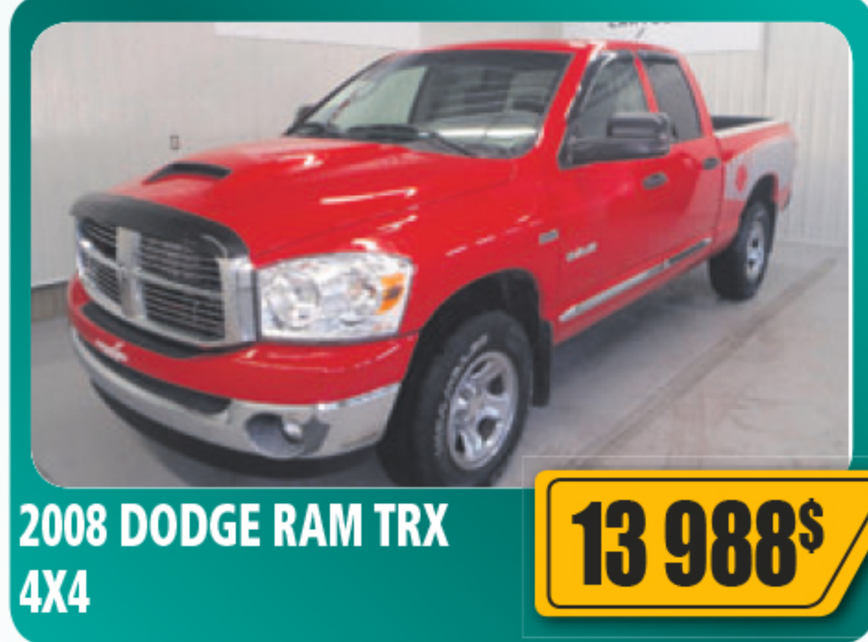
2008 DODGE RAM TRX 4X4 13 988$ 5.7 L, 4 portes, automatique, vitres, serrures et sièges électriques, volant ajustable, régulateur de vitesse, roues en alliage et plus. 148 612 km • Stock : 2014469A