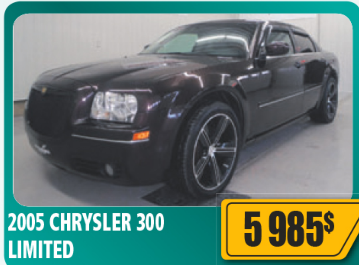
2005 CHRYSLER 300 LIMITED 5 985$ 4 portes, V6, automatique, vitres, serrures et sièges électriques, air climatisé, béquet arrière. 106 417 km • Stock : E614B