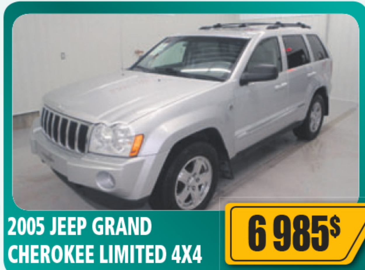
2005 JEEP GRAND CHEROKEE LIMITED 4X4 6 985$ Automatique, air climatisé, vitres, serrures et sièges électriques, régulateur de vitesse, roues en alliage et plus. 272 654 km • Stock : 2015085B