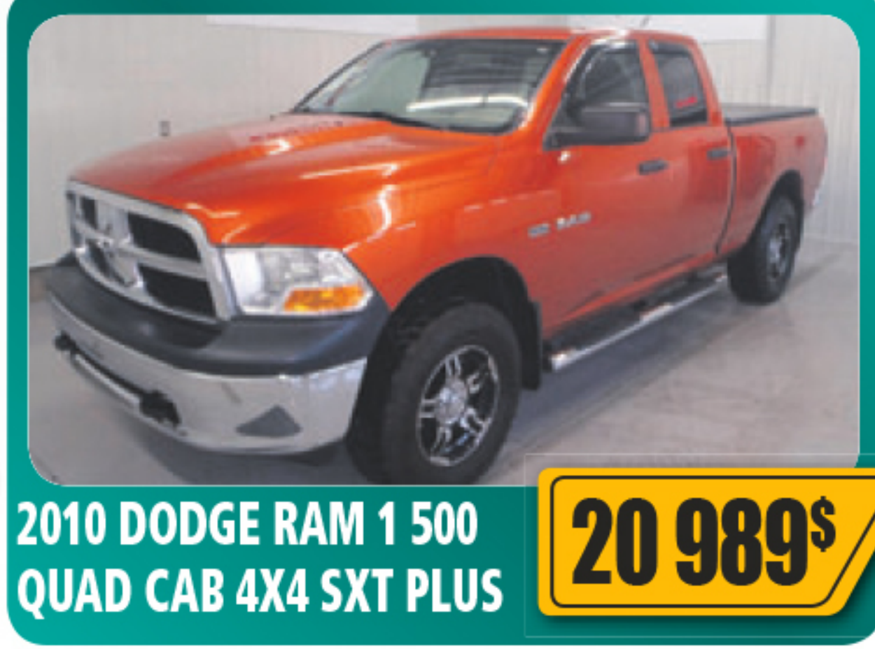
2010 DODGE RAM 1 500 QUAD CAB 4X4 SXT PLUS 20 989$ Roues en alliage, vitres et serrures électriques, marchepied, air climatisé, toile arrière et plus. Balance de garantie 5/100 Seulement 58 746 km • Stock : E650A