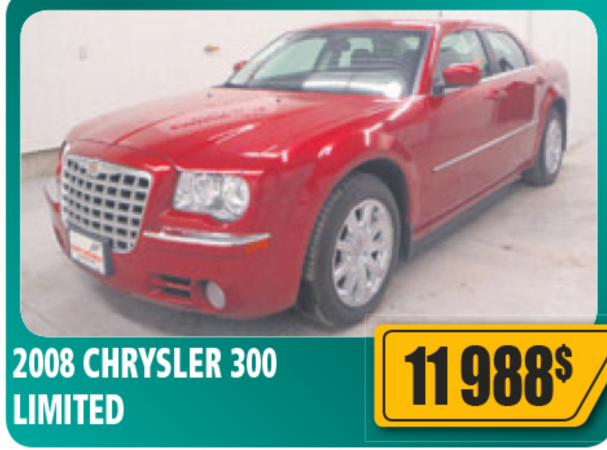
2008 CHRYSLER 300 LIMITED 11 988$ V6, automatique, vitres, serrures et sièges électriques, air climatisé, roues en alliage, toit ouvrant et plus. Seulement 78 316 Kkm • Stock : 2014274B