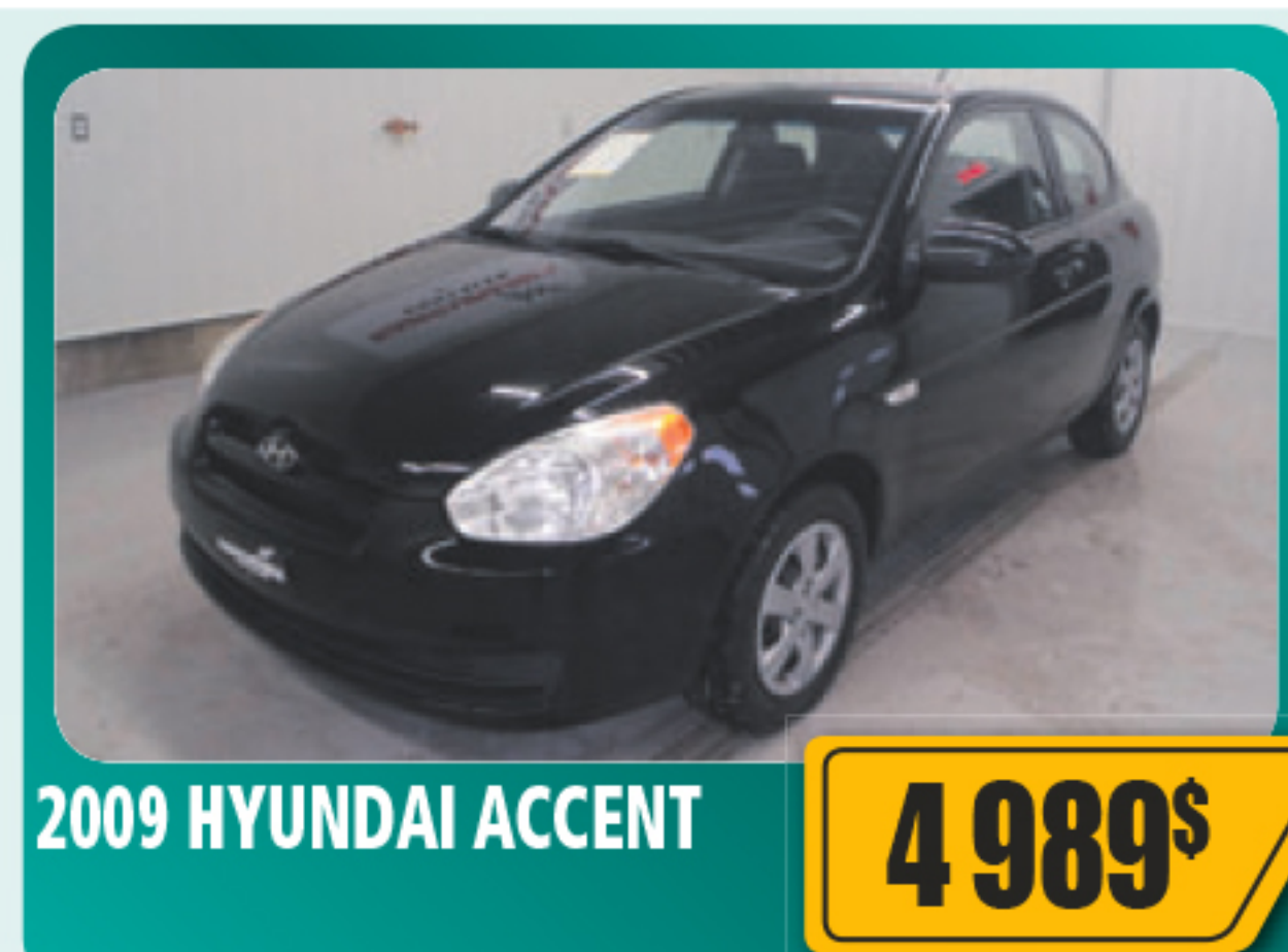
2009 HYUNDAI ACCENT 4 989$ 3 portes, 4 cylindres, air climatisé, AM/FM/CD. 116 187 km • Stock: 2014390C