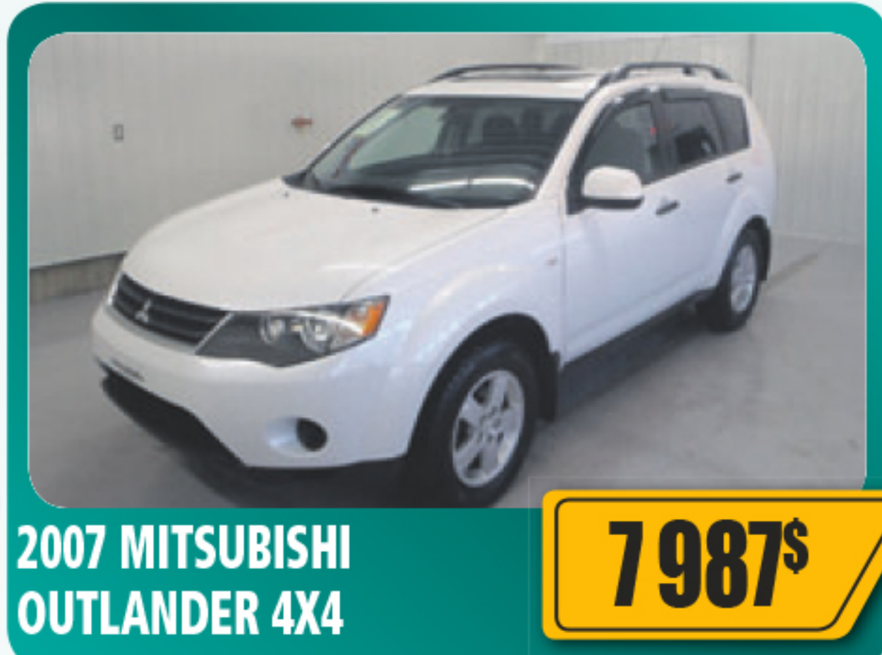
2007 MITSUBISHI OUTLANDER 4X4 7 987$ V6, automatique, toit ouvrant, équipé au complet. 166 174 km • Stock : E664B