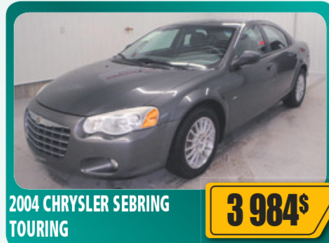
2004 CHRYSLER SEBRING TOURING 3 984$ 4 portes, V6, automatique, vitres et serrures électriques, régulateur de vitesse, roues en alliage. 99 637 km • Stock : E507B