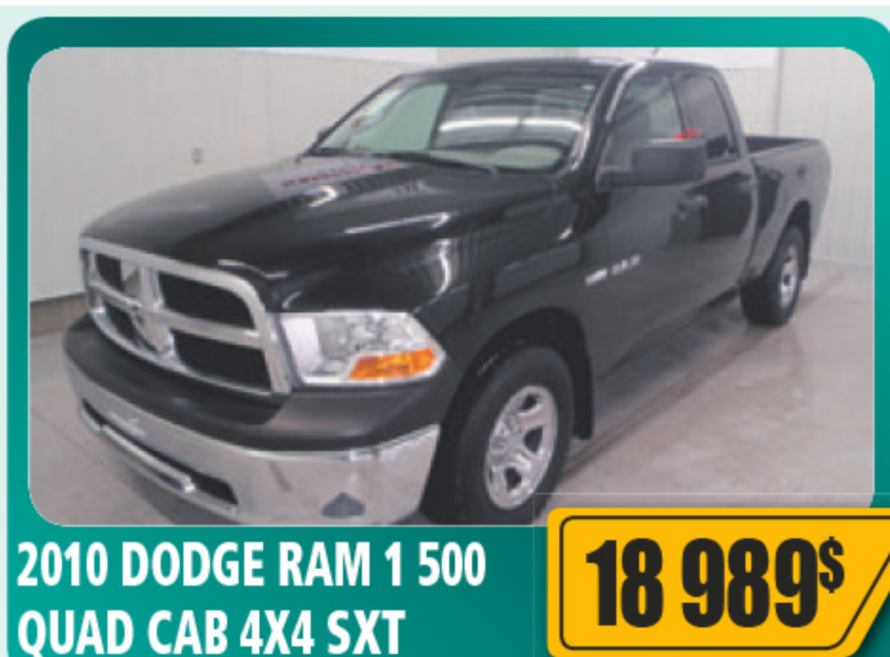
2010 DODGE RAM 1 500 QUAD CAB 4X4 SXT 18 989$ 5.7 L, automatique, air climatisé, vitres et serrures électriques, volant inclinable, régulateur de vitesse, roues en alliage et plus. Seulement 79 807 km • Stock : 2015183A