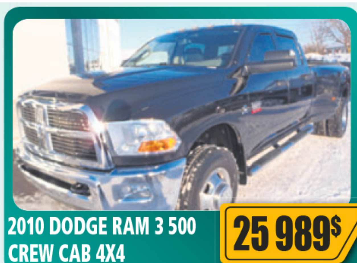
2010 DODGE RAM 3 500 CREW CAB 4X4 25 989$ 6.7 L, Cummins diesel, automatique, vitres, serrures et sièges électriques, air climatisé, marchepied et plus. 181 528 km • Stock : 2014187A