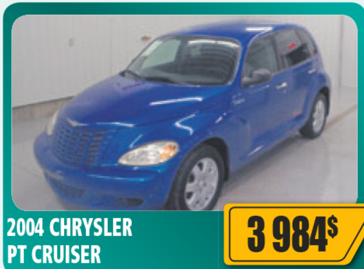
2004 CHRYSLER PT CRUISER 3 984$ 5 portes, 2.4 L, air climatisé, roues en alliage, toit ouvrant et plus. 145 582 km • Stock : 2014509B