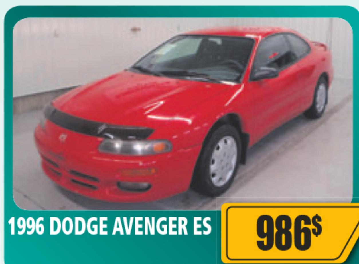
1996 DODGE AVENGER ES 986$ 2 portes, V6, automatique, béquet arrière et plus. 354 905 km • Stock : 2015032B