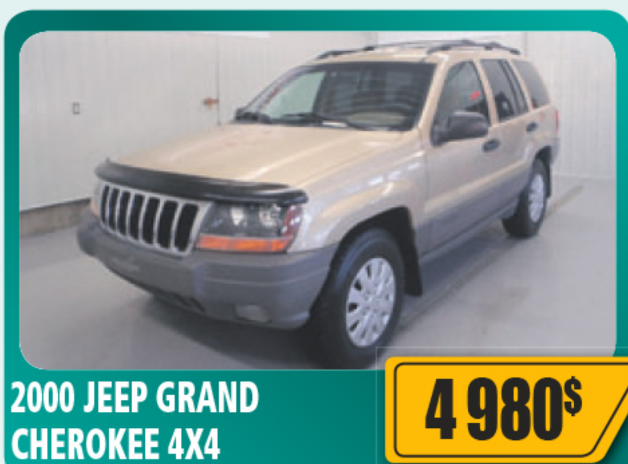
2000 JEEP GRAND CHEROKEE 4X4 4 980$ 6 cylindres, automatique, 127 923 km • Stock : 2013234D