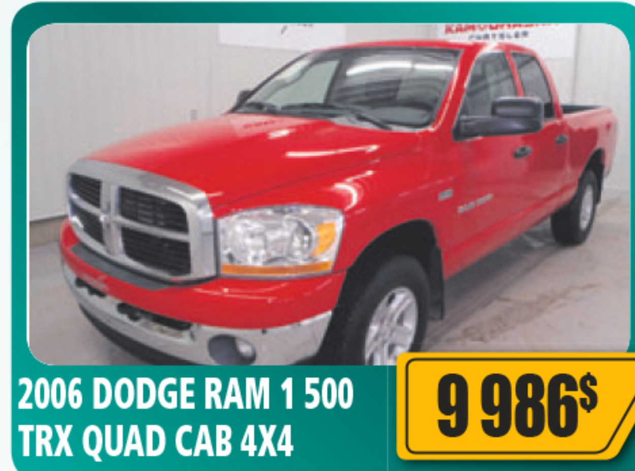
2006 DODGE RAM 1 500 TRX QUAD CAB 4X4 9 986$ 5.7 L, automatique, équipé. 206 701 km • Stock : 2014498A