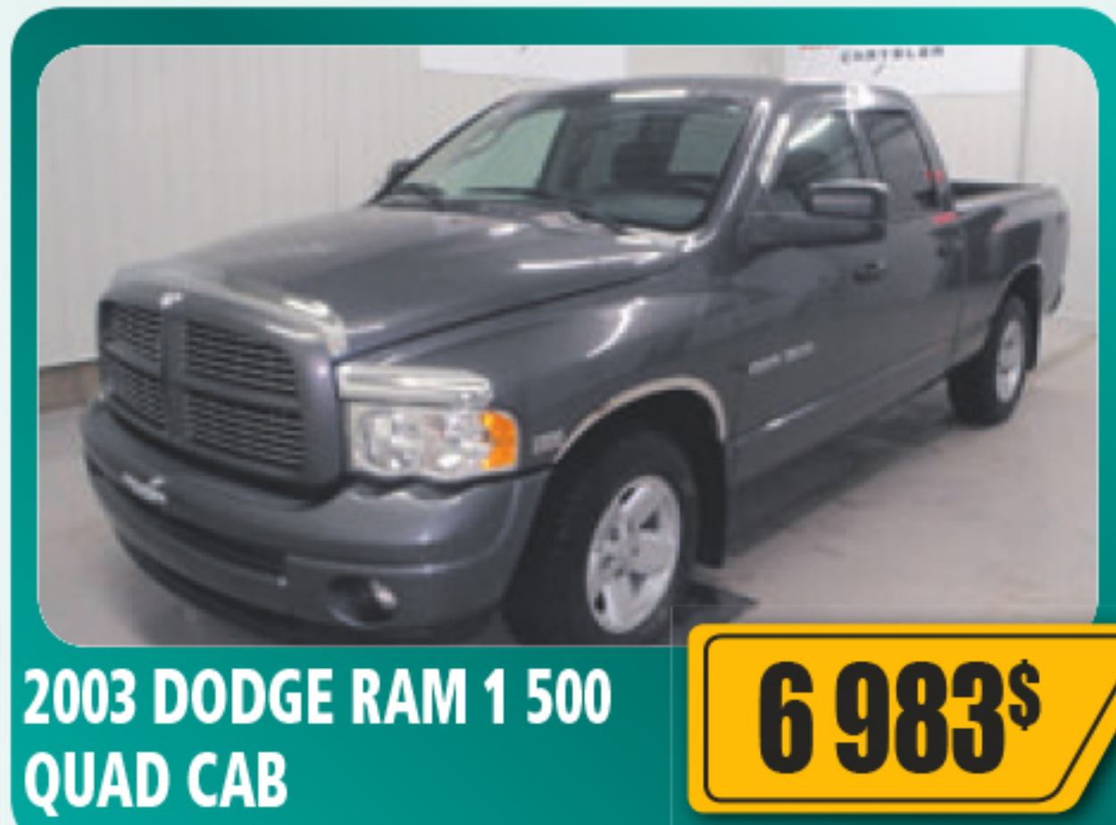
2003 DODGE RAM 1 500 QUAD CAB 6 983$ 5.7 L, air climatisé, vitres et serrures électriques, démarreur à distance et plus. 118 653 km • Stock : 2013033B