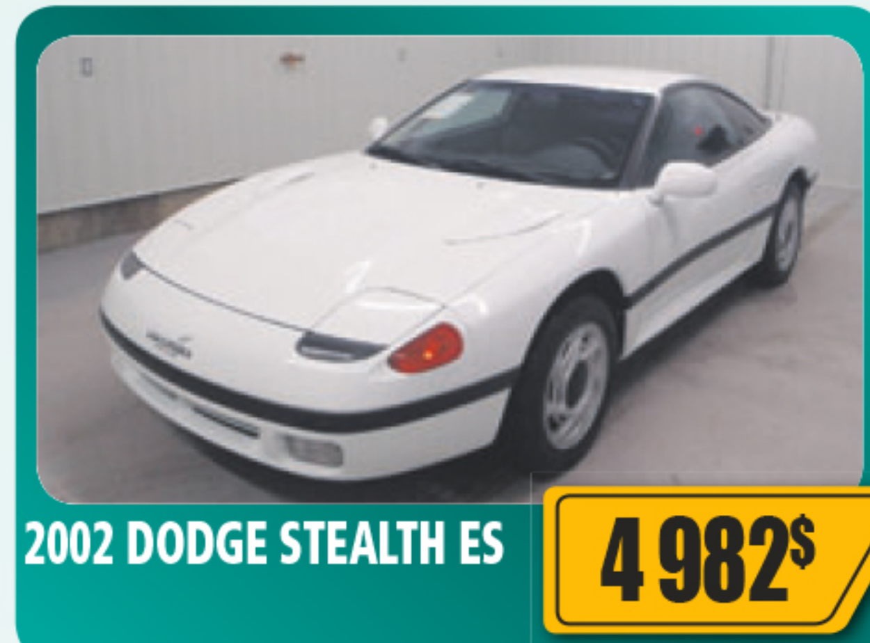
2002 DODGE STEALTH ES 4 982$ V6, 5 vitesses, équipé. Seulement 93 960 km • Stock : E654