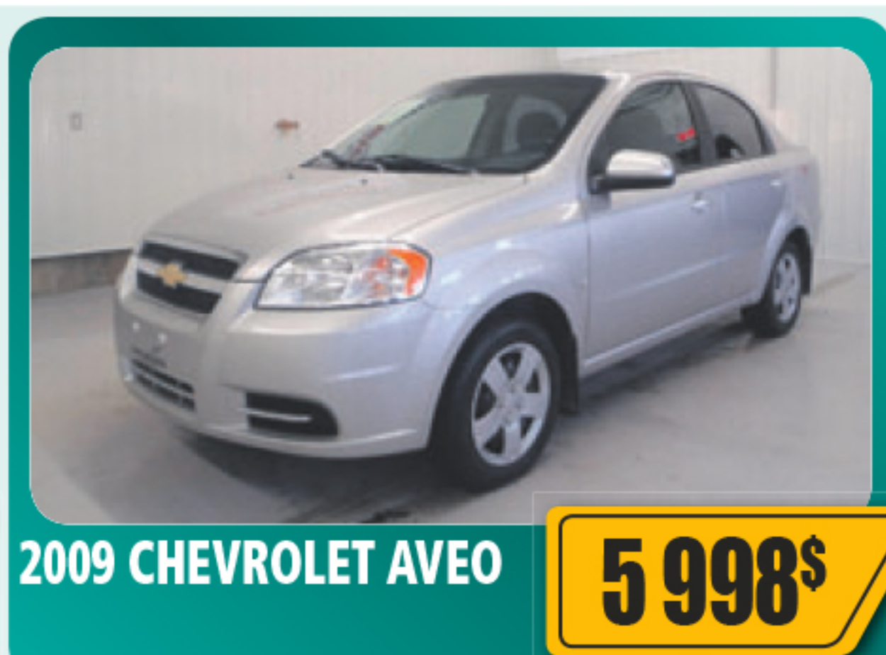
2009 CHEVROLET AVEO 5 998$ 4 portes, 1.6 L. COMME NEUF. Seulement 46 100 km • Stock : 2014550A