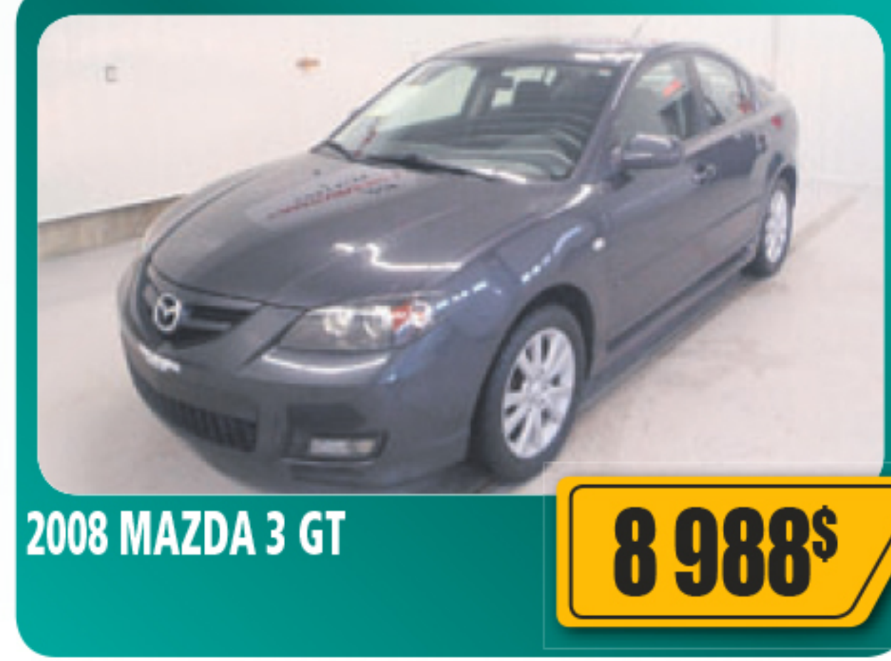
2008 MAZDA 3 GT 8 988$ 4 portes, air climatisé, vitres et serrures électriques, régulateur de vitesse, béquet arrière, roues en alliage et plus. 99 169 km • Stock : 2014351B