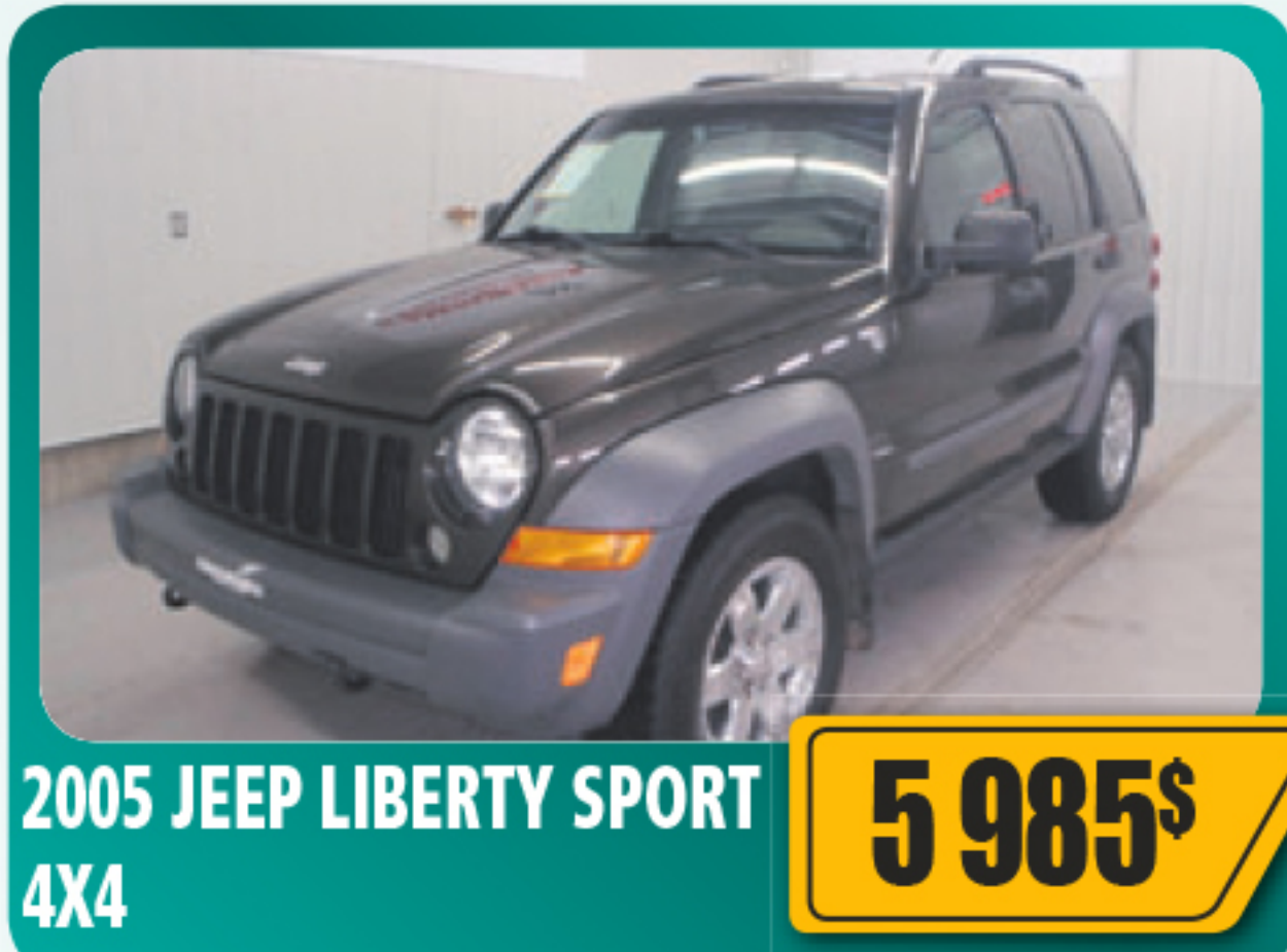
2005 JEEP LIBERTY SPORT 4X4 5 985$ V6, automatique, tout équipé. 137 290 km • Stock : 2014339C