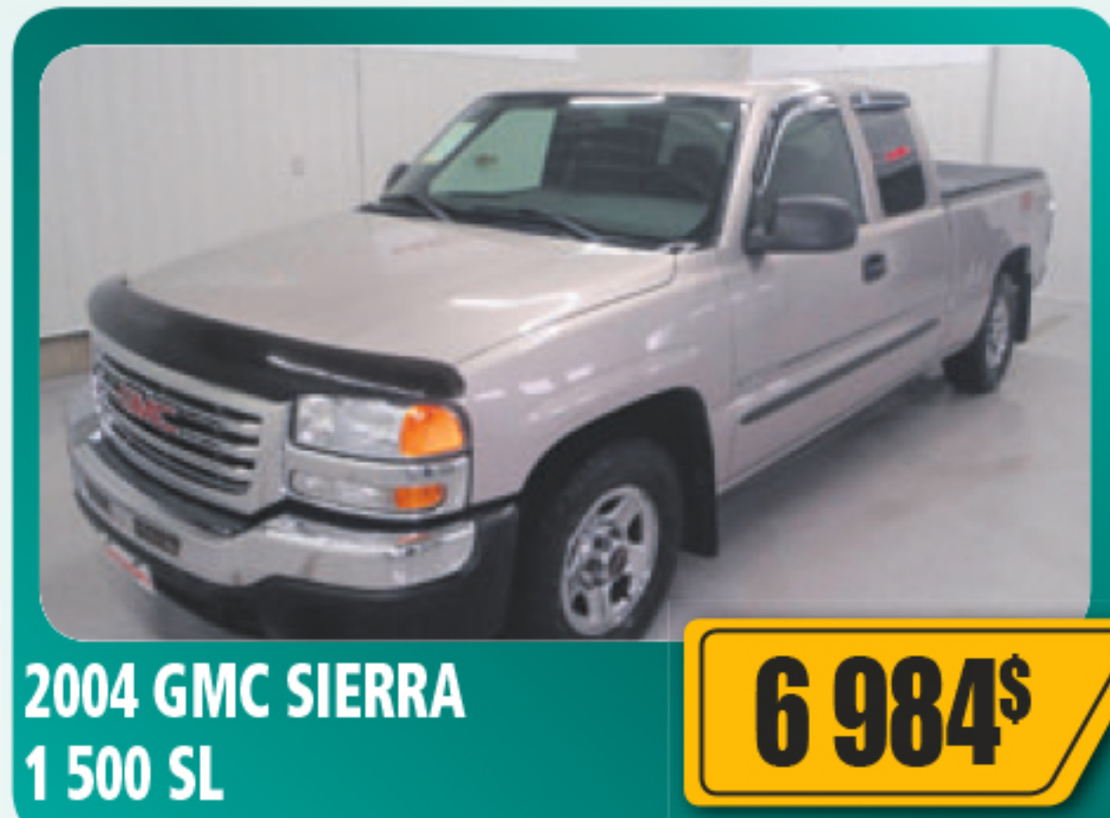
2004 GMC SIERRA 1 500 SL 6 984$ 4 portes, V8, automatique, air climatisé, roues en alliage et plus. 130 580 km • Stock : 2014376B