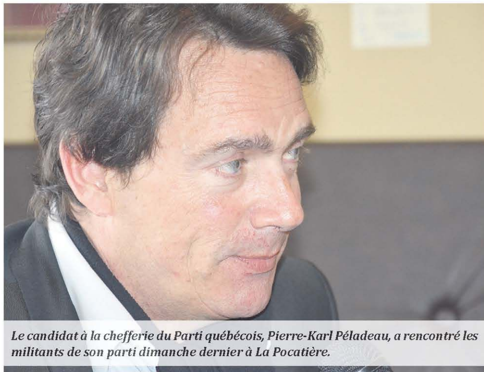
Le candidat à la chefferie du Parti québécois, Pierre-Karl Péladeau, a rencontré les militants de son parti dimanche dernier à La Pocatière.

« Il n'y a pas de Québec sans les régions », a d'entrée de jeu déclaré le député de Saint-Jérôme devant les médias régionaux après s'être adressé aux militants réunis au restaurant Café Azimut, dimanche dernier. Pour lui, il est important de rencontrer les gens sur le terrain afin de se faire connaître et de connaître leurs attentes.