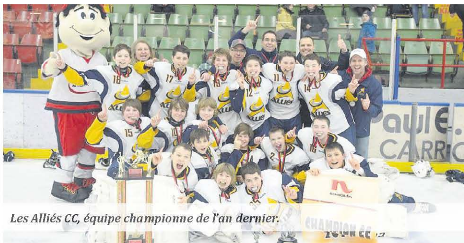
Les Alliés CC, équipe championne de l'an dernier.

MONTMAGNY – Le 55 e Tournoi national Opti Pee-Wee débutera ce jeudi 22 janvier à 18 h, avec les équipes de la classe A.