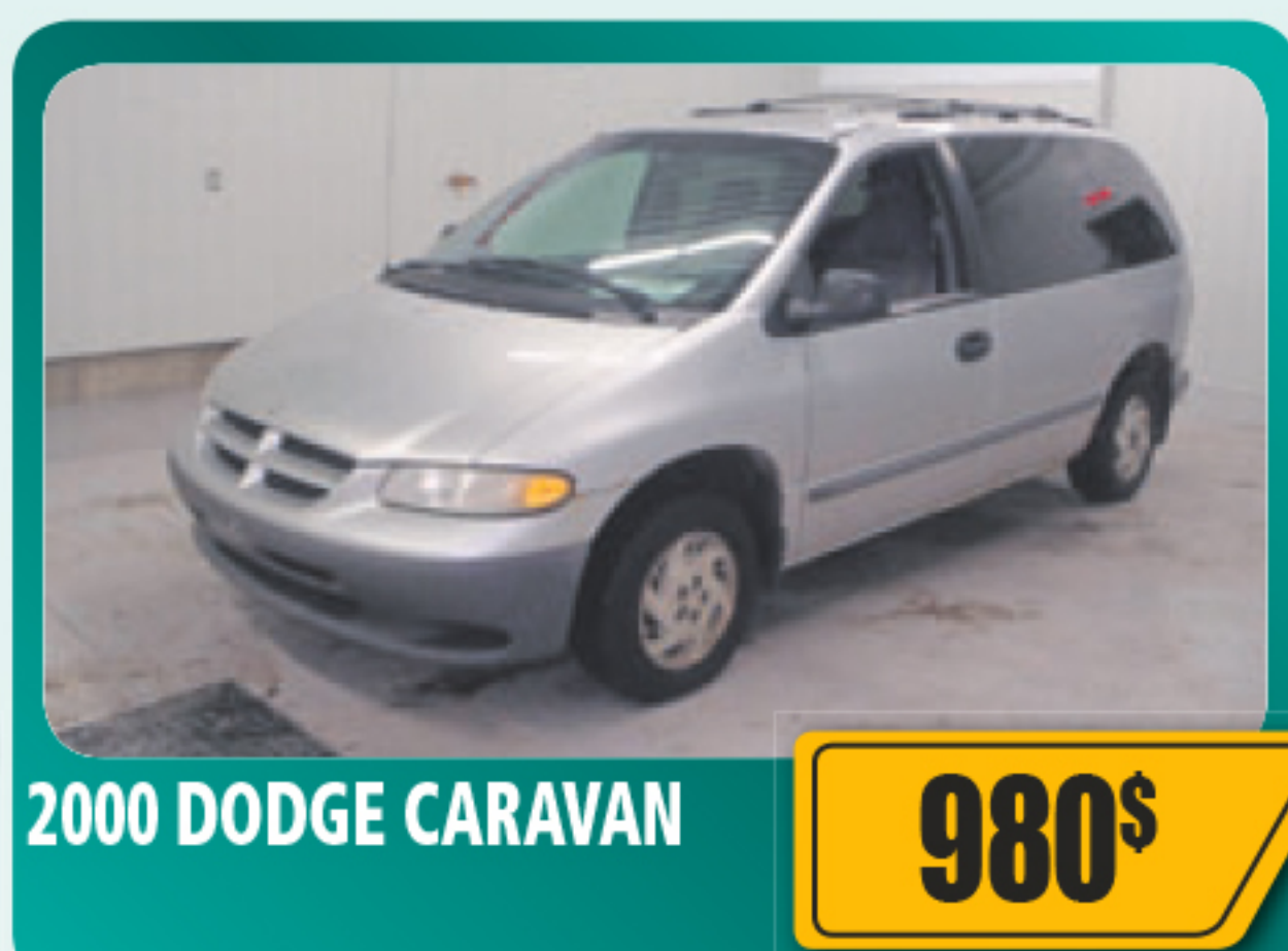
2000 DODGE CARAVAN 980$ V6, automatique, 7 places. 120 084 km • Stock : E649A