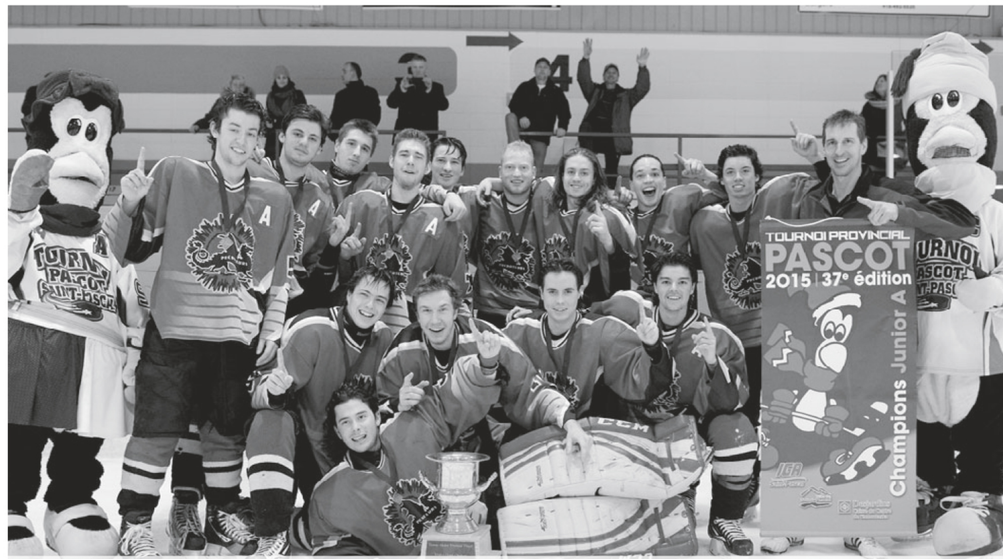
Les Prédateurs St-Marc gagnants dans le junior A.

Dans le midget A, les Bombardiers St-Hubert se sont inclinés 6-2 contre Uniprix Gagnon Gaspé qui a connu un excellent tournoi. Les Voyageurs de Cowansville ont été vaincus par les Prédateurs St-Marc 5-1 dans le junior A.