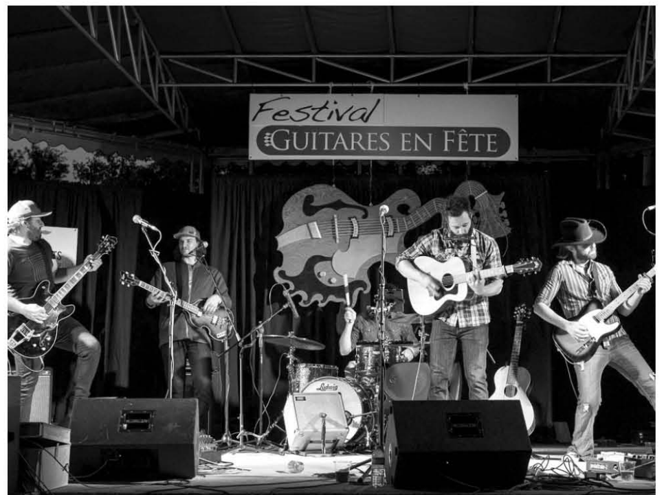
Le groupe Tire le coyote