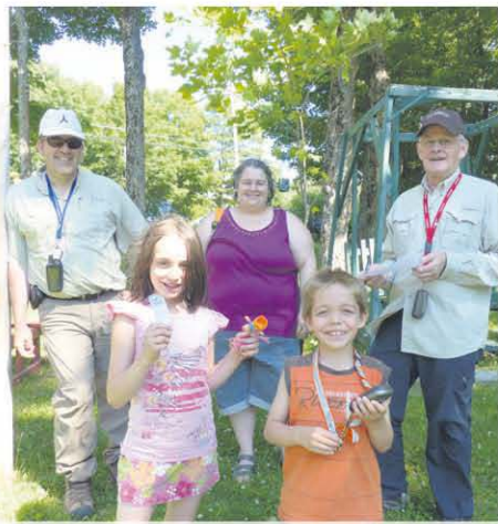
Le géocaching, c'est pour toute la famille.

Les chasseurs de trésor se rejoindront au Rest-O-Parc à 18 h pour échanger autour d'une pizza avec des géocacheurs d'expérience. Information et réservation : Carole Corson, carole.corson@videotron.ca ou 418 498-3336.