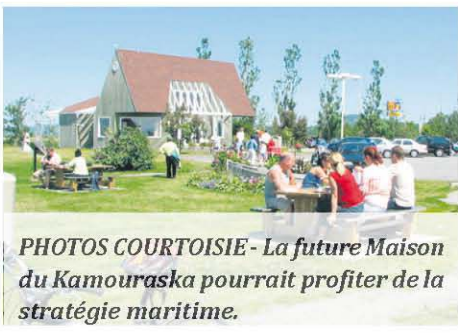
La future Maison du Kamouraska pourrait profiter de la stratégie maritime.