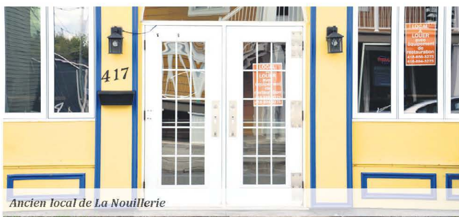
Ancien local de La Nouillerie