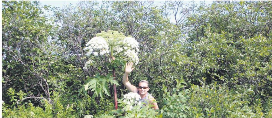
Photo de berce du Caucase prise à Saint-Gabriel, par les employés municipaux.

immenses et profondément découpées, ses taches violacées sur les tiges et ses fleurs blanches. Il faut donc éviter de la toucher lorsqu'on la voit et signaler son emplacement. On peut notamment communiquer avec le ministère du Développement durable, de l'Environnement et de la Lutte contre les changements climatiques au 1 800 561-1616. On peut aussi aviser sa municipalité ou le service de gestion intégrée de l'eau de la MRC de Kamouraska au 418 492-1660, poste 241.