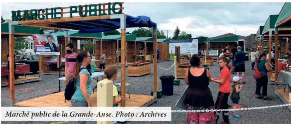
Marché public de la Grande-Anse.

La saison estivale des marchés publics débute officiellement dans le Bas-Saint-Laurent. L'effervescence des marchés publics se fait sentir à la grandeur de la province pendant l'été et rend les assiettes des Québécois plus locales que jamais.