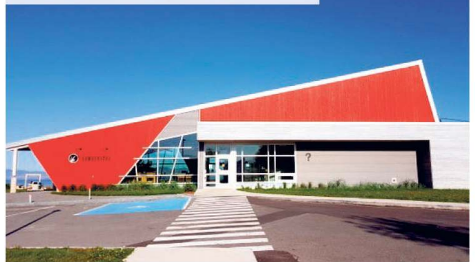
La Maison du Kamouraska à La Pocatière.

Une situation qui était déjà problématique avant la pandémie pourrait donc s'amplifier. Selon Mme Tremblay, cet impact pourrait se faire sentir chez certains propriétaires qui pourraient fermer leurs portes plus souvent, pour donner une pause aux employés, en opérant, par exemple, seulement cinq jours par semaine.