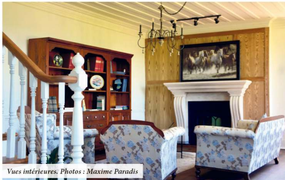
Vues intérieures.

La pierre, omniprésente à l'extérieur, se démarque aussi au premier niveau. Ensuite, elle se décline principalement sur les manteaux de cheminée des étages supérieurs. Au nombre de trois, deux de ces cheminées ont retrouvé leur pleine fonctionnalité. La troisième trône