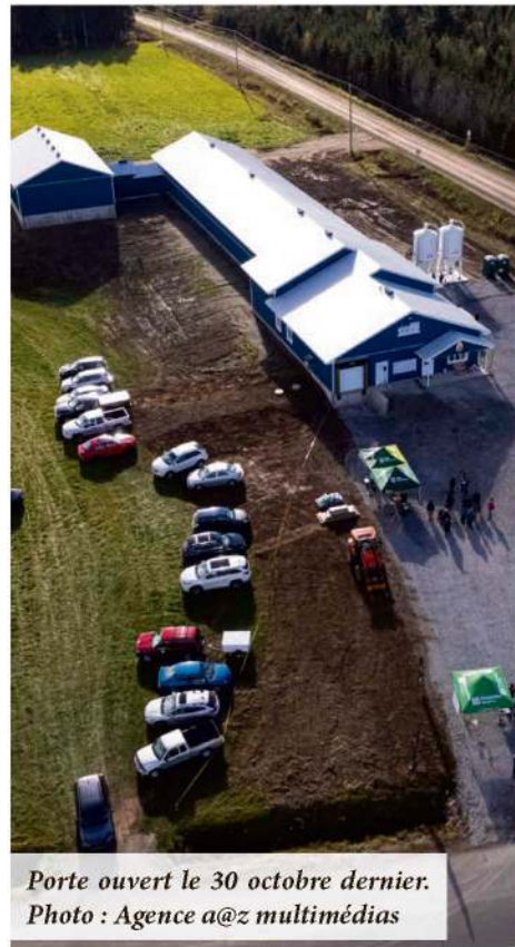
Porte ouvert le 30 octobre dernier.

Au cours des prochaines semaines, elle prévoit ouvrir une boutique à la ferme sur le rang 6 à Saint-Onésime pour offrir les produits d'agneaux, d'érable et les œufs frais de la ferme.