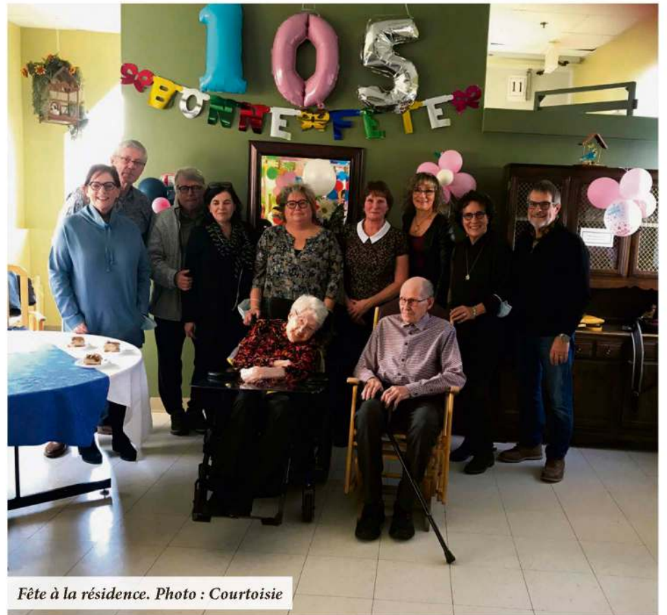
Fête à la résidence.

La famille est importante pour la dame qui a soufflé 105 bougies, elle qui a toujours apprécié les rassemblements familiaux pour « placoter ». Elle prend des nouvelles des membres de la famille chaque fois qu'elle a de la visite. Si la période pandémique a été difficile étant donné qu'elle ne pouvait voir ses proches qu'à l'aide de la tablette, elle affirme s'être toujours sentie en sécurité au CHSLD. Passionnée de lecture, elle raconte aujourd'hui qu'elle aurait aimé aller à l'université, possiblement en littérature