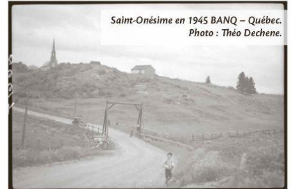
Saint-Onésime en 1945