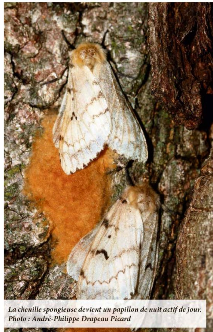
La chenille spongieuse devient un papillon de nuit actif de jour.

Selon le préposé aux renseignements entomologiques, les œufs de la spongieuse sont facilement repérables sur l'écorce des arbres puisqu'ils prennent l'allure d'une mousse qui peut contenir entre 100 et 1000 œufs sur un diamètre équivalent à une pièce de 1 $. Le pire ennemi pour ces œufs est le froid hivernal qui lorsqu'il se maintient autour de -20 °C durant plusieurs jours peut tuer jusqu'à 95 % d'entre eux.