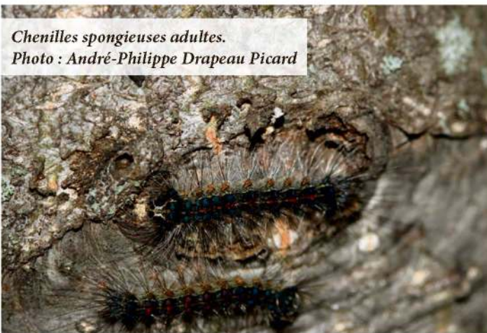
Chenilles spongieuses adultes.

«J'ai remarqué beaucoup d'œufs sur l'écorce des arbres, ce qui démontre que les individus observés l'été dernier n'étaient pas quelques sujets isolés, mais un signe que l'espèce est bien implantée et que son expansion se poursuit vers l'Est-du-Québec», poursuit-il.