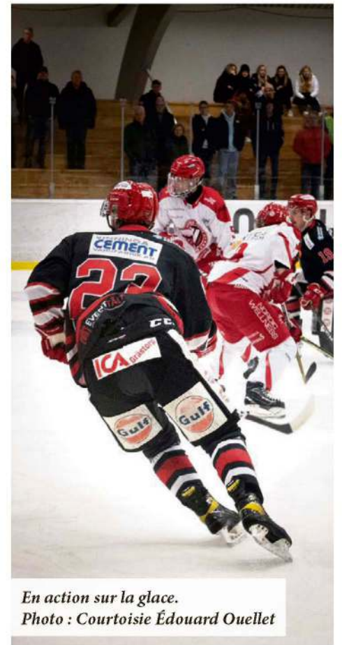
En action sur la glace.

dans le circuit, lui qui évolue actuellement dans la 4 e ligue du pays qui rassemble environ 70 équipes.