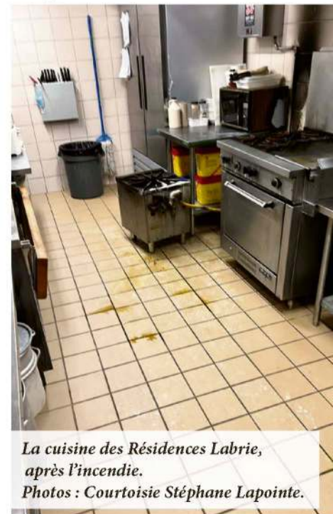
La cuisine des Résidences Labrie, après l'incendie.