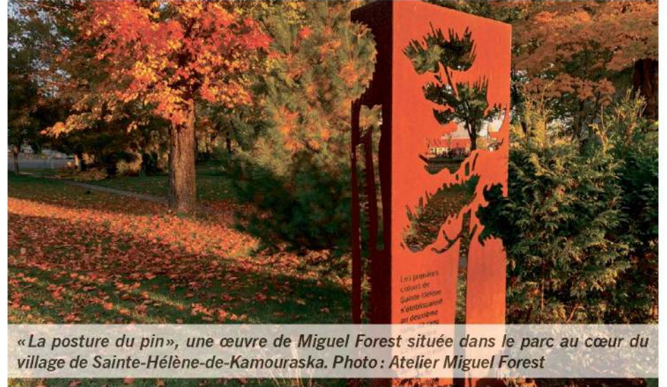
«La posture du pin», une œuvre de Miguel Forest située dans le parc au cœur du village de Sainte-Hélène-de-Kamouraska.

La route touristique en question n'est pas encore lancée officiellement, mais est en préparation. Elle sera sans doute tournée vers les thèmes agrogourmand et paysager, contemplatif. Elle pourrait être évolutive, avec ces œuvres qui s'ajouteront ou la mise en place d'un balado qui parle de l'histoire du Haut-Pays, à titre d'exemple.