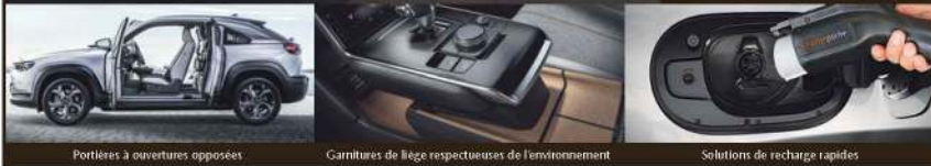
Portières à ouvertures opposées

2 ANS SANS FRAIS D'ENTRETIEN PÉRIODIQUE* + 500 $ BONI MAZDA POUR VÉ* + 2 ANS D'ESSAI DES SERVICES CONNECTÉS MAZDA*