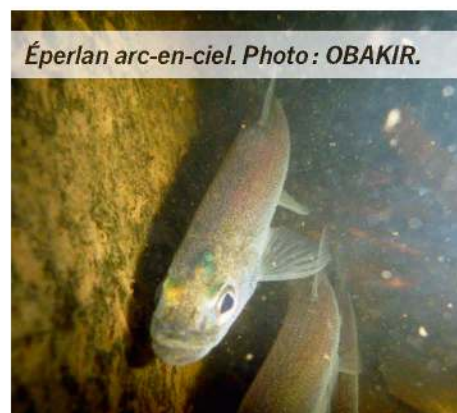
Éperlan arc-en-ciel.

«L'acquisition de connaissances qui va découler de ce projet de démantèlement est très importante et doit être bien documentée, car il est à prévoir qu'il y aura davantage d'entreprises similaires dans le futur. On peut donc penser que les observations qui seront faites au barrage de rivière Trois-Saumons permettront d'orienter le travail ailleurs.»