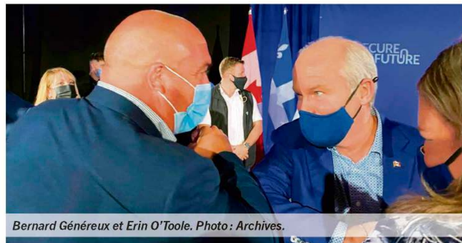
Bernard Généreux et Erin O'Toole.