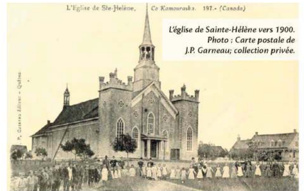
L'Église de Ste-Hélène, Co-Kamouraska. 197.- (Canada) L'église de Sainte-Hélène vers 1900.