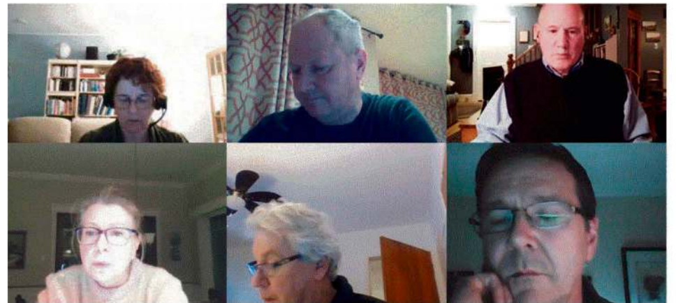
Séance du conseil de Kamouraska en ligne le 17 janvier dernier.

Andrew Caddell a dit estimer qu'il aurait été possible épargner au moins 100 000 $ sur ces projets. La mairesse a rappelé qu'il s'agissait de sommes fictives qui sont des projections et qu'une économie pourrait être possible lors des appels d'offres. Le plan a aussi été approuvé par quatre voix contre deux.