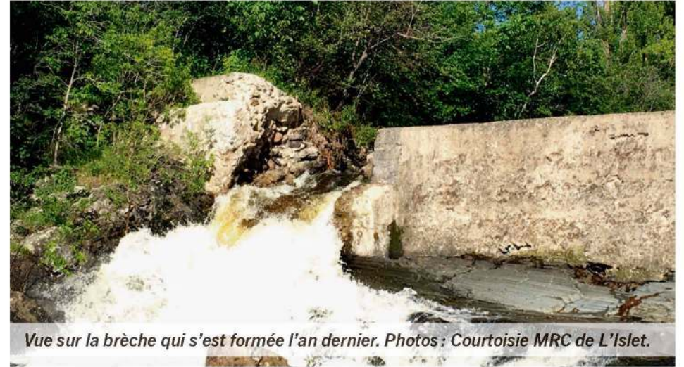
Vue sur la brèche qui s'est formée l'an dernier.