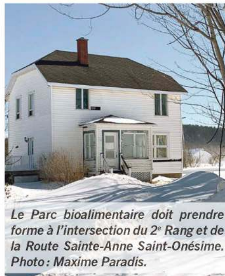
Le Parc bioalimentaire doit prendre forme à l'intersection du 2 e Rang et de la Route Sainte-Anne Saint-Onésime.

Une fois l'acquisition du terrain finalisée avec le CDBQ, le parc bioalimentaire pourra désormais accueillir ses premières entreprises. L'automne dernier, Le Placoteux rapportait que le centre collégial de transfert de technologie (CCTT) Biopterre avait un intérêt pour y réaliser un projet de serres utilisables 12 mois par année et à la fine pointe de la technologie pour y mener des projets de recherches et de l'enseignement aux étudiants du Cégep de La Pocatière ins-