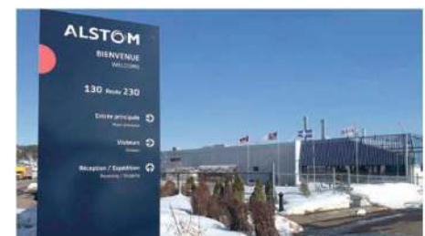
Dans la dernière semaine, l'entreprise a d'ailleurs procédé au remplacement des enseignes Bombardier par le nom Alstom sur le devant de son usine de La Pocatière.

Rappelons que 80 M$ ont été engagés l'an dernier par Alstom dans la modernisation de l'usine de La Pocatière. De cette somme, 56 M$ consistent en un prêt avec pardon du gouvernement du Québec avec comme garantie minimale de maintenir 400 emplois à l'usine d'ici 2036 et 350 pour la période 2026-2029.