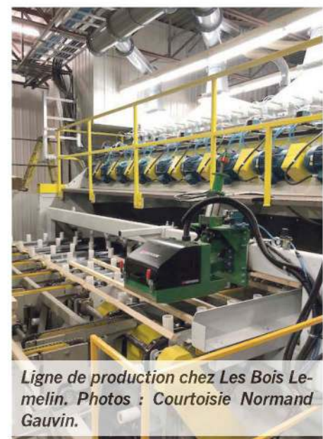
Ligne de production chez Les Bois Lemelin.

suis fait conseiller par notre député fédéral et son équipe ne pas attendre trop longtemps et de m'y mettre maintenant. Heureusement qu'on fait affaire avec une firme spécialisée pour tout le processus, car il y a tellement de formulaires à remplir et de frais liés à ça qu'il se serait facile de faire des erreurs. On ne veut pas ça.»