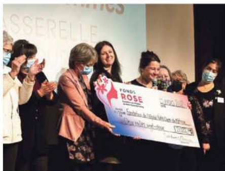
Remise d'un don de 2022 $ pour le Fonds Rose de la Fondation de l'Hôpital de Notre-de-Fatima par le Centre-Femmes La Passerelle, le 8 mars dernier.