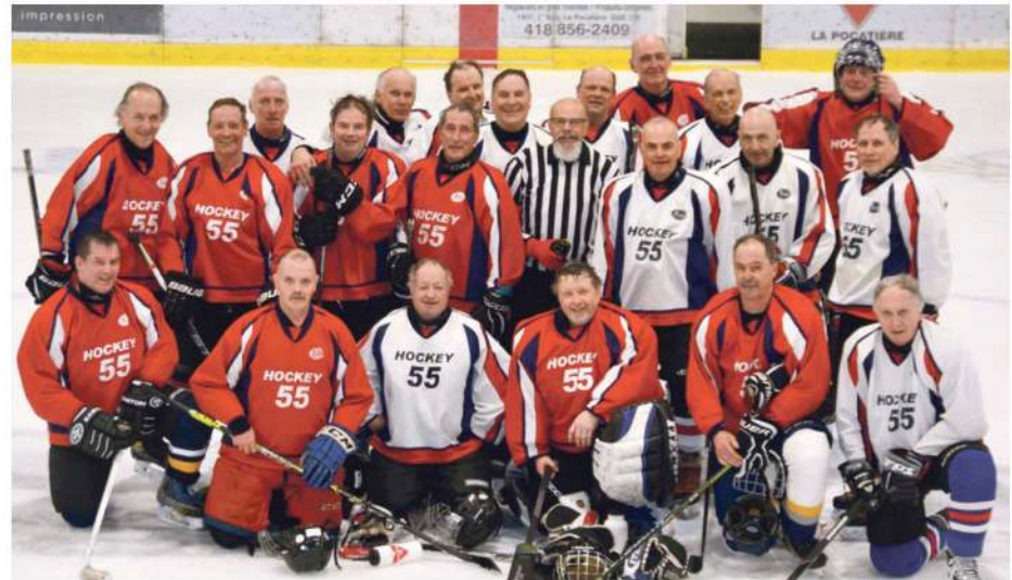
Les joueurs de la Ligue Hockey-55 présents le 11 mars dernier.