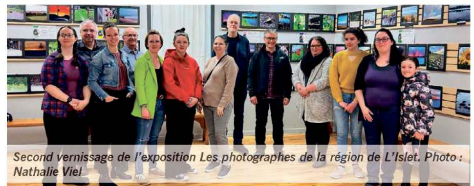
Second vernissage de l'exposition Les photographes de la région de L'Islet .