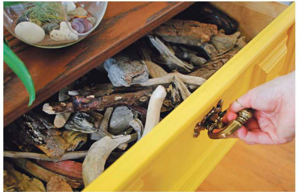
Un tiroir de bois flottant récolté.

jusqu'à ce que l'artiste se sente bien avec elle. À ce moment, elle y appose sa signature pour signaler la fin du processus.