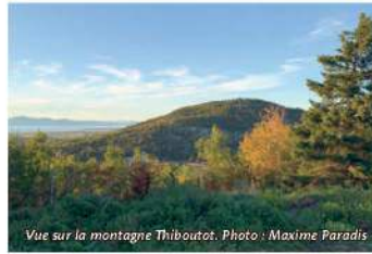
Vue sur la montagne Thiboutot.

Ces butons éparpillés, que les Abénaquis appelaient des « monadnocks », ont des noms qui font rêver : le Pain de sucre, la Montagne à Coton, la montagne à Plourde, la montagne Thiboutot, la montagne du Collège, la montagne Ronde, la montagne Pointue, les montagnes du Mississippi — du grand fleuve, en algonquin. J'ai découvert qu'on les appelait autrefois dans la région des cabourons — caburons ou gaburons —, des mots sans doute dérivés de caboche, cabochon.