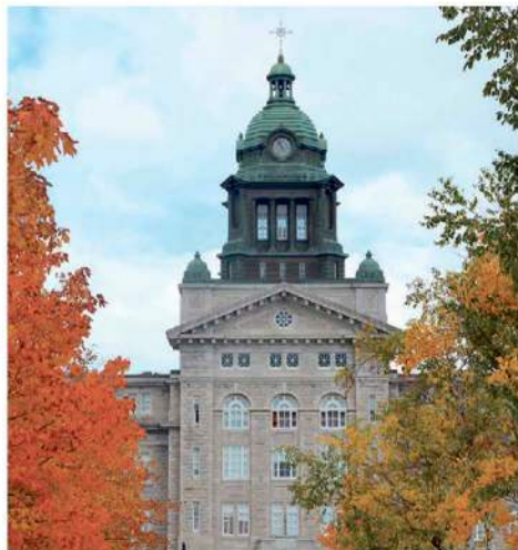
Le Collège de Sainte-Anne-de-la-Pocatière en automne.