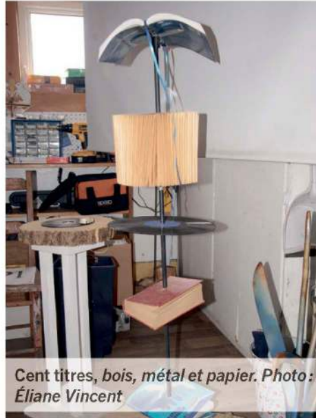
Cent titres, bois, métal et papier.

Après quelques recherches, c'est finalement la lumière du Kamouraska qui l'a séduit et inspiré, et en 1999 il achète la maison Massé dans le 6 e Rang à Mont-Carmel. «Je n'ai pas posé de questions. Je ne regardais même pas la maison, je regardais à l'extérieur : chaque fenêtre était un tableau!»