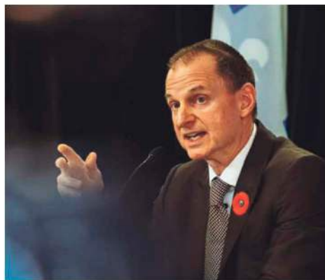
Éric Girard, ministre des Finances du Québec. Photo tirée du Facebook Eric Girard, député de Groulx à l'Assemblée nationale.

Source : Table régionale des élus municipaux du Bas-Saint-Laurent