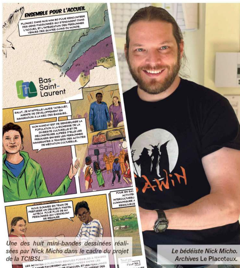
Une des huit mini-bandes dessinées réalisées par Nick Micho dans le cadre du projet de la TCIBSL.

Huit thématiques ont été retenues pour le projet. Enseignants en francisation, bénévoles impliqués dans les activités interculturelles ou de jumelage, et agents de développement en immigration sont autant d'acteurs qui collaborent à l'accueil et à l'intégration des personnes immigrantes au Bas-Saint-Laurent, et qui sont mis en lumière à travers les mini-bandes dessinées de Nick Micho. « Ce qui est agréable, c'est que Nick s'est réellement inspiré du portrait de personnes réelles, mais avec quelques traits différents,