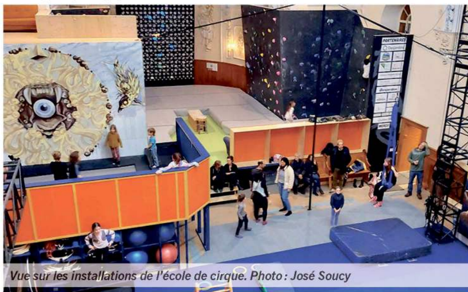
Vue sur les installations de l'école de cirque.

«Je suis vraiment excitée de prendre part au projet, et en plus, on a une grande volonté de développement de l'endroit. Bienvenue à tous!», a-t-elle conclu.