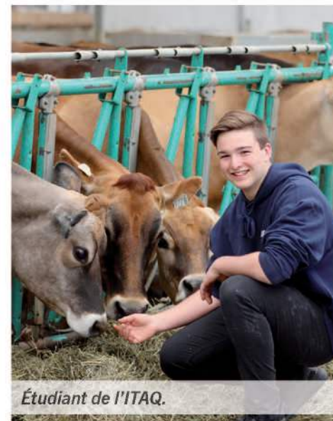
Étudiant de l'ITAQ.