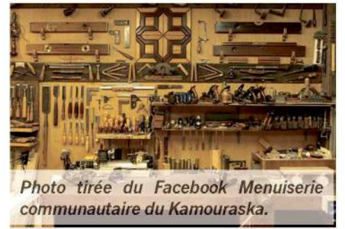
Photo tirée du Facebook Menuiserie communautaire du Kamouraska.