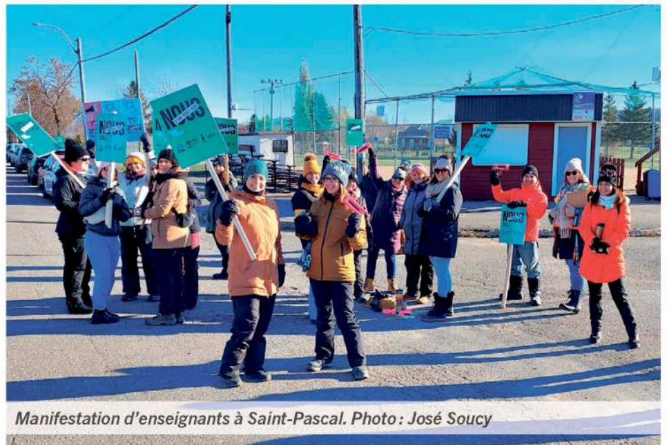
Manifestation d'enseignants à Saint-Pascal.

Qui plus est, toujours selon le délégué syndical local, la récente proposition du Conseil du Trésor — qui offrirait une hausse salariale de 9% à 10,3% sur cinq ans, accompagnée d'un montant forfaitaire de 1000 $ — n'est pas suffisante pour combler l'inflation présente. « Nous sommes nettement en deçà de l'inflation avec l'offre patronale ».