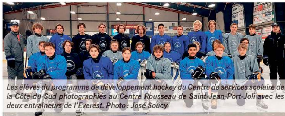
Les élèves du programme de développement hockey du Centre de services scolaire de la Côte-du-Sud photographiés au Centre Rousseau de Saint-Jean-Port-Joli avec les deux entraîneurs de l'Everest.

une participation financière des MRC de L'Islet et de Montmagny, de 60 000 $ chacune pour une durée de trois ans, le transport scolaire est organisé chaque semaine à partir des écoles secondaires concernées vers le lieu de pratique.