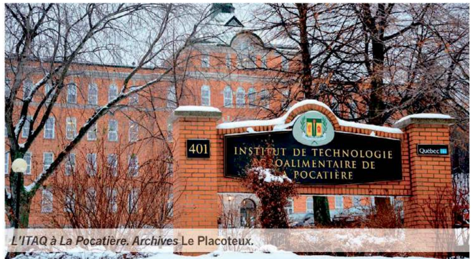
L'ITAQ à La Pocatière.

Tout d'abord, je tiens à souligner que notre