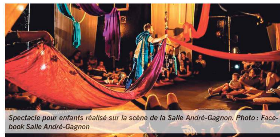
Spectacle pour enfants réalisé sur la scène de la Salle André-Gagnon.