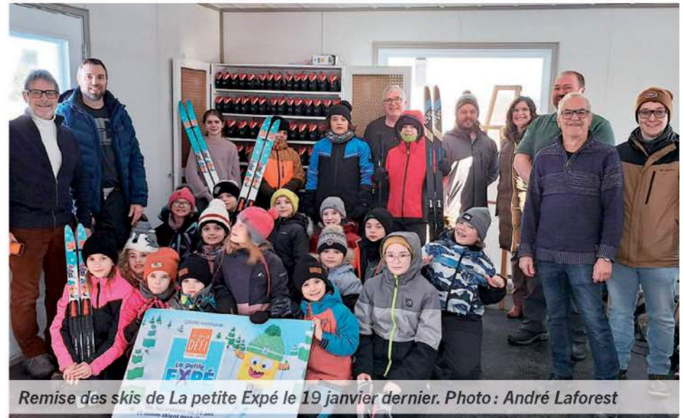
Remise des skis de La petite Expé le 19 janvier dernier.

«L'hiver, au Québec, on voit souvent un relâchement des activités physiques extérieures en raison des conditions météo, même avec toutes les ressources et infrastructures que nous avons pour motiver les jeunes à aller jouer dehors. Ce que nous faisons avec La petite Expé, c'est d'inciter les jeunes à garder