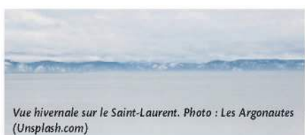
Vue hivernale sur le Saint-Laurent.

Il est peut-être temps que nous apprenions à nommer notre nordicité : un bel exercice pour les enfants à l'école.