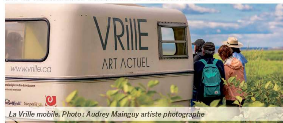
La Vrille mobile.