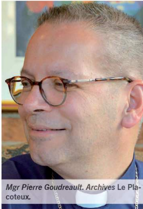
Mgr Pierre Goudreault.

Dans le diocèse de Sainte-Anne-de-la-Pocatière, Mgr Goudreault estime qu'une bonne dizaine de bâtiments religieux ont été cédés à la communauté depuis 25 ans. Ces requalifications — qui ont donné naissance dans plusieurs cas à différents projets articulés autour d'organismes à but non lucratif portés par des laïcs — originent à la base de réflexions entamées par les conseils de fabrique locaux,