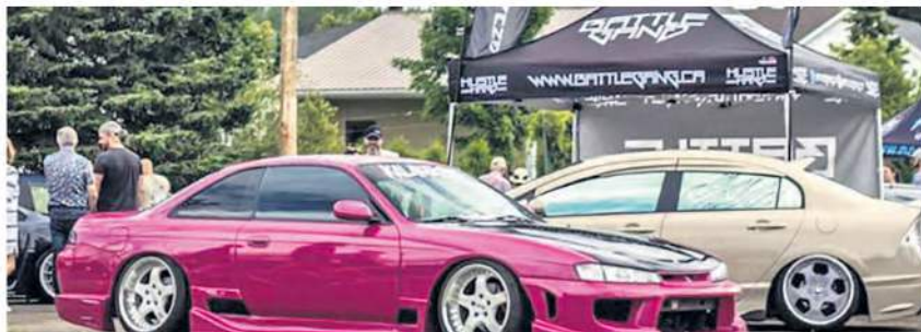
Pour la troisième année consécutive, le JP's Event Car Show présenté par Les Industries Desjardins sera de retour le samedi 27 juillet au Centre sportif de Saint-Pascal.

Pour la troisième année consécutive, le JP's Event Car Show présenté par Les Industries Desjardins sera de retour le samedi 27 juillet 2024 au 420, rue Notre Dame à Saint-Pascal (Centre sportif). Les amateurs de véhicules antiques ou modifiés pourront ainsi assouvir leur passion avec une multitude de kiosques et d'activités. En effet, de la musique, de la nourriture, un barbier, un tatoueur et plus encore vous attendent pour cette journée qui sera riche en rebondissements! Cette année, l'entièreté des profits de l'événement ira à Opération Enfant Soleil. (J.S)