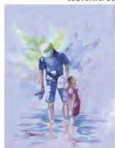
«Tu vois mes pieds?», Photo courtoisie d'Andrée Alexandre.

Je vous invite à porter attention à ce qui vous rend heureux et heureuses et d'en faire votre guide de vie!