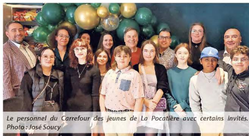
Le personnel du Carrefour des jeunes de La Pocatière avec certains invités.