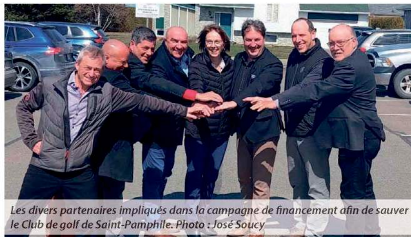
Les divers partenaires impliqués dans la campagne de financement afin de sauver le Club de golf de Saint-Pamphile.

Cette campagne de financement est déjà bien entamée, puisque les dirigeants de Matériaux Blanchet ont confirmé un partenariat majeur avec un montant de 100 000 $ échelonné sur dix ans. Le lieu