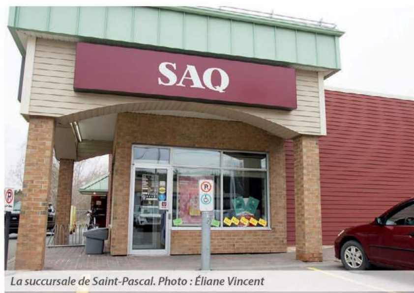
La succursale de Saint-Pascal.