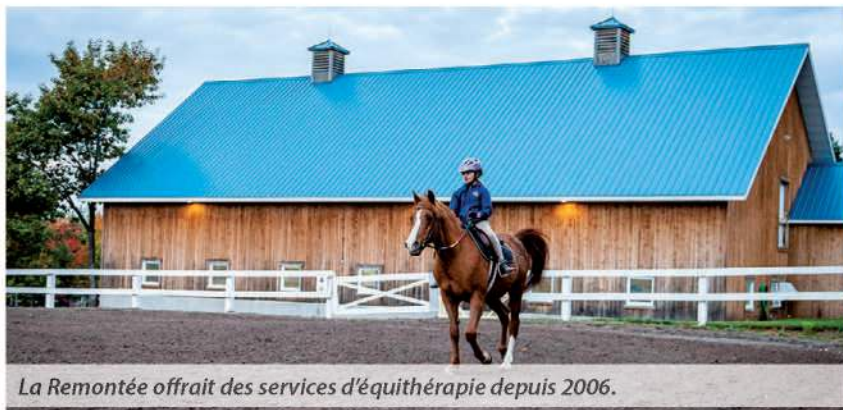
La Remontée offrait des services d'équithérapie depuis 2006.