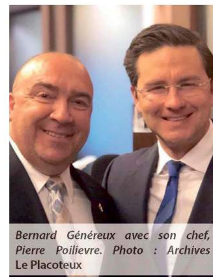
Bernard Généreux avec son chef, Pierre Poilievre.

Quelques minutes après son expulsion, le chef conservateur en a ajouté une en couche sur son compte X, en réaffirmant