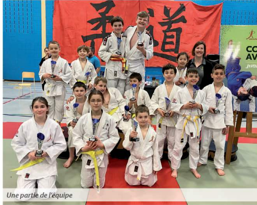
Une partie de l'équipe