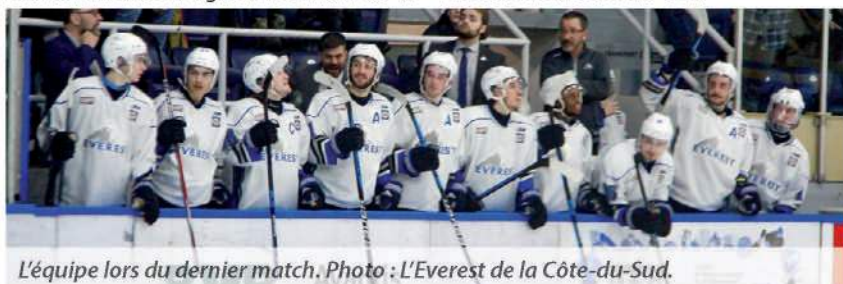
L'équipe lors du dernier match.

Malgré cet échec crève-cœur en finale, l'organisation se dit satisfaite de son rendement, même si elle n'a pas réussi à mettre la main sur la célèbre coupe. « L'équipe est fière du support obtenu de la part des partisans de hockey de la Côte-du-Sud, mais également des différents partenaires de l'organisation. Avoir plus de 1200 spectateurs en moyenne lors des séries éliminatoires est définitivement digne de mention », a déclaré Luc Carboneau, agent de communication pour l'Everest de la Côte-du-Sud.