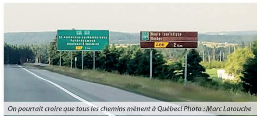
On pourrait croire que tous les chemins mènent à Québec!

lent à la hauteur du ruisseau d'Omer-Boutin, au kilomètre 13 de la route 289. Le remplacement de la structure de grande dimension, située sous un remblai d'une dizaine de mètres, nécessite d'importants travaux d'excavation, ce qui a entraîné la fermeture complète de la route 289 pour une durée d'environ 13 semaines, depuis le 3 juin.