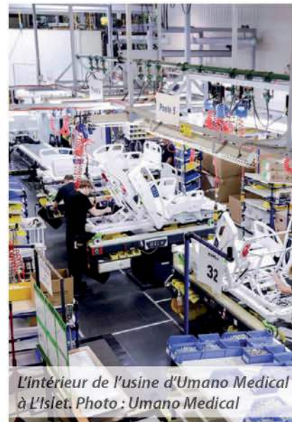
L'intérieur de l'usine d'Umano Medical à L'Islet.

à l'échelle internationale. Elle dénombre aujourd'hui plus de 300 employés répartis entre son siège social de L'Islet et son bureau de Lévis.