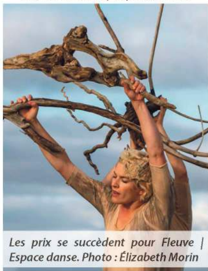
Les prix se succèdent pour Fleuve | Espace danse.