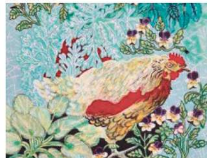
De très belles œuvres seront présentées.