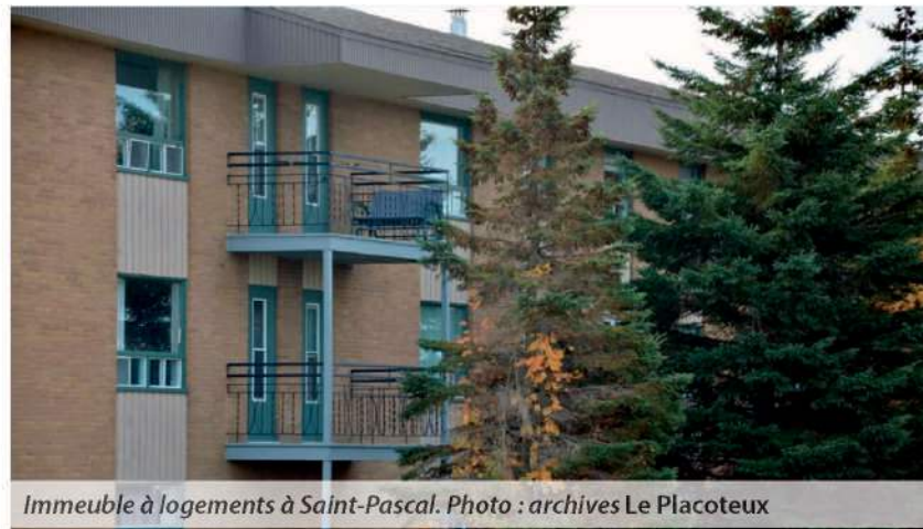
Immeuble à logements à Saint-Pascal.

« Le gouvernement dit tout faire pour stimuler la construction de nouvelles unités, mais son programme, le PHAQ censé remplacer AccèsLogis, est un échec sur toute la ligne. Après six ans, la CAQ doit prendre la mesure et la responsabilité de ses échecs répétés en habitation, et évi-