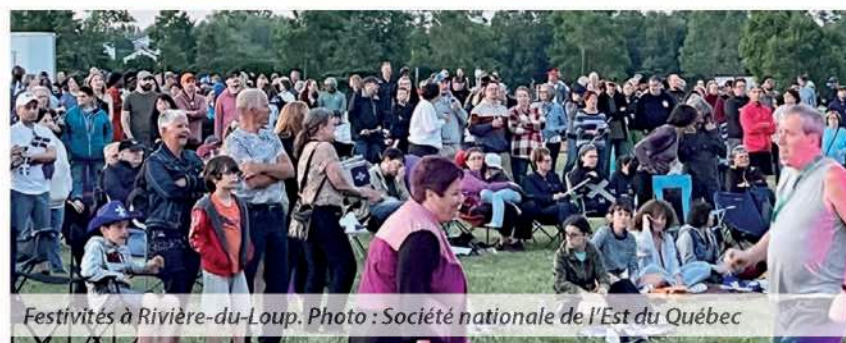
Festivités à Rivière-du-Loup.