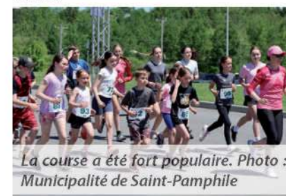
La course a été fort populaire.

Une nouvelle activité de yoga chaise a été offerte, et le Bar laitier Chouinard était sur place pour satisfaire les plus gourmands.