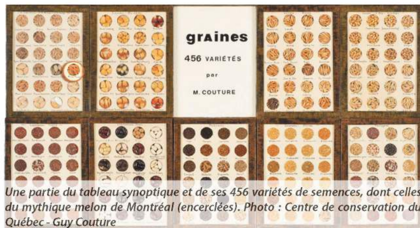
Une partie du tableau synoptique et de ses 456 variétés de semences, dont celles du mythique melon de Montréal (encadrées).

La réalité est comme toujours plus nuancée. Et si le MQAA possède bel et bien une douzaine de graines du célèbre melon — préservées à la fin des années 1930 par Maurice Couture, finissant en agronomie —, le retour du melon de Montréal au marché public local, s'il advenait un jour, sera dû à la collaboration d'un grand nombre d'intervenants, dans