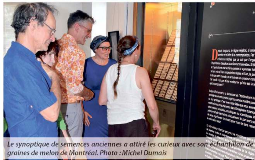
Le synoptique de semences anciennes a attiré les curieux avec son échantillon de graines de melon de Montréal.