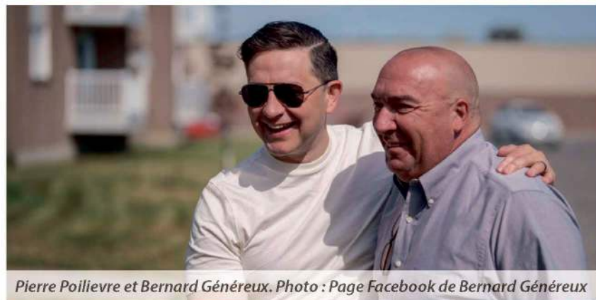
Pierre Poilievre et Bernard Généreux.