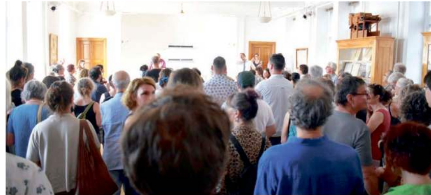
Le Tout-Kamouraska était présent au lancement de la saison.

Pour enrichir cette offre, le MQAA propose des conférences et des activités de médiation pour les jeunes. Des salles interactives permettent aux enfants de découvrir les semences de manière ludique, tandis que les adultes pourront approfondir leurs connaissances lors de conférences thématiques.