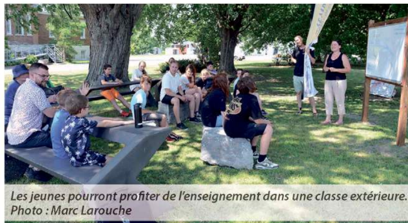
Les jeunes pourront profiter de l'enseignement dans une classe extérieure.

Le prix vient reconnaître la pertinence de leurs efforts tout au long de l'année à emboîter le pas dans des petits gestes à leur portée pour contribuer à l'environnement. « L'installation d'une classe verte