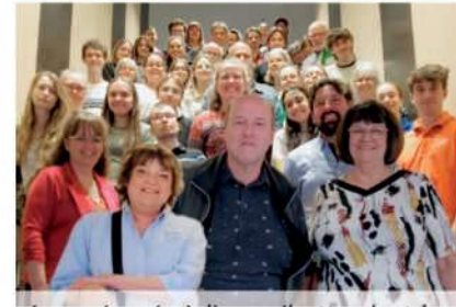
Les préposés à l'accueil attendent les visiteurs.

Le guide touristique officiel est distribué à travers le Québec et dans les lieux d'information touristique de la région, avec un tirage de 100 000 exemplaires. La carte touristique et la carte vélo sont également disponibles et peuvent être téléchargées en ligne. Le site Web de Tourisme Bas-Saint-Laurent, récemment actualisé, présente les incontournables de la région et des articles inspirants, avec une fréquentation de plus de 290 000 visiteurs en 2023, soit une augmentation de 64 % par rapport à l'année précédente. Une