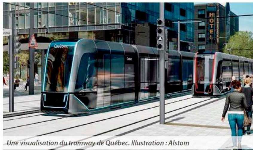
Une visualisation du tramway de Québec. Illustration : Alstom

poursuit sa croissance et ses investissements, avec des projets ambitieux et variés. « Nous fabriquons les voitures pour le Metro Mark V de Vancouver, les structures mécano soudées pour le tramway TTC de Toronto, les structures mécano soudées pour les voitures de NJT Transit, les bogies pour les tramways de Hurontario et