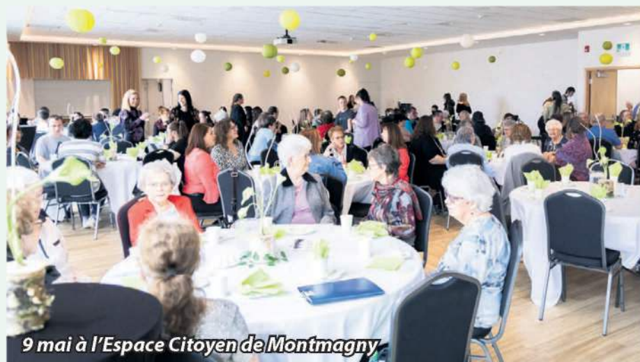
9 mai à l'Espece Citoyen de Montmagny

Par ailleurs, les élèves peuvent faire partie de comités selon leurs intérêts et organiser différentes activités pour bonifier leur expérience de vie. À titre d'exemples, des élèves et des membres du personnel ont participé à la Célébration Fillactive où ils ont réalisé un parcours de 5 km dans le plaisir. Des élèves ont aussi pris part à des compétitions amicales afin de se familiariser avec différentes options de carrière lors des Olympiades canadiennes des métiers et technologies 2024. Enfin, dans chaque CEA a eu lieu un gala de fin d'année afin de souligner les réussites des élèves en intégration sociale et en formation générale des adultes alors que des prix et bourses ont été remis.