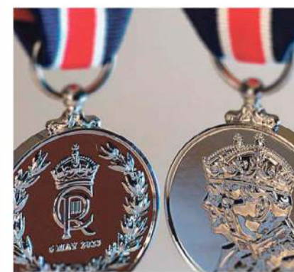
La médaille du couronnement du roi Charles III.

Rappelons que la dernière médaille octroyée par un monarque britannique a été celle instituée à l'occasion du jubilé de diamant de la reine Élisabeth II en 2012. Cette médaille a été décernée à des milliers de Canadiens pour reconnaître leur engagement communautaire et leur contribution significative à la société. Elle symbolisait la gratitude et l'appréciation envers les récipiendaires pour leur dévouement et leur service remarquable.