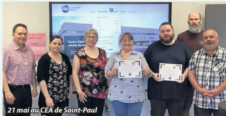
21 mai au CEA de Saint-Paul