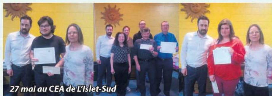
27 mai au CEA de L'Islet-Sud

Bref, l'expérience à l'éducation des adultes en vaut la peine. Pour élaborer un projet de formation ou pour obtenir de l'information, contactez Sakado. Notre équipe est prête à vous guider pour découvrir le meilleur chemin à prendre pour atteindre vos objectifs scolaires ou professionnels en vous offrant une ou plusieurs rencontres. C'est simple, gratuit et confidentiel pour la population de 16 ans et plus.