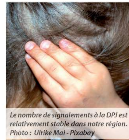
Le nombre de signalements à la DPJ est relativement stable dans notre région.

Notre région continue de se démarquer par une forte implication communautaire, et un engagement constant envers la protection de l'enfance.