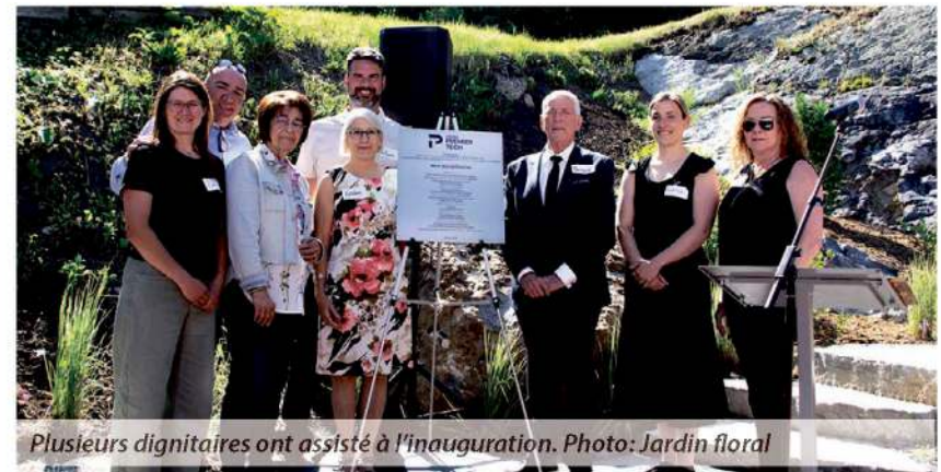
Plusieurs dignitaires ont assisté à l'inauguration.

Tous ont exprimé leur soutien à l'égard de cette nouvelle installation structurante pour la collectivité, réalisée grâce à un investissement de 225 000 $. « Notre appui au projet de construction d'une agora au Jardin floral de La Pocatière témoigne de l'engagement du gouvernement du Canada à soutenir le développement économique des collectivités partout au Québec. L'Agora, le nouveau mobilier urbain et l'aménagement paysager favoriseront non seulement l'accessibilité aux personnes en situation de handicap, mais amélioreront aussi la qualité de vie des citoyens et des visiteurs de la région. Bravo à toute l'équipe du Jardin floral de La Pocatière pour ce projet! », a déclaré Soraya Martinez Ferrada, ministre du Tourisme et responsable de Développement économique Canada. (M.L.)