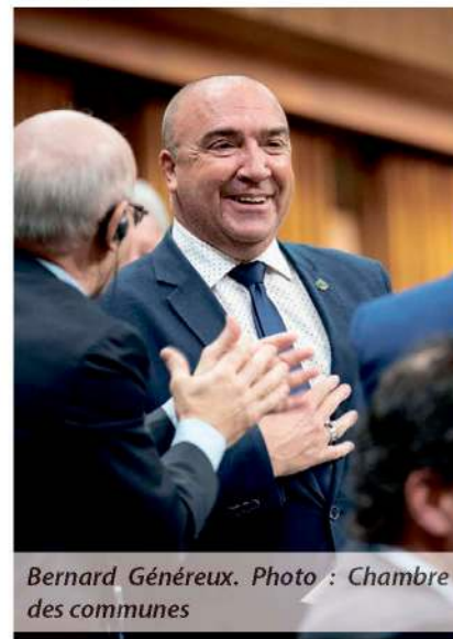
Bernard Généreux.

de dollars de manière inappropriée. La session parlementaire a peut-être pris fin, mais le travail est loin d'être terminé », a conclu Bernard Généreux qui a profité de l'occasion pour souhaiter un bel été à tous les citoyens.