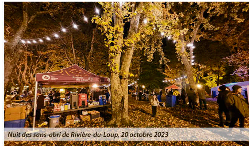
Nuit des sans-abri de Rivière-du-Loup, 20 octobre 2023