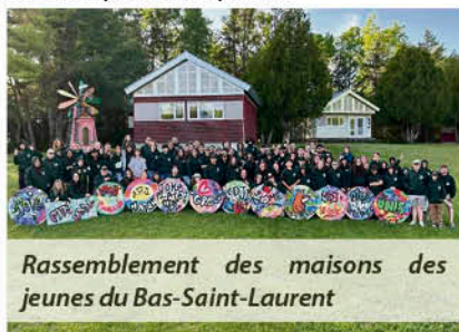
Rassemblement des maisons des jeunes du Bas-Saint-Laurent

Du côté des intervenant(e)s, on constate que ces implications inculquent aux jeunes la valeur du travail, leur montrent l'impact de leurs décisions et de leurs gestes, leur permettent de comprendre leurs responsabilités en plus de leurs droits. Une fois adultes, plusieurs le disent : leur passage à la maison des jeunes leur a appris à comprendre et à respecter les processus démocratiques, à s'exprimer et à oser prendre la parole.