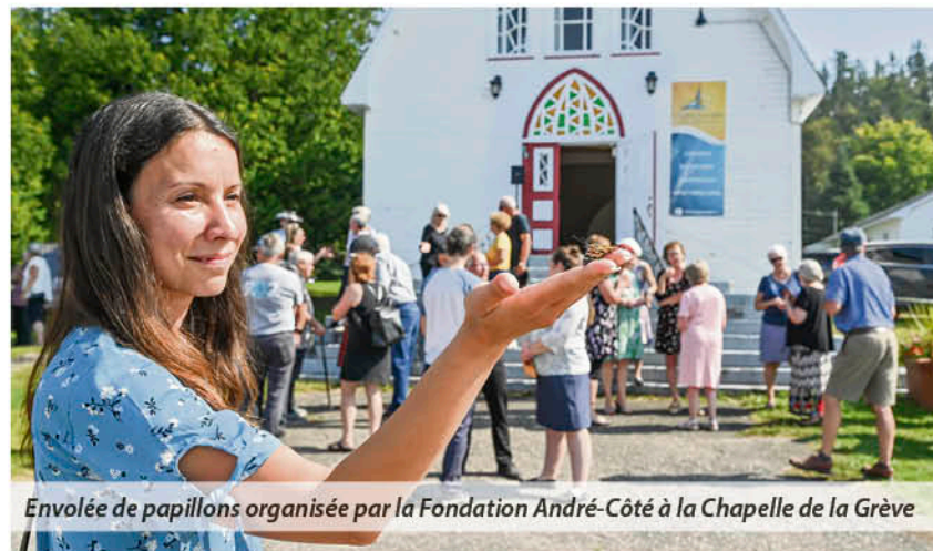
Envolée de papillons organisée par la Fondation André-Côté à la Chapelle de la Grève

Enfin, depuis deux ans, Tandem-Jeunesse est porteur et fiduciaire de Repaires-BSL, un projet communautaire qui propose des services personnalisés à haut seuil d'accessibilité en itinérance au Bas-Saint-Laurent. À long terme, Repaires-BSL vise à déployer des services d'hébergement d'urgence dans chaque MRC du Bas-Saint-Laurent, amenant ainsi de l'espoir et des solutions face aux enjeux de logement et d'itinérance grandissants.