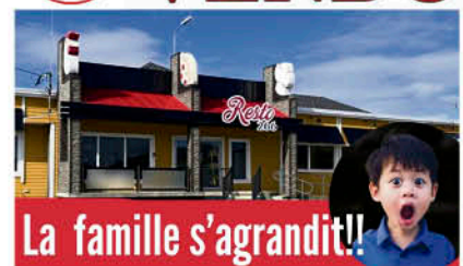
Annnonce de l'acquisition du bâtiment par la Maison de la famille