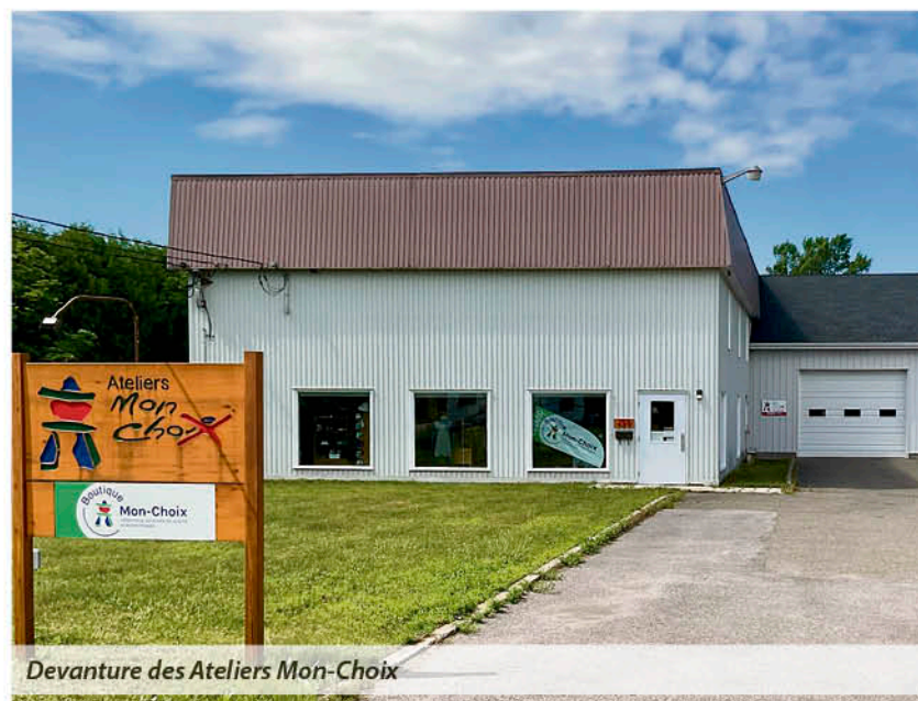
Devanture des Ateliers Mon-Choix

Cela dit, on retrouve des organismes communautaires qui ont suffisamment d'activités marchandes pour être également reconnus comme des entreprises d'économie sociale : c'est notamment le cas de Moisson Kamouraska, de Tandem-Jeunesse, et de l'Association des personnes handicapées du Kamouraska Est, avec sa boutique APHK.