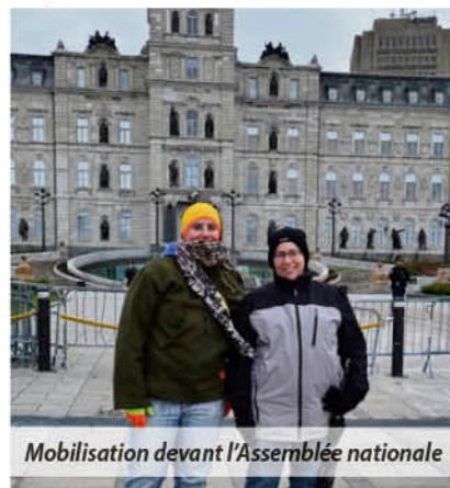
Mobilisation devant l'Assemblée nationale

En plus de l'accompagnement des personnes assistées sociales, l'offre de services de l'ADDs comprend des ateliers d'éducation populaire élaborés à partir des besoins et des intérêts des personnes prestataires de l'aide sociale. Autre manifestation de l'autonomie de l'ADDs : de nouvelles activités peuvent être développées à partir des demandes et des besoins des personnes qui fréquentent l'organisme. Le rôle de l'ADDs est notamment de redonner du pouvoir aux prestataires de l'aide sociale face à leur situation, et de les encourager dans la mobilisation — personnelle et sociale.