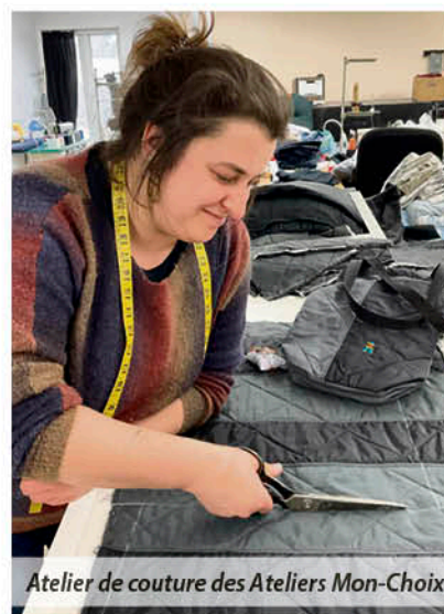
Atelier de couture des Ateliers Mon-Choix