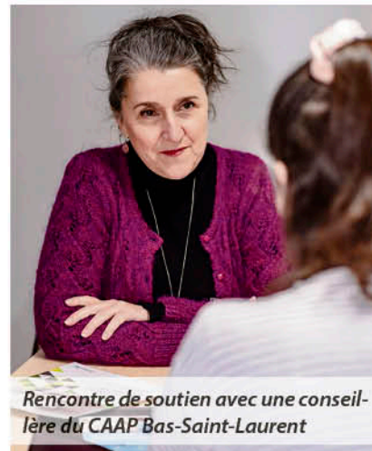
Rencontre de soutien avec une conseillère du CAAP Bas-Saint-Laurent

Depuis la création du CAAP, le nombre de dossiers et d'accompagnements est en constante augmentation, année après année, signe que le Régime d'examen des plaintes est de plus en plus connu par la population. En cas de problème ou d'interrogation, il suffit de les appeler: ça commence par de l'information, c'est confidentiel et c'est gratuit.