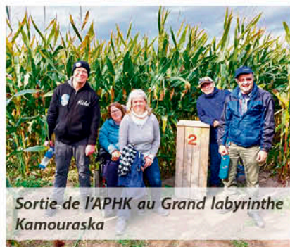
Sortie de l'APHK au Grand labyrinthe Kamouraska

L'Association des personnes handicapées du Kamouraska Est (APHK) et l'Association pocatoise des personnes handicapées (APPH) sont les deux organismes de promotion et de défense des droits des personnes handicapées au Kamouraska. On peut résumer ainsi leur raison d'être: faire une différence dans la vie des personnes handicapées, par leurs actions et leurs activités, en plus de sensibiliser la population générale à la réalité quotidienne à laquelle les personnes handicapées doivent faire face.