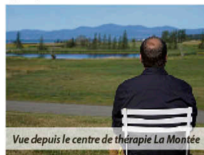
Vue depuis le centre de thérapie La Montée

Depuis plus de trente ans, le centre de thérapie en dépendances La Montée a développé une offre de services qui se distingue, et qui complète celle des CISSS et CIUSSS. En tant qu'organisme communautaire autonome, La Montée bénéficie d'une certaine souplesse et d'une capacité d'adaptation qui permet de prendre les personnes là où elles sont. C'est tout un avantage dans ce domaine d'intervention : en matière de consommation de substances, quand les gens demandent de l'aide, c'est ici et maintenant; on doit agir rapidement.