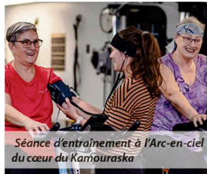
Séance d'entraînement à l'Arc-en-ciel du cœur du Kamouraska

Chaque année, pas moins de 250 personnes s'inscrivent aux entraînements réguliers, et l'organisme offre jusqu'à 44 heures d'entraînement par semaine, à raison de 39 semaines par année. Mais la demande est grande: déjà, on arrive à saturation, et l'organisme se doit encore d'évoluer pour répondre aux besoins de la communauté!