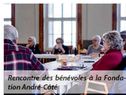
Rencontre des bénévoles à la Fondation André-Côté