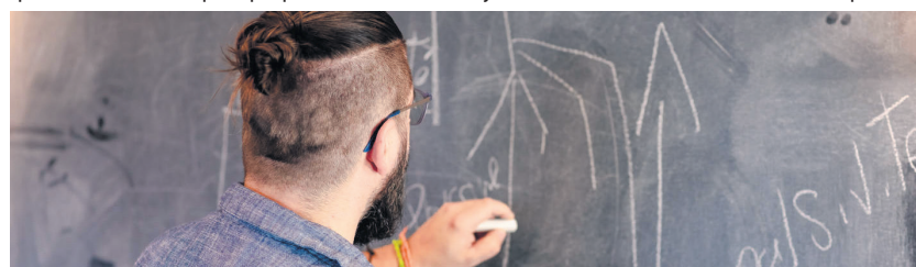
Chez Trajectoires Hommes, on aide les participants à comprendre les mécanismes qui mènent à la violence.