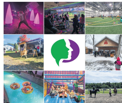
TDL Bas-Saint-Laurent offre de nombreux services, et propose plusieurs activités aux personnes atteintes de TDL.

Le TDL peut causer des difficultés d'apprentissage, et des troubles sociaux ou émotionnels. La mission principale de TDL Bas-Saint-Laurent est de faire connaître ce trouble, et de promouvoir l'accès aux services pour les personnes qui en souffrent et leurs parents.