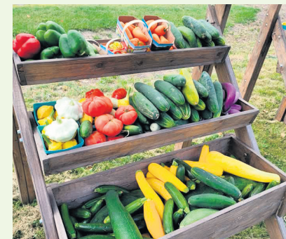
Des légumes en libre-service sont offerts dans cinq municipalités.