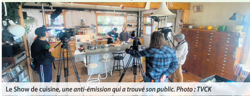
Le Show de cuisine, une anti-émission qui a trouvé son public.

La nouvelle image se reflète également sur le site internet, qui a été revampé. « Nous avons maintenant un site plus moderne, avec de l'information sur TVCK et ses services, mais aussi un accès plus facile à nos émissions, que les gens peuvent écouter à même le site web », souligne le directeur général.