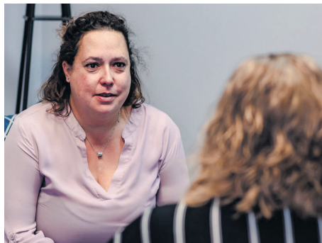
L'organisme compte sur une équipe de six personnes pour couvrir quatre MRC et une population de 90 000 personnes.

COLLABORATION SPÉCIALE : ALEXANDRE D'ASTOUS