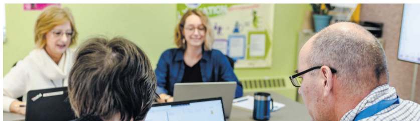
Les intervenants du SAEK guident les chercheurs d'emploi vers les ressources qui peuvent les aider.