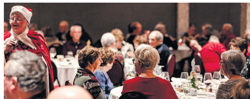
Le dîner de Noël de l'AQDR.