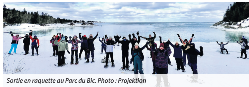
Sortie en raquette au Parc Bic.

Mme Russel propose une variété d'activités visant l'enracinement des nouveaux arrivants dans la région. « En priorité, j'organise des activités d'information. Par exemple, on va proposer bientôt un atelier sur comment bien se préparer à l'hiver. Nous aurons un atelier sur l'entretien et la conduite d'un véhicule en hiver. C'est un atelier très pratique et très apprécié par la communauté des nouveaux arrivants. »