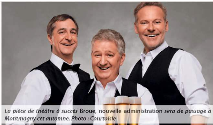
La pièce de théâtre à succès Broue , nouvelle administration sera de passage à Montmagny cet automne.