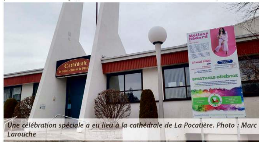
Une célébration spéciale a eu lieu à la cathédrale de La Pocatière.