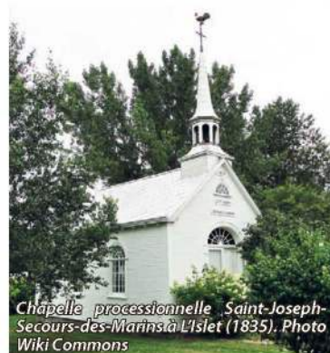
Chapelle processionnelle Saint-Joseph-Secours-des-Marins à L'Islet (1835).

On redécouvre depuis quelques années l'histoire et les récits de navigateurs de L'Islet, notamment celles de Joseph-Elzéar Bernier, de Louis-Olivier Gamache et de Wilfrid Caron. Pour rappeler l'importance et la mémoire du groupe de navigateurs de L'Islet, la chapelle de procession Saint-Joseph-Secours-des-Marins est construite en 1835 à l'est de l'église Notre-Dame-de-Bonsecours.